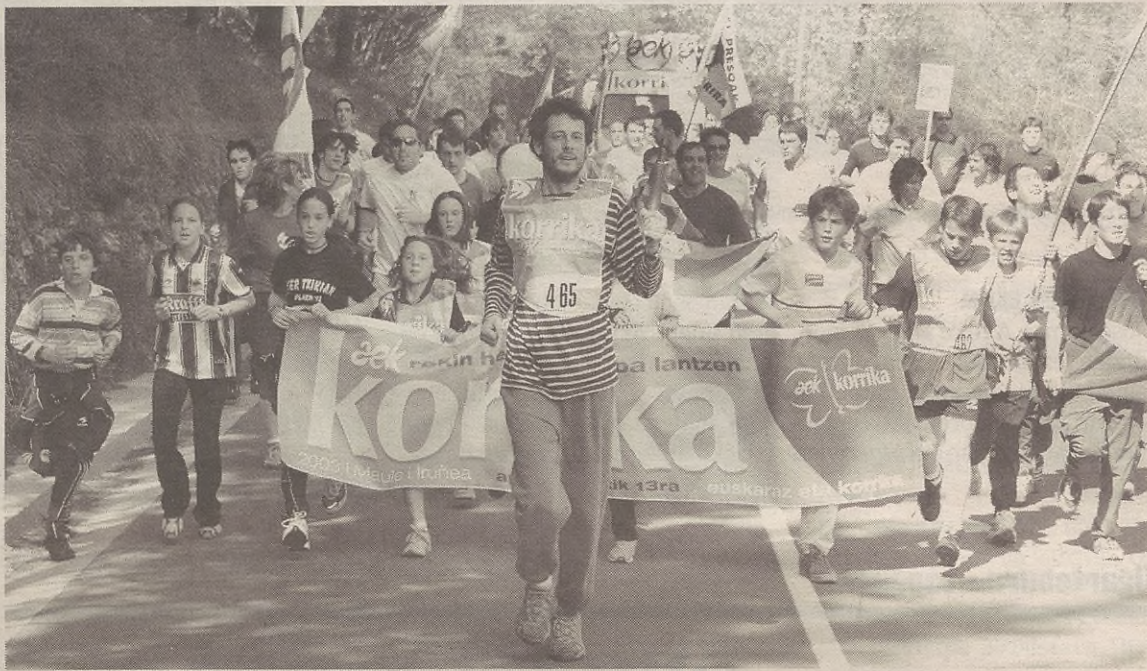
Korrika 14 eguaztenean 18:40 inguruan pasatuko da Elgetatik.

Gaztetxeak, Esna Adik, Elgeta Auzolanian plataformak eta Euskal Herrian Euskarazek elkarrekin erosi dituzte kilometroak. Gainontzeok Udalak, Herri Eskolak, tabernariak, Aralarrek, Bolinaga Metalak enpresak eta Goibeko kultura elkarteak hartu dituzte bere gain. Guztira, sei kilometro.