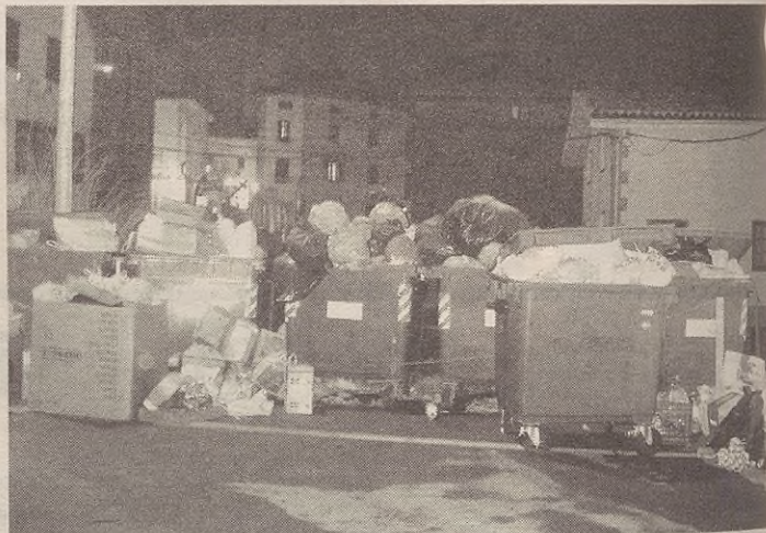
Hainbat edukiontzitan jasotzen dira zaborrak.

Datu hauek kontuan hartuta beira izan da herrian gehien birziklatu dena, 27.414 kilo. Honen ostean dago papera, 25.443 kilo batu dira. Ontziak jasotzeko edukiontzia berriagoak dira eta 6.155 kilo jaso dira. Gauza berragertatu da arroparekin; 3.750 kilo baino ez dira batu.