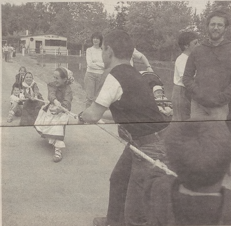
Umeendako herri-kirolak izango dira meza ostean.

Bien bitartean Gure Bordan salda eta txorizoa jateko aukera egongo da eta Asentzion bertan gaztetxeok barra ipiniko dute jateko eta edariekin.