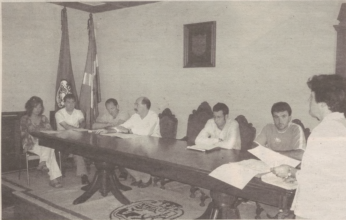
EAJ/EA koalizioko eta Aralarreko zinegotziek osatu dute orain dela gutxira arte Gobernu batzordea.