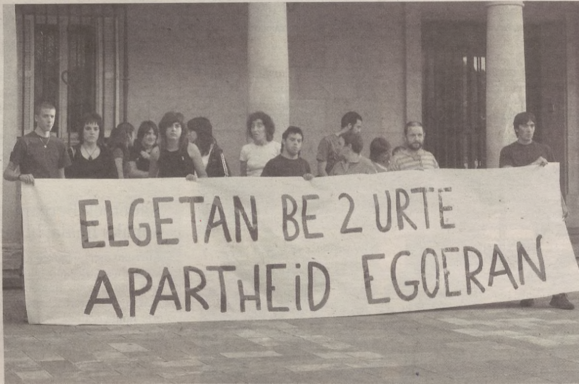
"Apartheid politikoaren kontra" lemapean kale agerraldia egin zuten eguaztenean Elgeta Auzolanean plataformak deituta.

Egun, plataformako kideek edozein herritar bezala hartzen