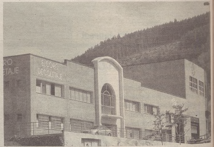
Aurten ere giro aparta egongo da Salbadorko jaietan.

Ertzaintza oraindik ikertzen ari da lapurretak nola gertatu diren eta baita kalteak zenbatekoak izan diren ere.