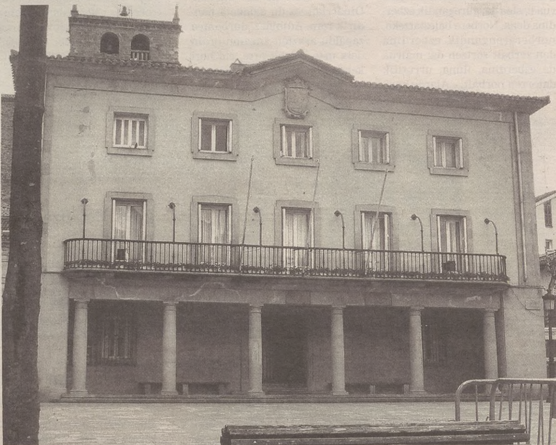
Udalean EAJ-EA koalizioko eta Aralarko zinegotziak daude agintaldi honetan.

Guztia ez da positiboa izan euren ustez. "EAJ-EAk huts egin dio agintaldi hasieran eman genion konfiantzari, eta lan egi-