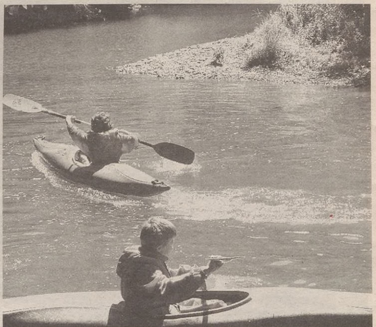
Besteak beste, 12 eta 16 urte bitartekoek piraguismoa egin ahal izango dute.

Iazko programarekin alderatuz, badaude hainbat zerbitzu berri: