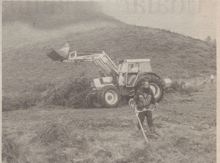
Aurrez ere egin izan dituzte garbiketa saioak Egoarbitza inguruan.

Basozainak aurkeztutako txostenaren arabera aurrekusi dute 15.000 euro beharko direla, horietatik 10.000 Foru Aldundiak ipiniko ditu.