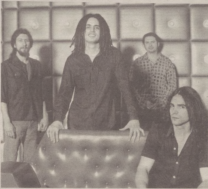
Tres Hombres talde madrildarrak zapatu gauean eskainiko du kontzertua.

Gauean musikak hartuko du toki Espaloian. Musika afroamerikarra ardatz duen Tres Hombres seikoteak jardungo du bertan. 22:30ean hasiko da kontzertua, eta jazz, blues, soul, funk, reggae, swing eta rithm&blues doinurik ez da falta izango.