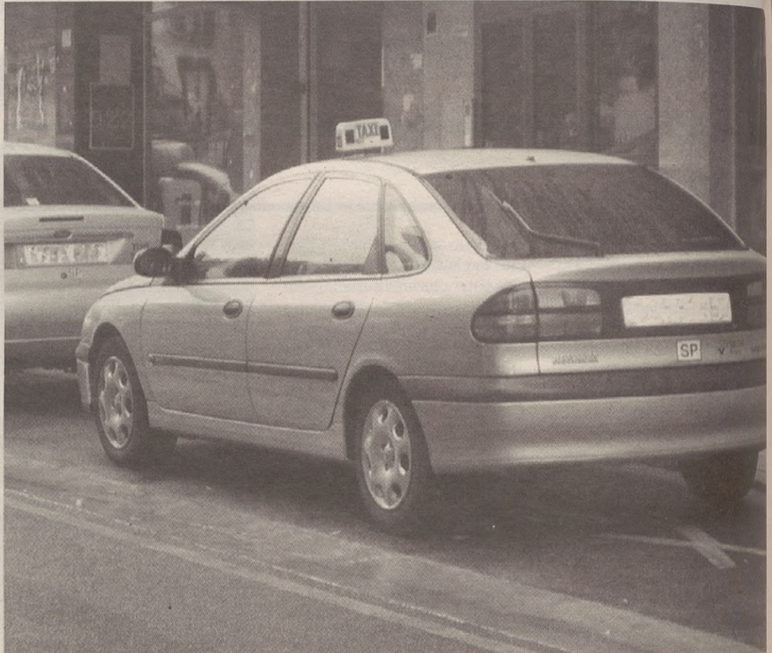
Orain arte autobusez eskainitako zerbitzua uztailean eta irailean taxi bidez egingo dute.

Erabiltzaileendako ez da aldaketarik izango bidaiari txartelen prezioan. Bidaiari bakoitzeko euro bat ordaindu beharko dute bidaiariak. Bonua dutenek, berriz, 90 zentimo. Geltokiak ere mantendu egingo dira: Bergaran, anbulatorioan eta 11:45ean irten eta