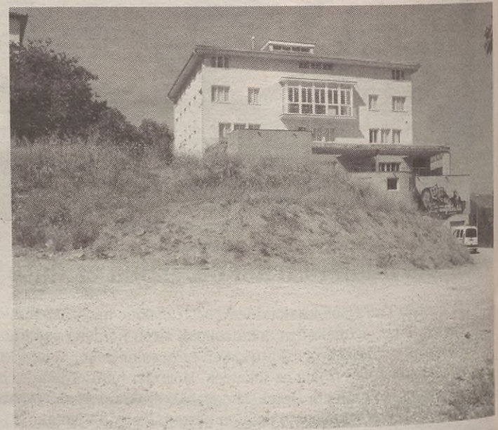
Plaza eta Espaloirearen arteko gunean egingo dute parkea.

Beraz, urtea amaitzerako jolasleku berria izango da herrian.