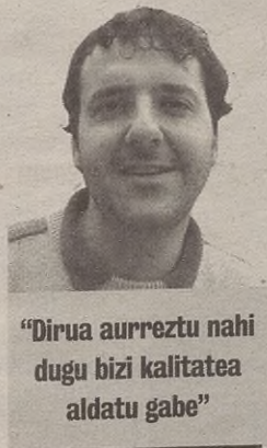
"Dirua aurreztu nahi dugu bizi kalitatea aldatu gabe"

Dirua aurreztu nahi badugu, beste planteamendu bat