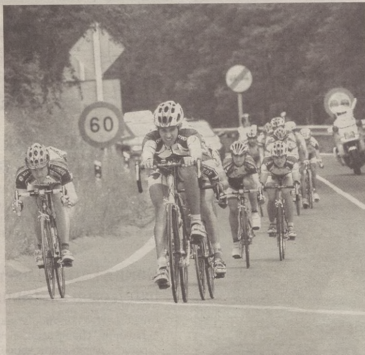
Txirrindulariek 124 kilometroko ibilbidea egingo dute domekan.

Goizeko hamarretan Elgetan abiatu eta besteak beste Areitio-