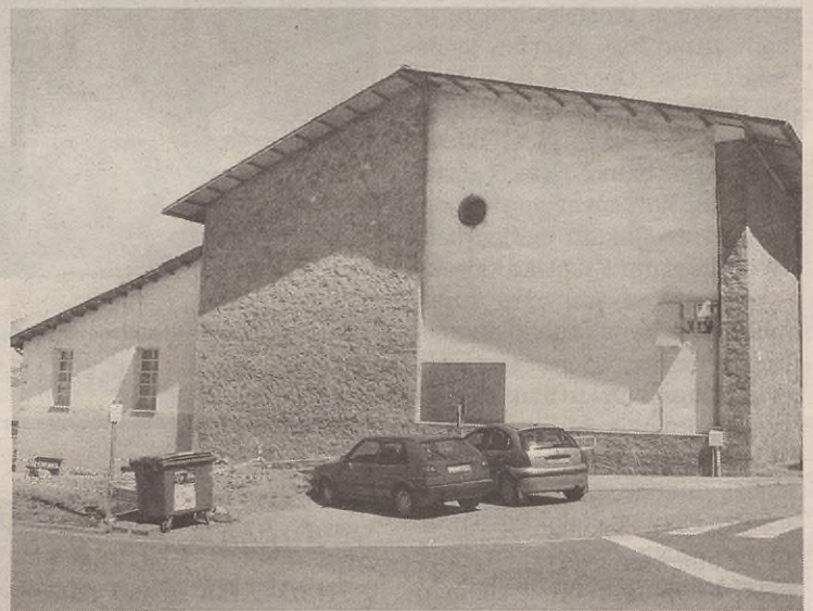
Besteak beste ate berria egingo dute pilotalekuko horma batean.

Kiroldegiko gainontzeko instalazioek oraingoz zabalik jarraituko dute. Berritze lanek aurrera egin ahala, ordea, itxi egin beharko dituzte eta kiroldegiaren erabiltzaileei jakinaraziko diete noiz arte egongo diren itxita.