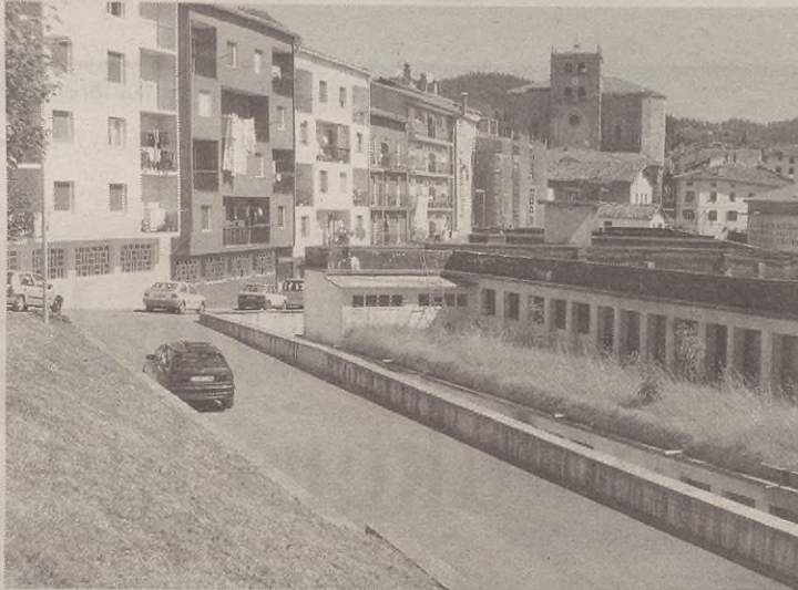
Autoak noizean behin baino ez ziren aparkatzen orain arte Berraondokuako zubian.

Oraindik ez dakite lan horiek noiz egingo dituzten; baina abuztuan edo irailean izango da. Autoa bertan lagata dutenei jakinaraziko zaie ken dezaten.