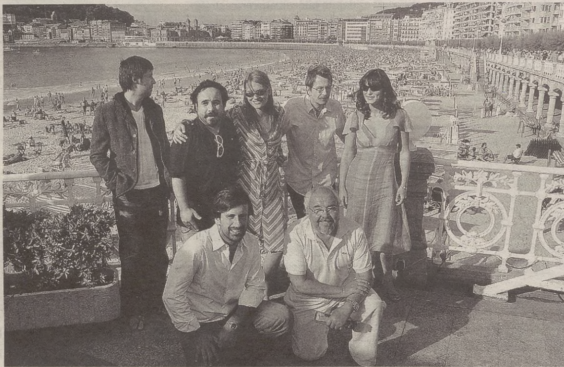
Donostian aurkeztu zuten filma. 50 lagun inguruk osatzen dute taldea, eta gehientsuenak izango dira Elgetan.