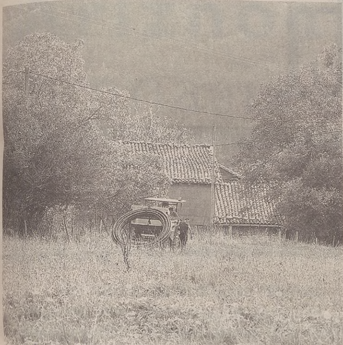
Abuztuaren 31n hasi ziren Uriartera ura eramateko azken faseko lanekin.