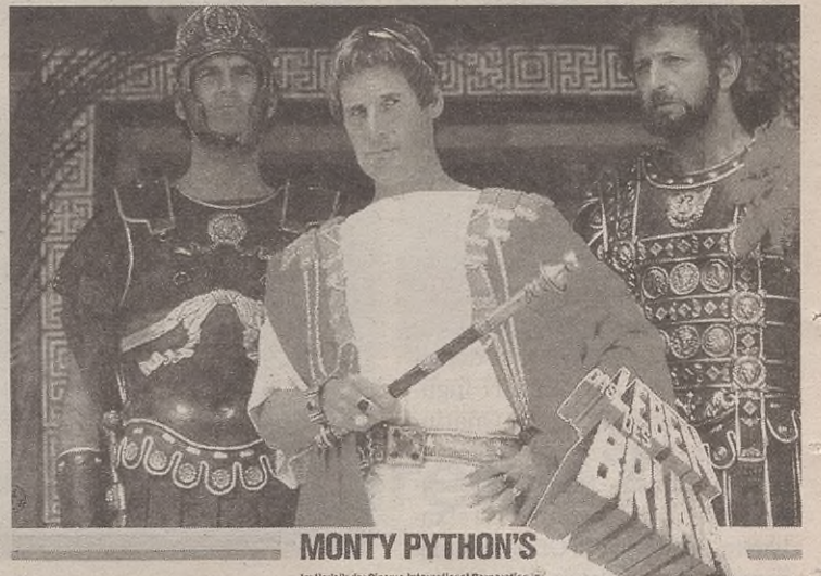
La vida de Brian filma irailaren 28an emango dute.

Iraileko etenaren ostean, urriko programazioa lantzen dihardute, eta aurrerapena egin dute Espaloitik: kantautoreen emanaldia, erakusketa eta jazz lehiaketa egongo dira, besteak beste.