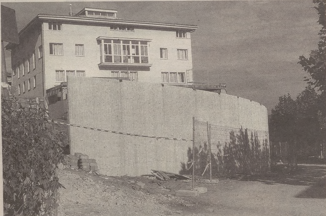
Aurrefabrikatutako horma bat ipini dute Maalako parkean; 4,35 metroko altuera du punturik garaiean.

Alkatearen esanetan, "hasierako asmoa zen parkean baranda ipintzea; baina horrek ekar ditzakeen arriskuak aintzat hartuta horma altxatzea pentsatu genuen; hala ere, baliteke gerora