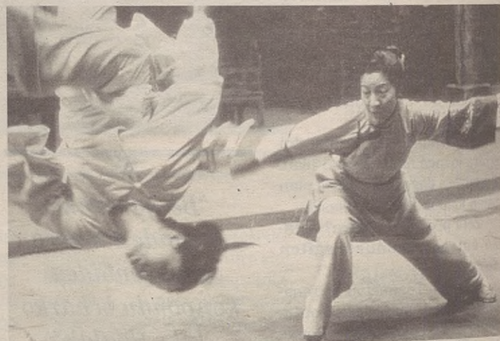
Tigre y dragon abenturazko filmak argazki eta irudi bikainak erakutsiko ditu.

Bestalde, domekero, 17:30ean, familia giroan ikusteko filmak emango dituzte. Abenduaren 4an 101 dalmatas ; 11n Socios y sabuesos ; eta 18an Olentzero . Bazkideek euro bat ordaindu behar dute sarrera, gainontzekoek bi euro.