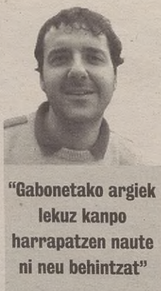
"Gabonetako argiek lekuz kanpo harrapatzen naute ni neu behintzat"

leku askotan argi hauek piztuta ikustea. Kontuan izanda Gabonak abenduaren 22an hasten direla (edo pixka bat lehenago), alperrekoa ikusten dut argien erabilera goiztiar hau. Lekuz kanpo harrapatzen naute ni neu behintzat. Bat-batean argiak ikusten ditut edonon, eta esaten diot neure buruari: hilabete eta erdi falta da eta Gabonetarako!