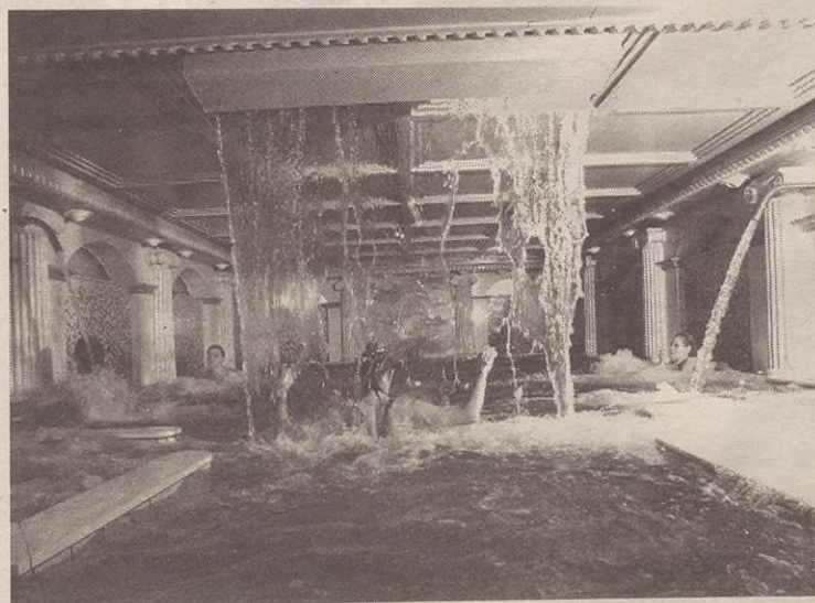
Programan parte hartzen dutenak 12 eguneko epea izango dute bainuetxeetan.

insersok bainuetxe programa zehaztu du abian. Interesa duten pentsiodunek udaletxera joan beharko dute, gizarte laguntzailearengana, astelehen edo bigarren goizetan, informazioa emateko eta izena ematera. Parte hartzen dutenek 12 eguneko epea izango dute.