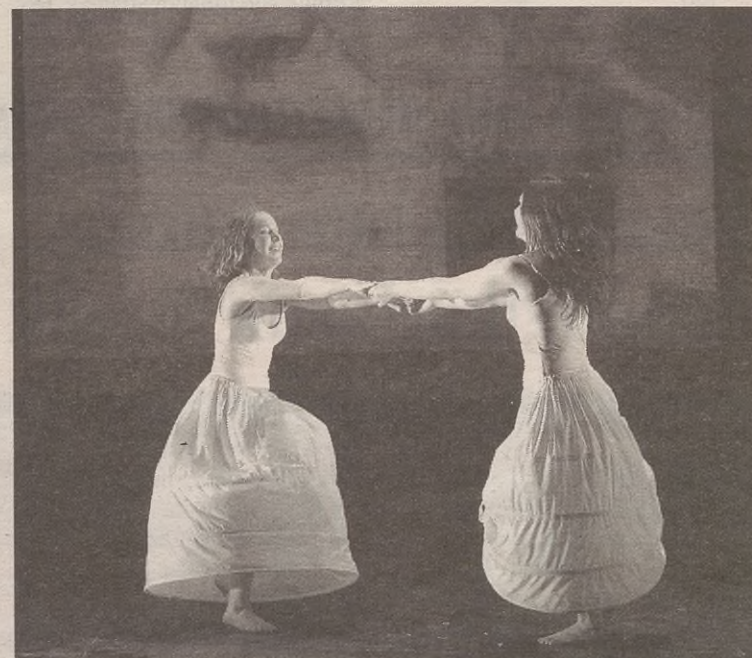
Jon Mayaren koreografia eramango dute taulara.

Hurrengo barikuan, hilaren 27an, zinema emanaldi musikatu izango da: Buster Keatonen The General filma Medin Peironen pianoaz lagunduta. Bestalde, Yllana taldeak Olimplaf lana ekarriko du otsailaren 3an.