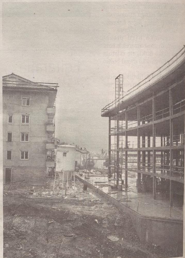
Torrealdeko urbanizazio lanetan 1.327.935 euro inbertituko dituzte.

Hirigintza lanetan egingo ditu Udalak 2006an inbertsiorik handienak