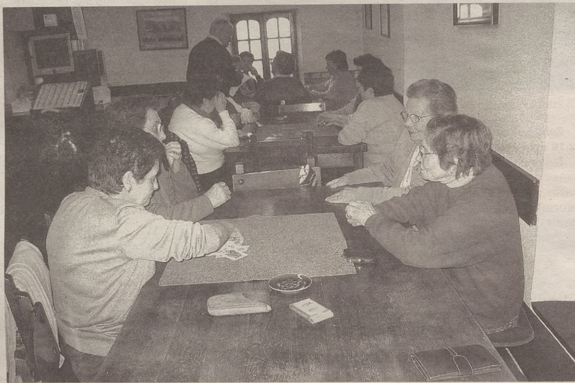
Ozkarbik 300 bazkide ditu; baina herriko 170 erretiratutako ere bertara joateko aukera daukate.