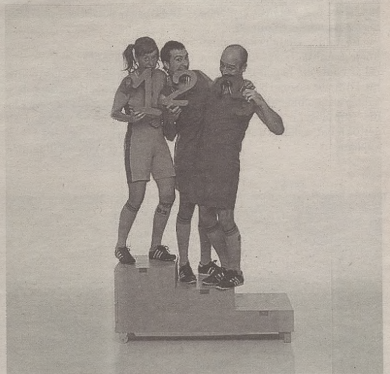
Yllana taldeak keinu bidezko Olimplaf lana eskainiko du hurrengo barikuan.

Emanaldirako sarrerak bost euro balio du eta bazkideendako hiru euro.