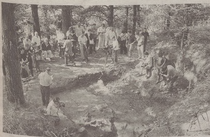
Espainiako gerran hildakoen gorputzak aurkitu zituzten Intxortako magalean.

Espainiako gerrak Euskadin izan zuen bilakaera ikertzeko lanak ere sustatuko ditu Jaurlaritzak. Lanok frankismo garaian desagertutako eta fusiutatutako lagunak identifikatzeko lanen osagarri izango dira.