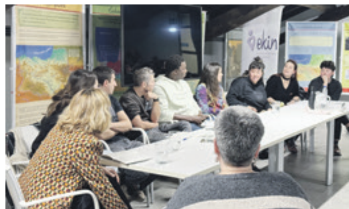
Bergara, Irun eta Arrasateko dinamiken mahai-ingurua, Kulturaten. J. ARRUABARRENA

Entzuleek itzulpen zerbitzua izan zuten, euskaratik gaztelarara eta arabierara.