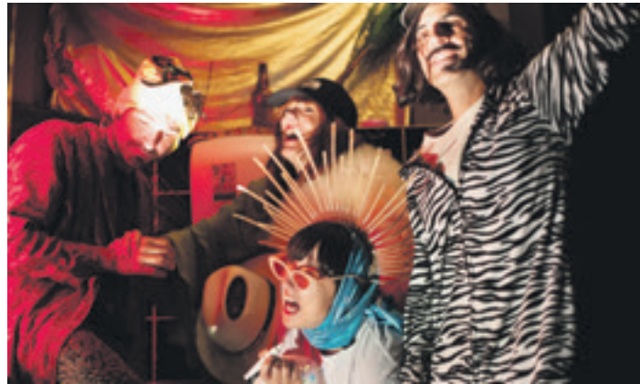
Itzulera antzezlako aktoreak.