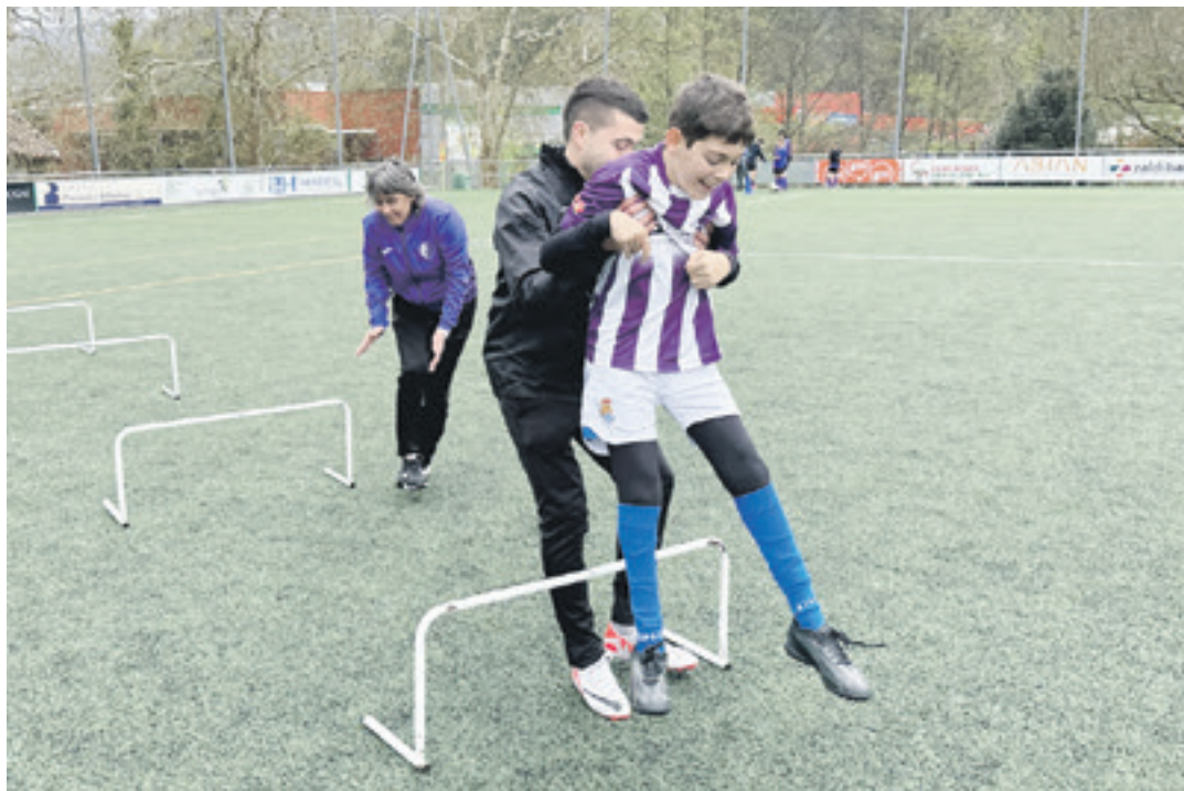
Gaztetxoak, joan den urtean Mojategin egindako futbol inklusiboko topaketan. GOIENA