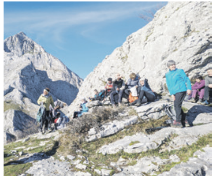
Urkiolan, iazko urtarrilaren 20an; atzealdean, Anboto.

ko eran nabaritu egiten dela: "Egun, esaterako, gazte gutxi ikusten dira motxila hartu eta mendian ibiltzen, antxintxika aritzen direnak gehiago baitira". Horrez gain, uste dute "bakartia" izan ohi dela praktika hori, kolektibotasunik gabea. "Bada beste puntu bat ere: jendea mendira joaten denean ez da gai mendia kontenplatzeko, gelditzeko tarte bat hartu eta ingurunea identifikatzeko, hala nola zuhaitzak, txoriak eta mendiak; ariketa fisikotzat hartzen dute askok, joan-etorria egin eta listo". Bada, egite hori