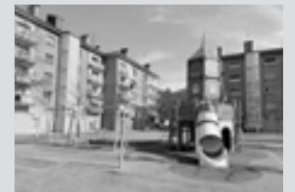
Gune estalia Gipuzkoa plazan hainbat erabilera izango dituen gune estali bat kokatuko da.

asfaltatze-lanak egitea, Gipuzkoa plazan gune estali bat egokitzea, udaletxean igogailua jartzea eta Ederlaneko beroa kiroldegian aprobetxatzeko proiektua: "Iturrigorri pilotalekua berritzeko proiektua ere idatziko da; kuartelean konponketak egingo dira, eta haur parkeetan ere bai. Eta argiteria publikoan, baserri-bideetan eta saneamenduan ere hobekuntza nabarmenak egingo dira".