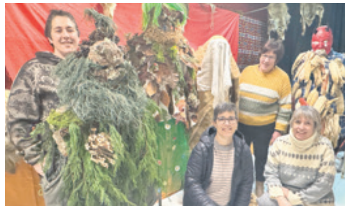
Koko-mozorroren prestaketan diharduen lantaldeko zenbait kide. L.Z.L.

Etortzen dira, eta, gehien-gehienetan, izaten da garatxoak kentzera, baina uste dut egokia litzatekeela urtero azterketa egitea. Txikitan antzemandako arazoekin gertatzen da lehenago hartzen direla neurriak eta etorkizuneko arazo larriagoak saihestu daitezkeela.