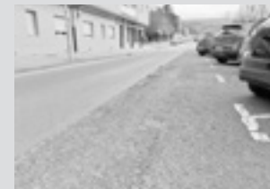
Asfaltatze-lanak Konpondu behar handia duten hainbat kale asfaltatu egingo dituzte.