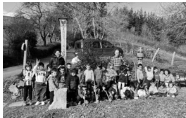
ARAMAIXO HERRI ESKOLA

Maiatzaren 7an egingo dute hurrengo bilera, eta Arriolabengoa herriarrei dei egin die parte hartzeko. Hurrengo bilera heldu bitarte ez dira geldirik egongo, lanean hasteko nahikoa material dute eta dagoeneko.