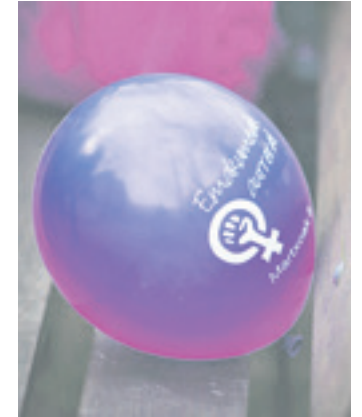
Martxoaren 8ko puxika. GOIENA

Bi gai horiek irten ziren bileran, eta bai ikusi zuten azaroaren 30eko greba feministan egin ziren dinamikek eta solasek ere