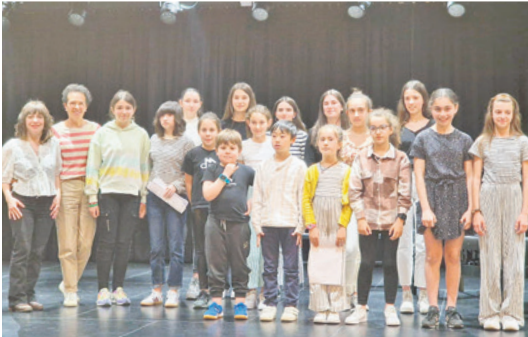
Arrasate Musikaleko piano-jotzaile batzuk. ARRASATE MUSIKAL