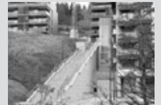
Iturrizar plazako igogailua Iturrizartik Txarapeara joango den igogailua erosi du, eta gero, ingurua txukundu.