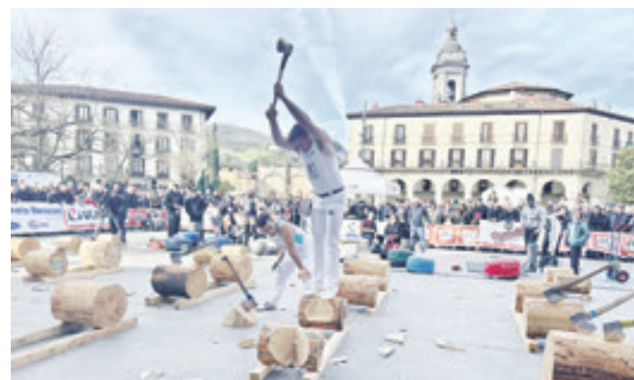
Joan den urteko finalerdian. GOIENA

Probaldiak zuzenean emango ditu Euskal Telebistak, 12:00etatik 14:30era. Aurten, gainera, eserlekuak jarriko dituzte plazan bertan, ikusleendako. Eguraldi txarra egiten badu, kiroldegiko frontoian izango da.