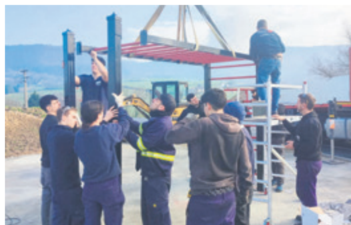
Kalistenia parkea muntatzen. ARETXABALETAKO LANBIDE HEZIKETA ESKOLA