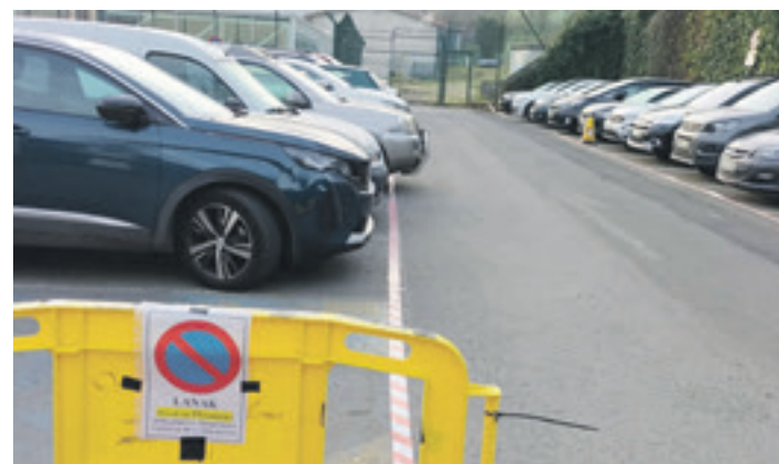
Osasun zentroaren goialdeko aparkalekua. OÑATI IRRATIA

Aparkalekuan argiteria jarriko dute, baita ibilgailu elektrikoendako gunea ere. Gainera, monitorizatuta egotea da asmoa; hau da, pantaila baten bitartez adieraztea aparkaleku horretan autoa uzteko tokia dagoen edo ez. San Juan kaleko biribilgunean jarriko den panelean islatuko da informazio hori; semaforo bat izango du pantailak.