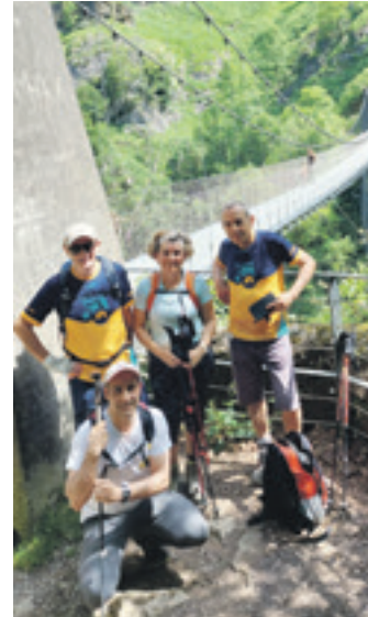
Holtzarten, iazko ekainaren 8an.

Mendiaz gozatzeko ohiturak garai batetik "asko" aldatu dira, diote ekimenaren sustatzaileek, eta hori parte-hartzaileen adinean eta parte hartze-