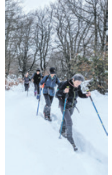
Aratz-Aizkorri, abenduaren 14an.