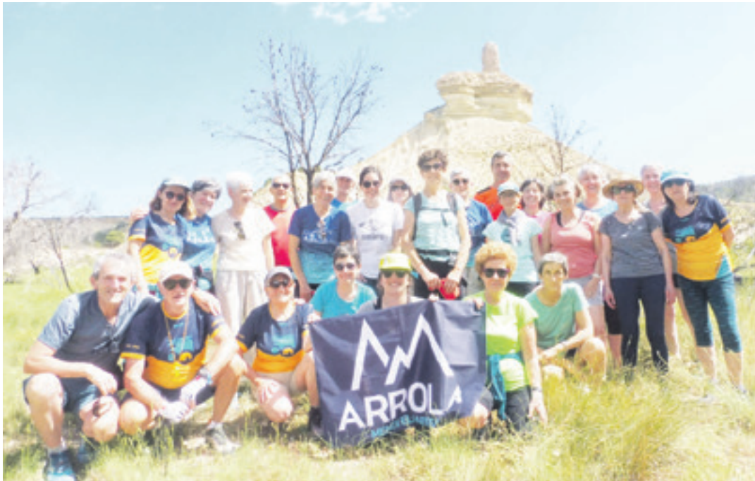
Bardeara eginiko irteera, iazko maiatzaren 11n.