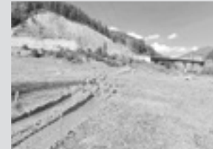
Santutxu inguruko lursaila Arrasatera bidean dagoen eremua eskuratuko du, institutu berria eraiki dezan Jaurlaritzak.