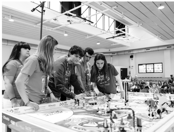
2024ko First Lego Leagueko finala. MU

Torneoa bi kategoria nagusitan banatzen da: Explore (6-9 urte) eta Challenge (10-16 urte). Challenge kategoriarik dagokionez, gazteek berrikuntza-proiektu bat garatu eta aurkeztu behar dute, eta Lego piezekin eraikitako robotak hainbat misiotan probatu behar dituzte. Aurten, esan bezala, parte-hartzaileek itsas az-