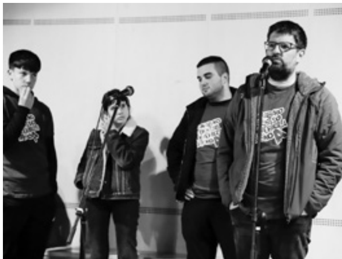
Izena Pentsau Bida 2 taldearen aurkezpena. GOIENA

Finalerdiei begira jarrita daude dagoeneko Aramaioko hiru taldeak. Bañera FT taldea izango