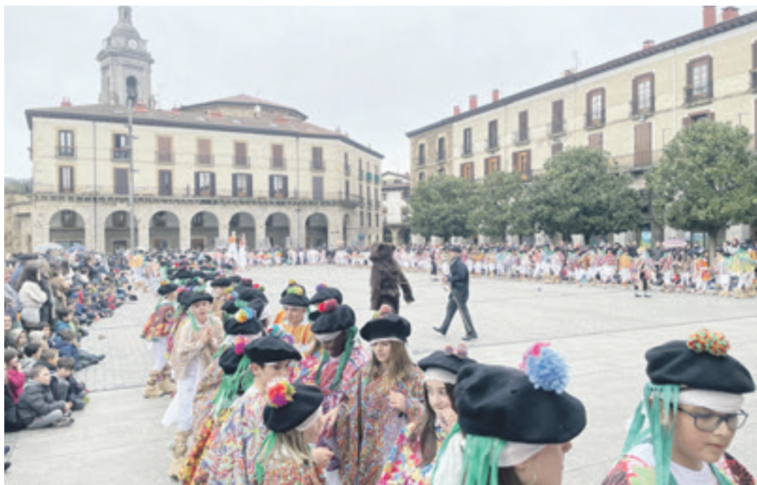
Joan den urteko Oñatiko Inauteri txikiko ospakizunaren amaiera, plazan.