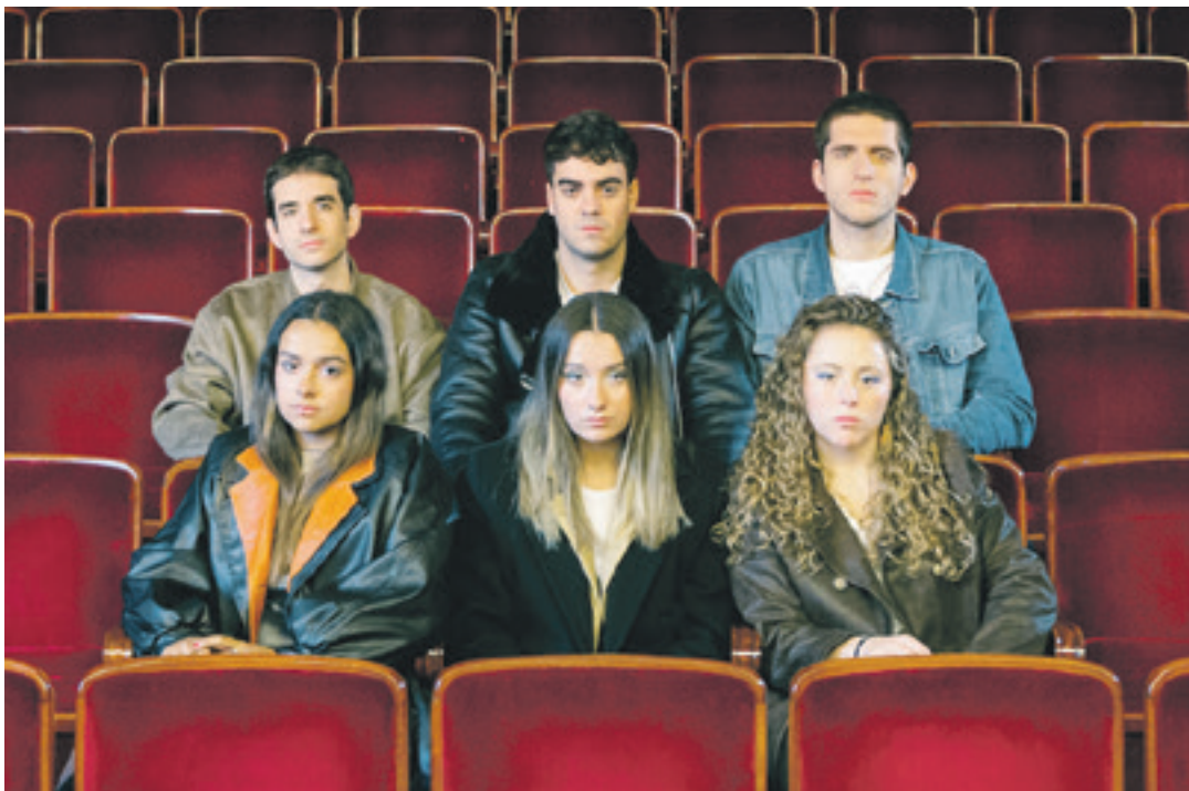
Sukena osatzen duten sei taldekideak. MAGU

Astean jarri dituzte azken hamar sarrerak Mizke gozoki-dendan salgai, eta denak saltzea espero dute antolatzaileek. Pozik daude herriak egindako harre-arekin: "Oso pozik gaude, eta hurrengo denboraldira begira haurren-dako eskaintza berri bat eskaintzeko prest gaude".