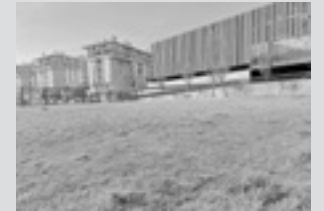
Kiroldegi aurreko gunea Aisialdirako eremua egokituko dute berdegune hartan, eta ur-txorroten gunea kokatu.