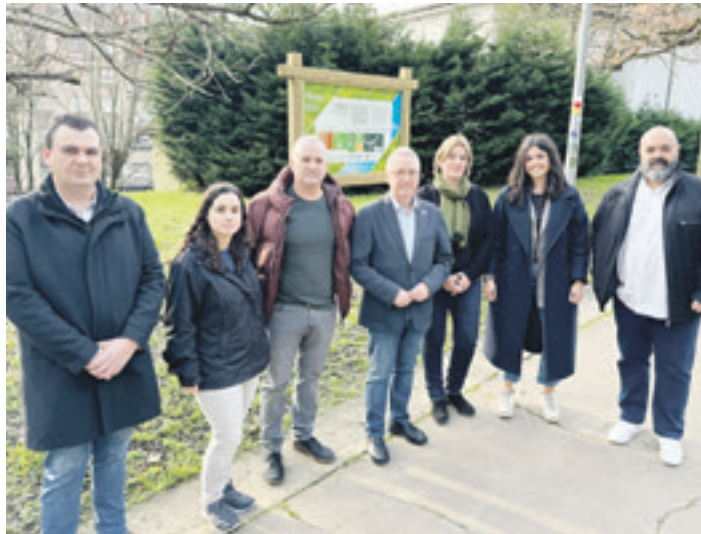
Udal ordezkariak, Aldundiko, Naturklimak eta enpresetako ordezkariak. E.A.B.

Bestetik, Miyawaki basoak ezarri dituzte: "Hainbat gunetan