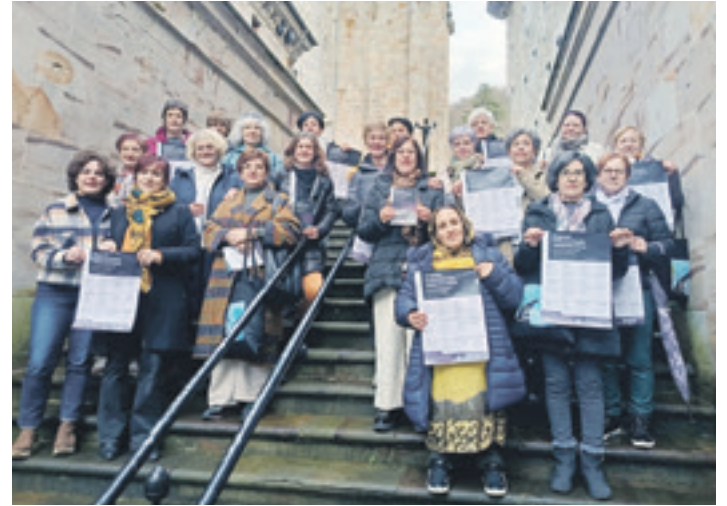
Jabekuntza Eskolaren jardunaldiak aurkezteko talde argazkia. BERGARAKO UDALA

proposamen guztiak hartzen dituztela kontuan. Proposamen horiek tailerretako balorazio-orrietan nahiz ikasturtearen amaieran egiten diren ebaluazio-saioetan jasotzen dituzte. Bestalde, azaldu du Jabekuntza Eskola Bergarako mugimendu sozialekin lotu nahi izan dutela; betiere, ikuspegi feministari eutsiz. "Edukien ore-