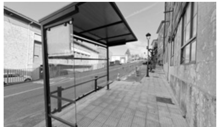
Artekalen dagoen geralekua. L.Z.L.

Markesina jartzearekin batera, taxibusaren geralekua gertatzeko lanak egin dituzte udal brigadako langileek: espaloiarekin lotutako irisgarritasun-lanak eta taxibusarendako geralekuko margotze-lanak, besteak beste. Aurrerantzean, udal biltegitik beherako aparkalekuak taxibusarendako gordeta egongo dira. Lanen aurrekontua 4.835 eurokoa da.