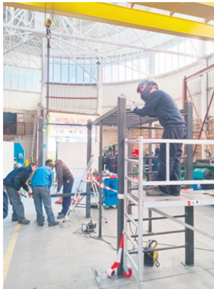
Ikasleak lanean. ARETXABALETAKO LANBIDE HEZIKETA ESKOLA

Aretxabaleta Lanbide Heziketa Eskolako aspaldi dihardu ekimen solidarioetan parte hartzen, eta horrela jarraitu nahi du aurrerantzean ere. Lan eredugarri horretan ikusten denez, gainera, proiektuak aukeratzeko orduan kontuan izaten ditu ziklo ezberdinak uztartzea eta elkarlana sustatzea, eta aurrera begirakoak ere bide beretik egin nahi ditu.