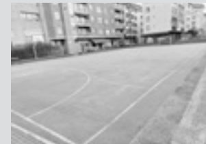
Andramari auzunea Hango kantzak urbanizatze lanak egingo dituzte; irailean hastea da asmoa.