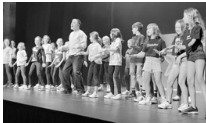
Begarako Seminarixoan grabatu zuten Kantari saioetako bat. GOIENA

Urtarrilean grabatu zituzten Bergarako Seminarixoan denboraldiko estreinako saioak, Bergarako, Antzuolako eta Elgetako artista gazteak gonbidatuta. Saio horiek Goiena telebistan eskaintzen hasita daude; bihar, zapatua, 16:00ean eta 20:30ean, eta domekan, 10:00etan, 14:30ean eta 18:30ean emango dute bigarren saioa.