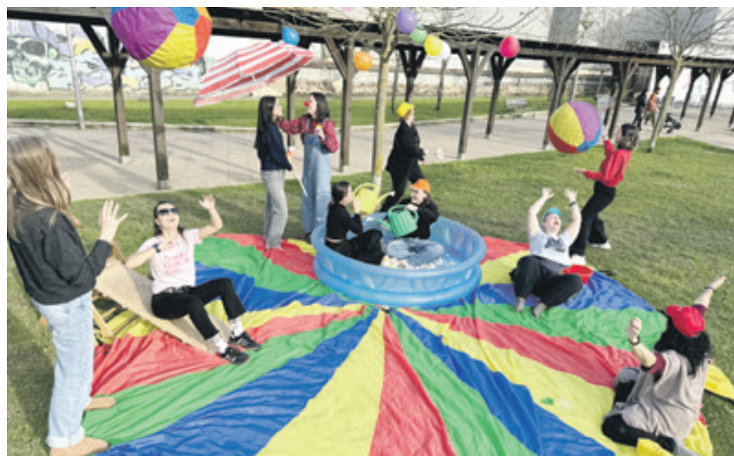
Txatxilipurdiko hezitzaileak, martitzenean, udaleku irekiak aurkezteko egin zuten ekitaldian. E.A.B.

Udaleku itxietarako zein irekietarako izen-ematea zabalik du Txatxilipurdi Elkarteak: lehenak ekainaren 29tik uztailaren 13ra egingo dituzte eta bigarrenak, ekainaren 30etik uztailaren 18ra; apirilaren 13a izango da bietan izena emateko azken eguna