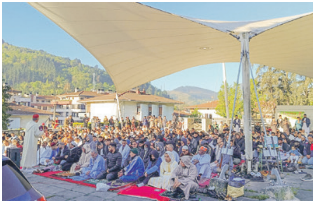
Komunitate islamiarra iazko apirilean ramadanaren bukaera ospatzen, Aldai parkean.