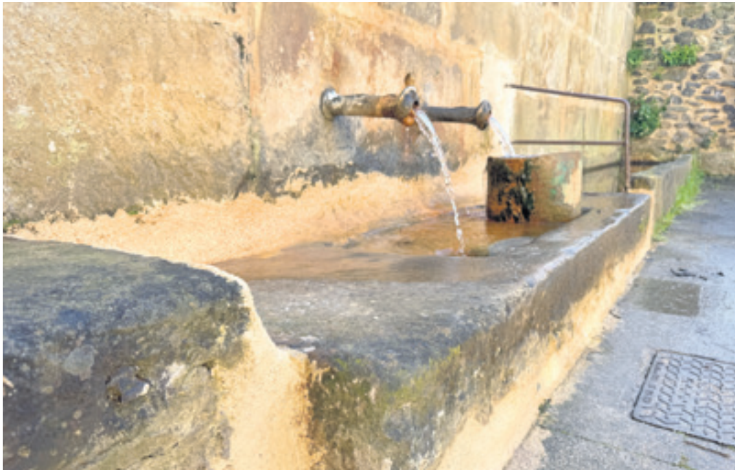
Dagoeneko katalogatuta eta babestuta duten Iturriosteko iturria. AMAIA TXINTXURRETA GURIDI