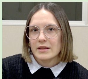
FALCONS DE VILAFRANCA

Oinarri batetik abiatzen dira eta poliki-poliki eta tamainaz txikiagoak diren kideekin solairuak gehitzen dira. Goiko puntara heltzen denari enxaneta esaten diogu. Kaskoa