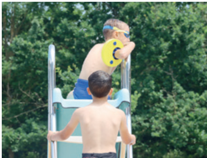
Bi ume Arrasateko igerilekuan jolasten.