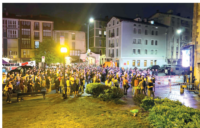
Udalak lehen aldiz jarri zuen pantaila Monterronen, errementari dantza jarraitzeko.