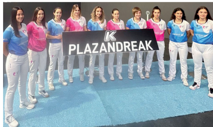
Aste barruan aurkeztu dute torneoa. EMAKUME MASTER CUP

Hala, bost astez ETB1ek astelehenero emango ditu euren partidua, txapelketa taldeka jokatu den lehiaketa izango da eta talde bakoitzeko pilotariek