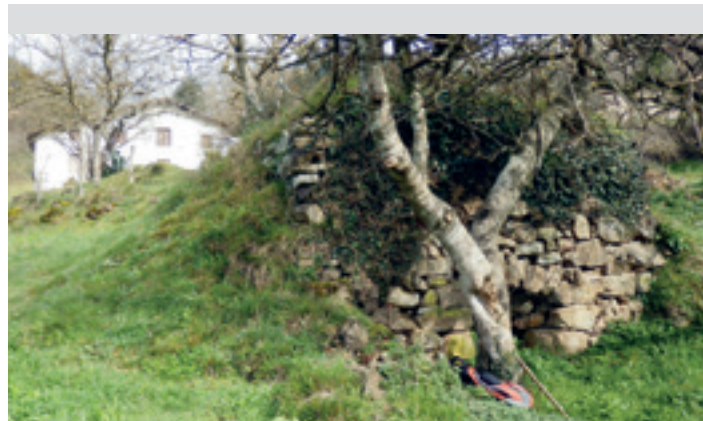
Lausagarretako karobia; atzean, izen bera duen baserria. JOSE MARI ITURBE