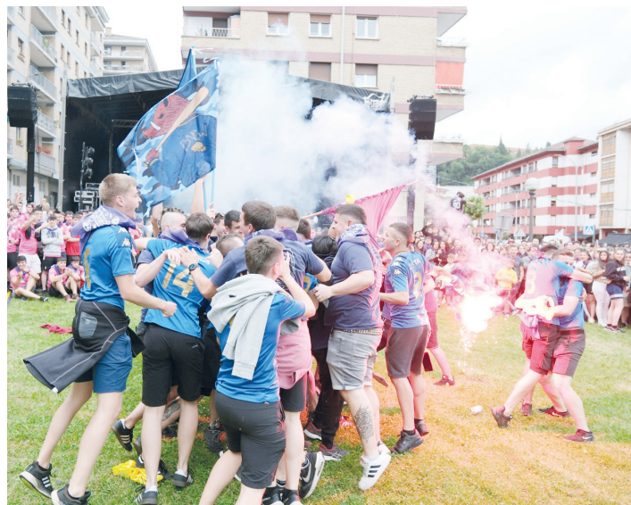
Arrakastatsuak izan ziren Gazte Olinpiadak; Boniato Crew taldeak irabazi zituen.

Indarkeria matxistei aurre egiteko protokoloa aktibatze