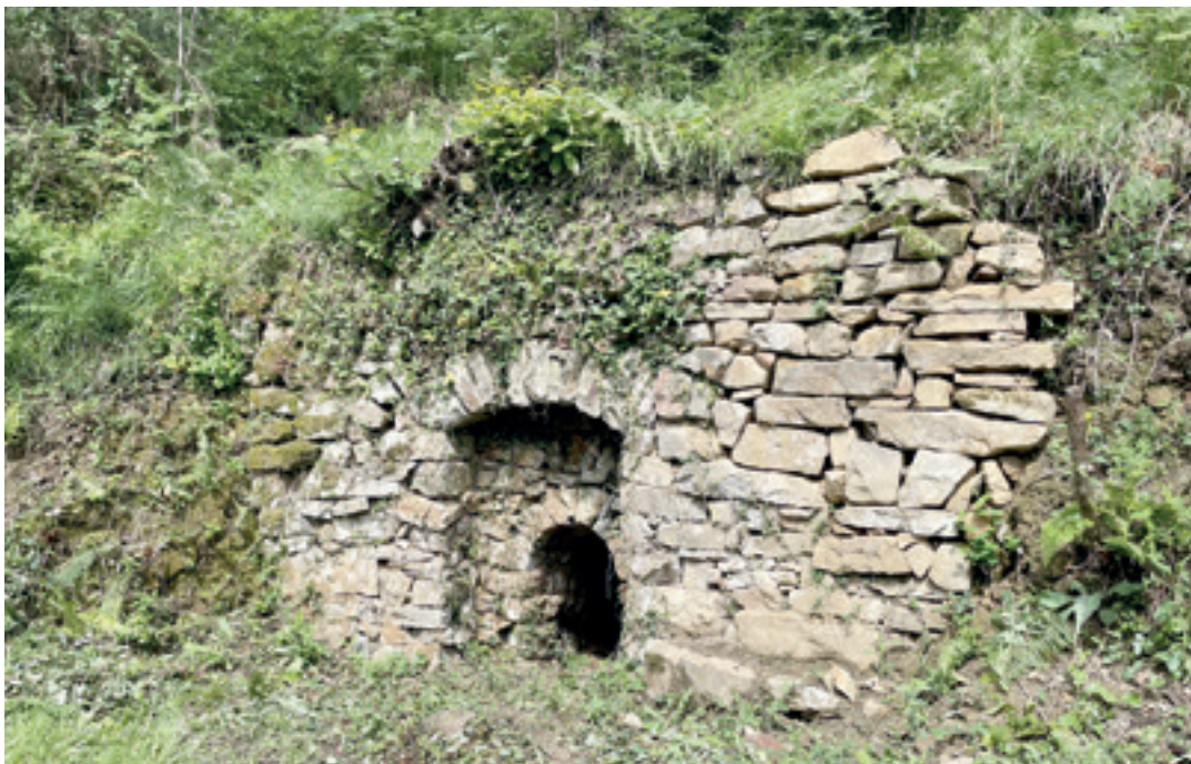
Otaingo karobia, konponduta eta ingurua txukunduta, Irimo Barrena auzoan. A.R.K.