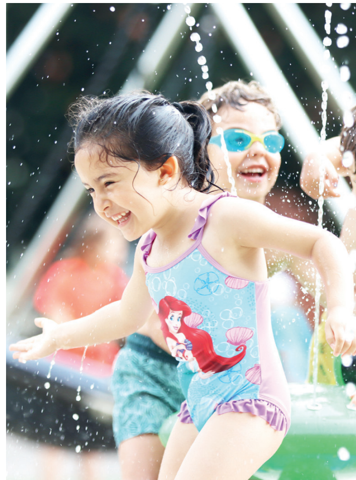
Haurrak Labegaraietako ur-txorrotetan jolasten. XABIER URZELAI

Julen Murua Mesonero DEBAGOIENA Uda iritsi bezain pronto ekin diote Debagoieneko herrietako udaleku irekiek jardunari. Herri guztietan egongo da eskaintza, eta, guztira, 2.051 neska-mutiko eta 253 begirale arituko dira. Herri batzuetan hasi dira dagoeneko; beste batzuetan, berriz, datozen egunetan ekingo diote.