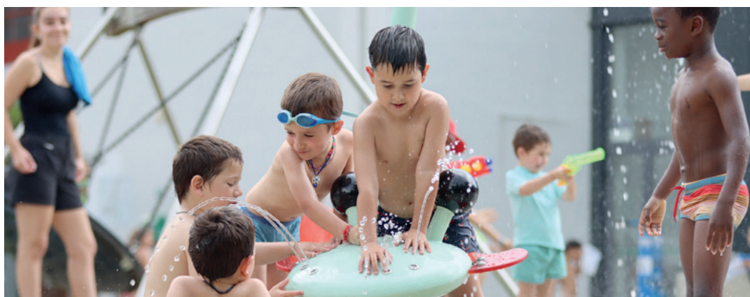
Bergarako udalekuetako haurrak Labegaraietako ur-txorrotetan. XABIER URZELAI

Asteon hasi dituzte udalekuak bailarako zenbait herritan; beste zenbaitetan, berriz, uztaillaren iritsierarekin batera hasiko dira. Debagoieneko herri guztietako haurrek izango dute udalekuez gozatzeko aukera, eta 2.000 haurretik gora arituko dira