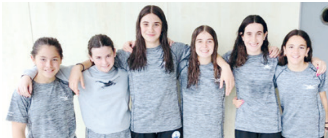
Euskal Herriko Txapelketan parte hartu zuten igerilariak. ASIER PEREZ