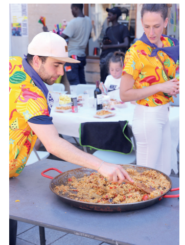
Zeuk iñ zeuk jan, Portaloian berriro.

bermatzeko", zezen-plazaren egoera txarra zelako.