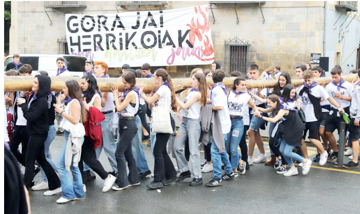
Gazteak, makala eramaten, Otalora Lizentziaduna kalean, Monterron parean.

Dragoi janak zein bertso saioak emandakoarekin pozik dago AED: "Azken horretan lekualdaketa izan da apustua, eta ondo erantzun dute herritarrek; halere, aukeran, gazte gutxi egon dira, eta hor dugu erronka".