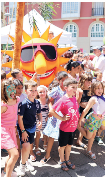
Hainbat haur Eguzkilarurekin.

ilunkeran. Herritar askok errementari dantza dantzatzeko iniatiba hartu, eta giro bikaina jarri zuten. Ondo bidean, datorren urtean berriz jarriko dugu pantaila".