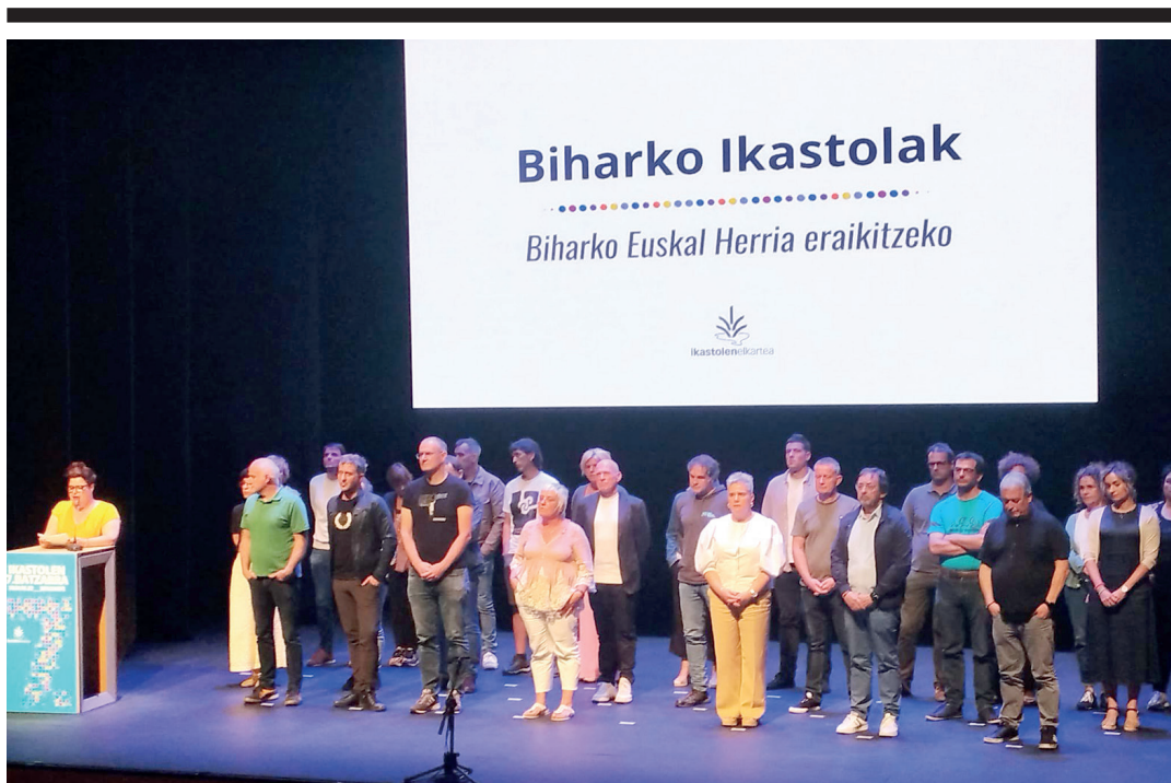
Ikastolen Elkarteak Iruñeko Baluarte jauregian egindako batzarra. IKASTOLEN ELKARTEA