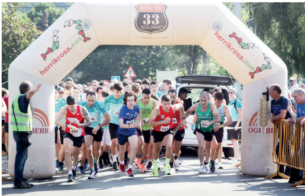
lazo kroseto irteera puntuan, parte-hartzaileak lasterketa egiten hasi berri. GOIENA