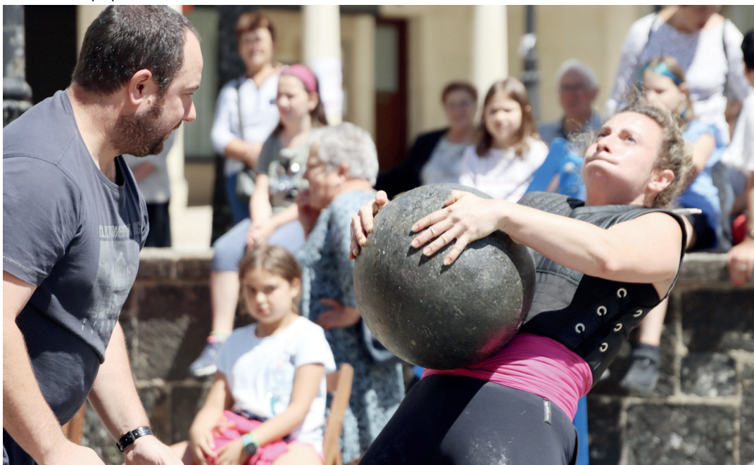
Herri kirolak, orain bi urteko Ferixa Nagusiko jaietan. GOIENA