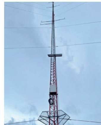
Haizea neurtzeko antena. A.U.

Statkraft enpresak haizea neurtzeko antena instalatu du San Adriandik Asentziorako bidean. Aramaio Udalak adierazi du alegazioa jarri zuela, baina Arabako Foru Aldundiak eman duela baimena antena jartzeko, "interes publiko" izendatuta: "Etxea teilatutik hasi dute. Proiektua aurkezterako neurketak egin behar izaten dituzte, eta orain egingo dituzte".