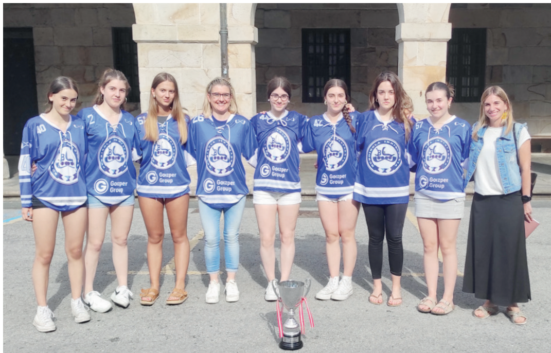
Burdinolako senior mailako neska, Zilarrezko Ligako norgehiagokan, aurtan.