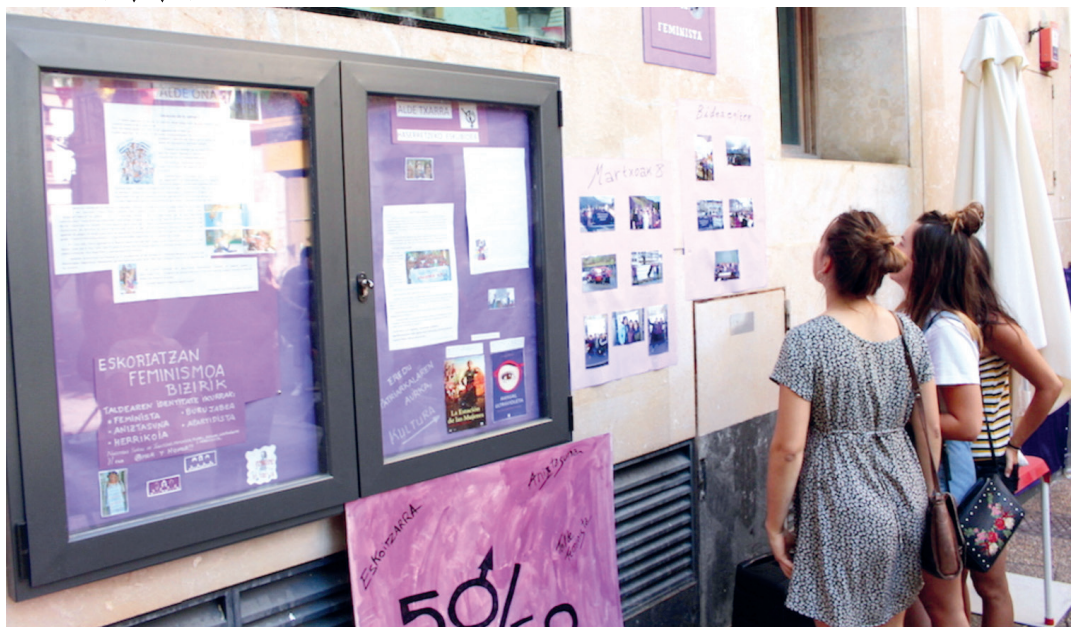
Eskoriatzako Txoko Feminista inauguratu zuten egunean, herritarrak informazio-gunean. IMANOL BELOKI