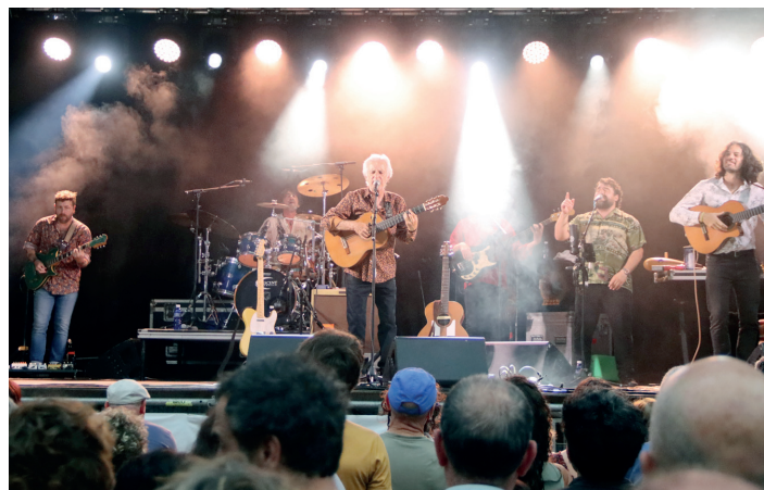
Kiko Venenoren doinuek agurtu zituzten aurtengo San Juan jaiak, eguaztenean.