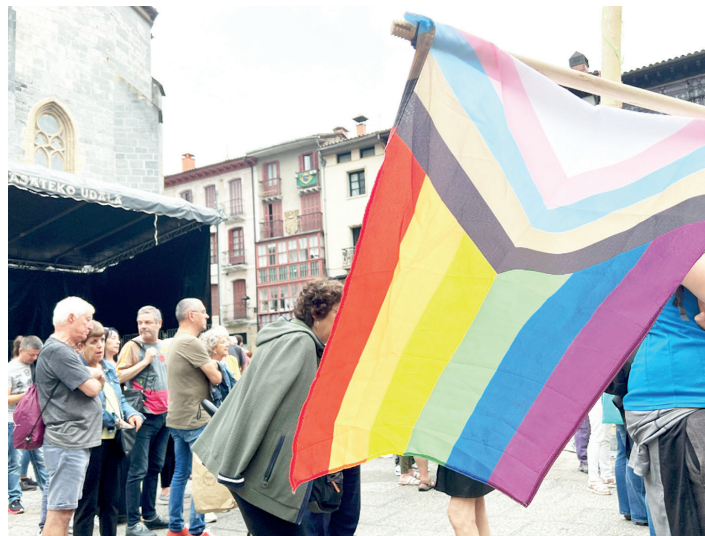
laz ekainaren 28an Herriko Plazan egin zuten elkarretaratzea. E.A.B.

Halaber, sexu eta genero-aniztasunaren ikusgarritasunak gizarte gisa aurrera egiteko