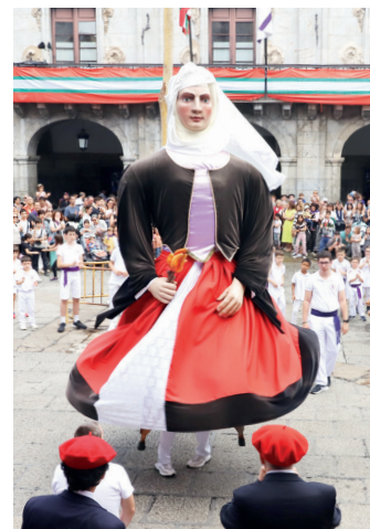
Erraldoi eta kilikien emanaldia.

Hainbat aldaketa, euriagatik Eguraldia, batez ere lehen egunetakoa, ez da aproposena izan jaietarako. Izan ere, euriaren ondorioz, Uarkapen egin behar izan dituzte kantu afaria eta dragoi jana, eta errekortarien erakustaldia bertan behera utzi behar izan zuten, "segurtasuna