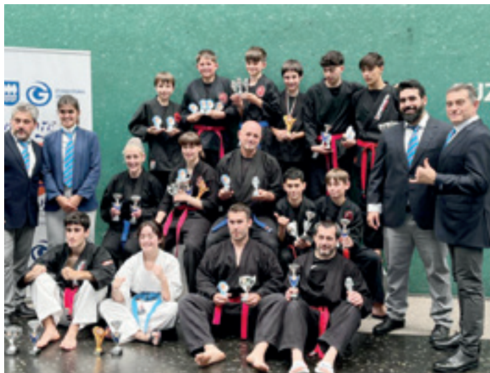
Atama Eskoriatza taldekoak, Euskadiko txapelketa amaitu ostean. RAFA CARRIET

"Atama Eskoriatza klubeko kirolari guztiek txapelketa ederra egin zuten Hondarribian, eta horren frogara da guztiek lortu zutela podiumera igozea; egindako lan ona adierazgarria da, eta belaunaldien arteko erreleboa bermatuta dagoela eta etorkizunerako proiektio handia dutela erakutsi zuten borrokalariek", adierazi du Rafa Carrietek, Atama Esko-