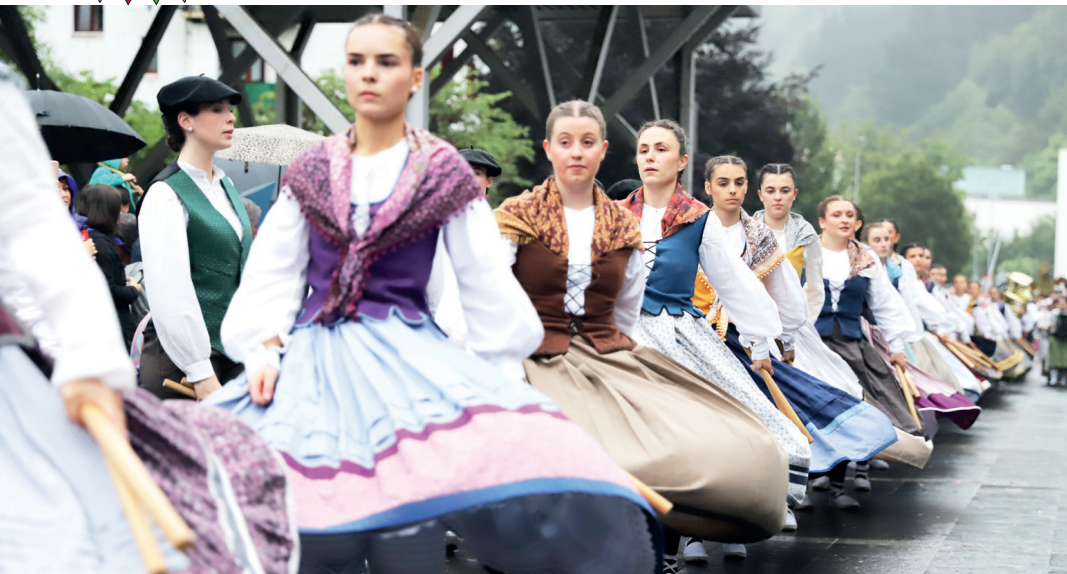
San Juan bezperan, dantzariak Biteri kalean, errementari dantza eginez, plazara bidean.