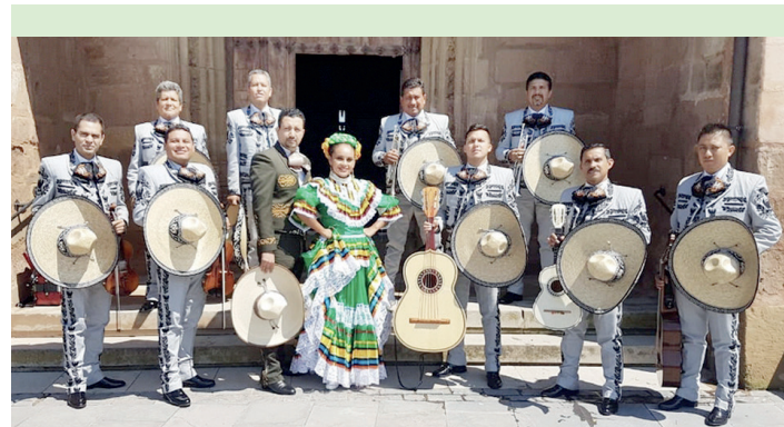
Bihar Elgetan izango den mariatxi taldea. MEXICO LINDO ¡SI SEÑOR!