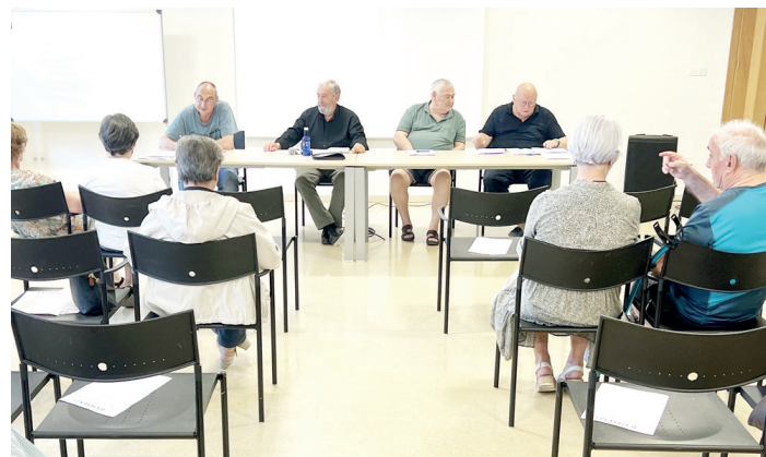
Basotxoko zuzendaritzako kideak azalpenak ematen bazkideei batzarrean. M.A.

Egoitza berriaren lanak uste baino gehiago luzatu dira, baina