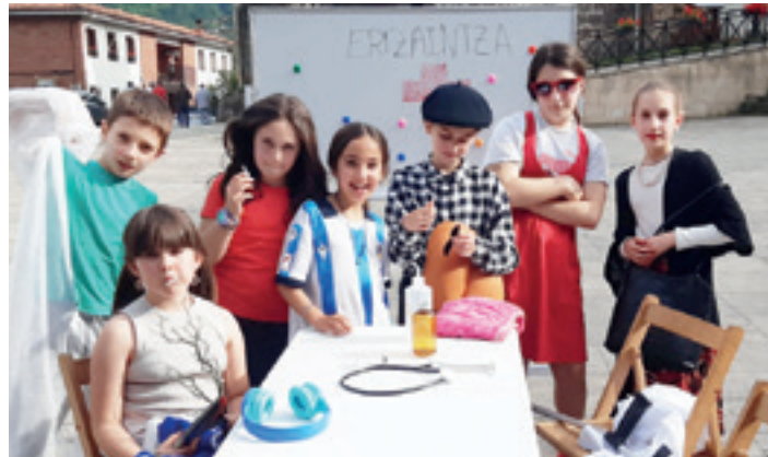
Gatzagako antzerki taldekoak ikasturte amaierako emanaldian. EIDER SANZ

lehiaketak egingo dira, baita borroka, semikenpo, submission eta kenpofightmma modalitateak ere", dio Carrietek. Gaineratu duenez, txapelketan 100 lehiakidetik gora batuko dira: "Asturias, Andaluzia, Aragoi, Katalunia, Galizia, Euskadi, Madril eta Nafarroako lehiakide-taldeak ditugu; guztira, 100 lehiakide baino gehiago". Sarrerak salgai daude eta eskuratu nahi dituenak kenpofulldefense@gmail.com helbidera idatzi edo whatsapp -a bidali dezake 627 442 142 telefono-zenbakira.