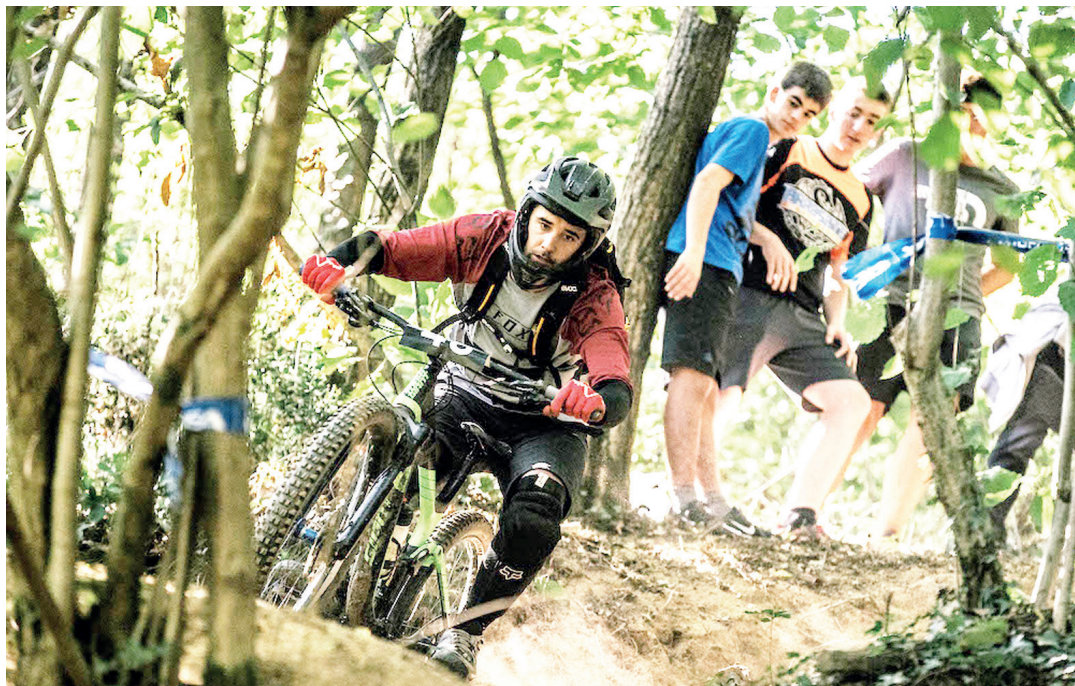
Pilotu bat, duela bi urteko lasterketan, zatieta batean. GOIENA