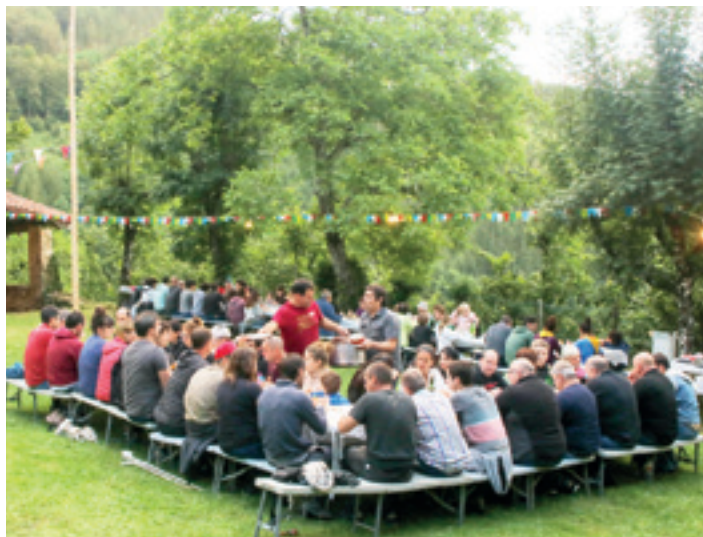
Sanmartzialetako afaria iaz. GOIENA

Hain justu, bospasei auzotar elkartuko dira auzo bakoitzetik elkarren aurka egiteko desafioan; gehienak gazteak izango dira, baina zaharragoek ere parte hartu nahi izanez gero ez dago arazorik, Legorbururen hitzetan. Elkarrekin bazkalduko dute, lehendabizi, San Martzialen, eta, ondoren, jokoan hasiko dira. "Hiruzpalau egingo ditugu, zehaztu gabe dauden arren: kaskara batzea, aulki jokoak, zaku lasterketa, zapia batzera...". Hala, auzoen -eta auzotarren-