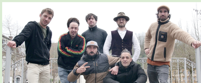
Xiberoots taldeko kideak Mauleko plazan. XIBEROOTS

2014an sortu zen Xiberoots, Zuberoan. Zazpi lagunek osatzen dute taldea eta Maule dute elkargune nagusi. Hamar urteko ibilbidean bi disko argitaratu dituzte: Maule muffin