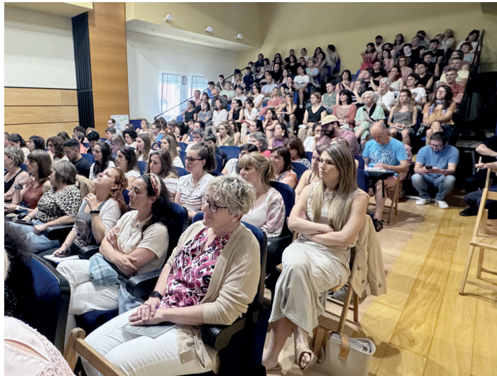
Topaketan elkartu ziren irakasleak kultur etxean hitzaldiak entzuten. IÑIGO BARRENA

Dueta bi urte ere Aramaion egin zuten topaketa, eta herrian