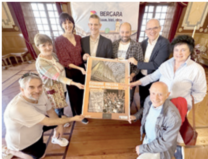
Organoaren aldeko Euskadiko Orkestraren kontzertua iragartzeko agerraldia.