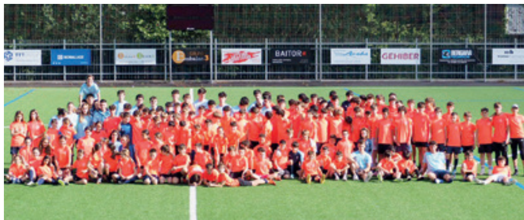
UDAKO FUTBOL CAMPUSA