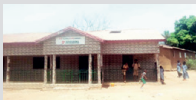
Ginea Konakryn dagoen Oñati eskola. M.E.

Oñatiko diruarekin finantzatuta dago, erabat, Dhagel herrian dagoen Oñati eskola. Duela urte eta erdi inguru hasi ziren han eskolak ematen bi irakasle, eta 4 eta 12 urte bitarteko ia 200 ume joaten dira hara ikastera; bertan eta inguruko herrietan bizi diren gaztetxoak. Hango ume askorendako Oñatiri esker izan da posible eskolara joateko aukera izatea.