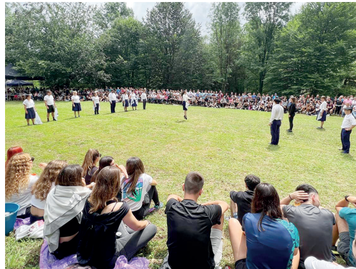
Iazko ospakizunaren une berezietako bat, eguerdiko dantza emanaldia. MIREN

Erromeria egunaren aurretik kuadrillek ohitura dute eremua zintekin gordetzeko, baina hori ere arautu behar izan du Udalak: "Erreserbazintak ezingo dira jarri ekainaren 28ko 15:00ak baino lehen. Ordura artekoak kendu egingo dira mantentze-lanek eskatzen duten heinean".