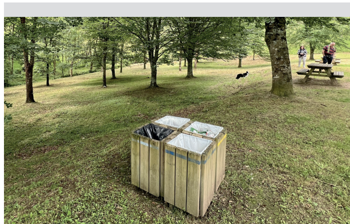
Zaborrontzia, zelai nagusian; zintak jarri daitezke gaur, 15:00etatik aurrera. EA.

Domekarako San Martzialerako herribus zerbitzua jarriko dute egunean zehar 09:30etik 14:00etara eta 16:00etatik 20:30era. Geltokiak Oxirondo plazan eta San Martzialen egongo dira. Zerbitzuaren prezioa 1,10 eurokoa izango da bidaiako; bonuarekin, aldiz, hamar bidaiak sei eurotan