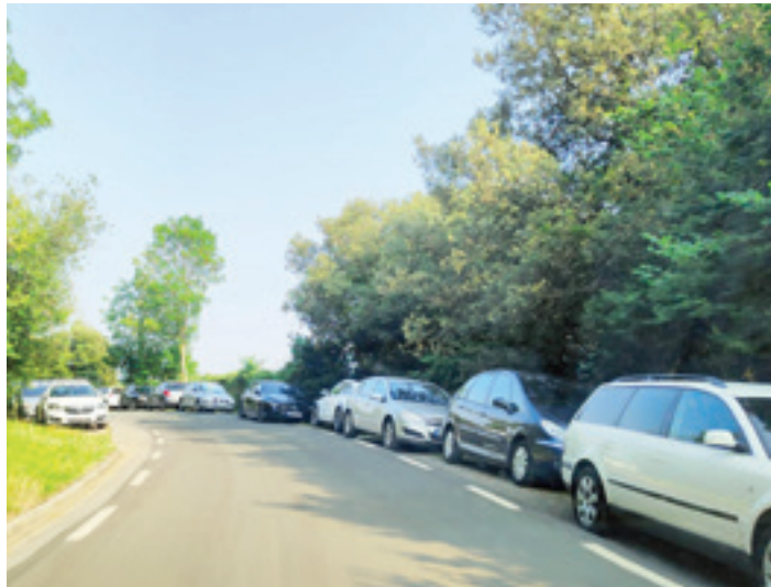
Autoak bide bazterrean aparkatuta Udala auzoan. GOIENA

Idatziari erantzunez, Udal Gobernuak dio bitartekaritza lanak egin behar izan dituela auzotarren artean, haien arteko desadostasunak direla eta. "Aste honetan bozkatu den proposamena auzoan adostutakoa izan