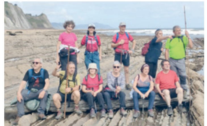
KANTSATZEKE MENDI TALDEA

bazkariak gozatu zuten. Ekitaldi polita bezain garrantzitsua dela sinistuta, Xalbadorpe elkarteko zuzendaritzak orain bi urte berreskuratu zuen 80 urtetik gorako bazkideen eguna, eta bi urtean behin egiten dute.