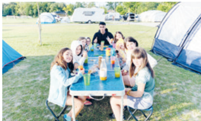
Angosto kanpian egindako egonaldian. UDANE OÑATE