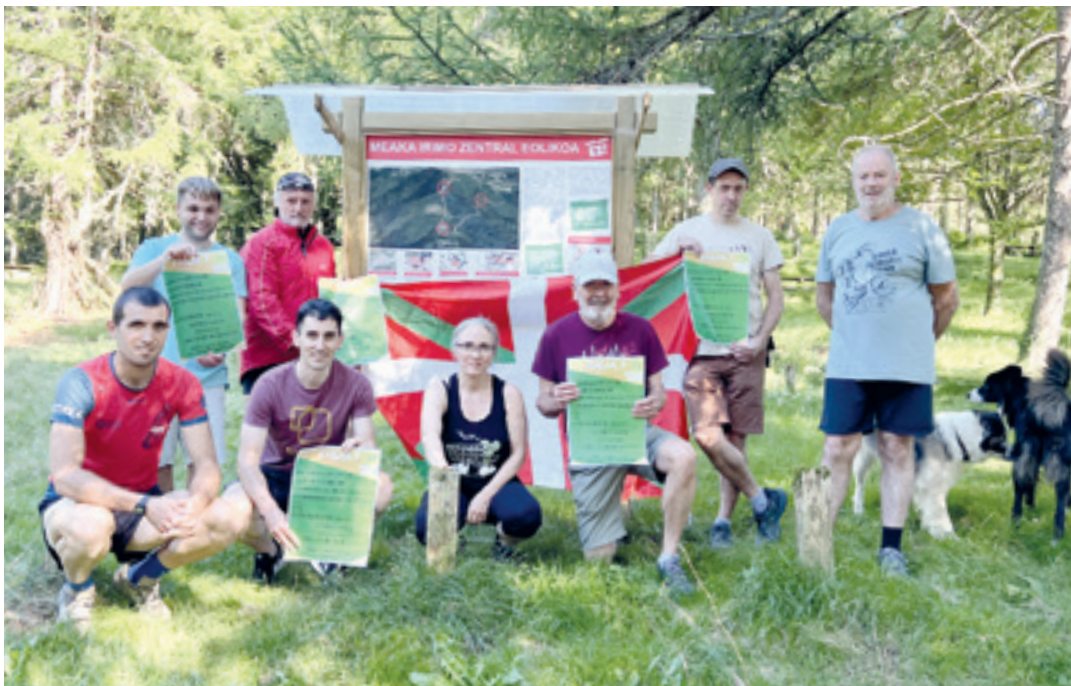
Meaka-Irimo herri plataformako kideetako batzuk, martitzenean, Trekutzen. A.R.K.