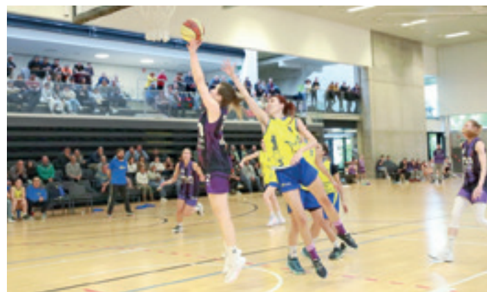
Mondragon Unibertsitateko neskek, ligako partiduetako batean. GOIENA

"Herriko neska-mutiko asko Burdinolako taldean dabilta, eta entrenamendu saio batzuk Iturripen egiten ditugu, leku egokia delako irristaketan egiteko. Baina zerbitzu batzuk falta zaizkigu eta horiek Udaleri eskatzeko taldeak bertakoa izan behar du. Hori izan da kluba osatzeko arrazoia, baita herrian dagoen eskaerari erantzuna emateko modua ere. Garbi daukaguna da Arrasatekoekin batera ateaik bailara osora daudela zabalik; gazte zein helduak etor daitezke lasai asko".