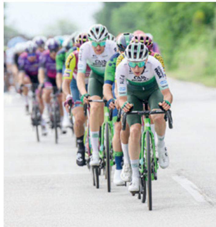
Arriolabengoa, Hellasko Tourrean tropeletik tiraka. CAJA RURAL

TXIRRINDULARITZA Bizikleta gainean milaka kilometro pilatu badituzte ere, ziklista profesional gisa ia hasiberriak diren bi debagoiendarrek orain artekoaz egin diote berba GOIENARI