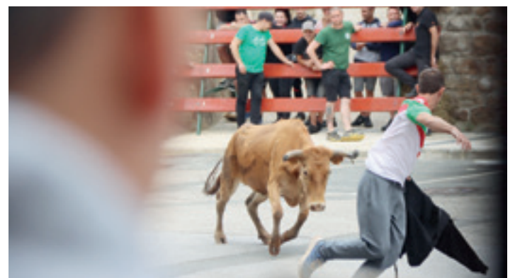
Bigantxak Ondarren, joan den domekan, hilaren 21ean. BEÑAT ARIZABALETA