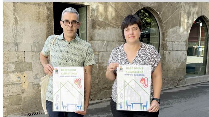
Azkargorta eta Marzan, atzean Biltoki babesgunea dutela. IMANOL BELOKI

Babesgune itxiak dira klimatizazioa daukaten lekuak edo