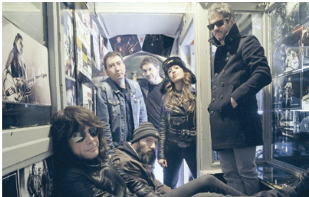
Urretxuko Northagirres taldea, promoziorako argazki batean.