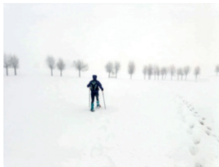
Urtarrilaren 7ko argazkia, Urbia ingurua lainotuta eta lizarrak bistan. J.M.A.E.

Urbia. Abenduaren 4an bukatu zuten landaketa, auzolanean, 568 zuhaixka, "eguraldi ezin hobegoarekin".