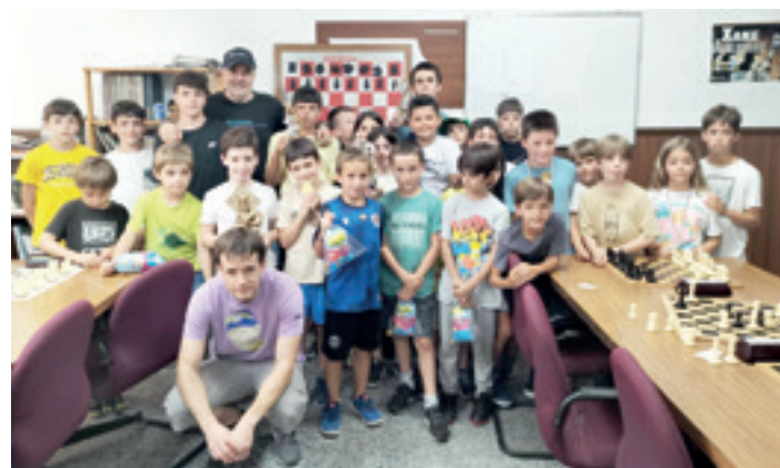
Txapelketa amaitu ostean, talde-argazkia atera zuten. BERGARAKO XAKE ELKARTEA