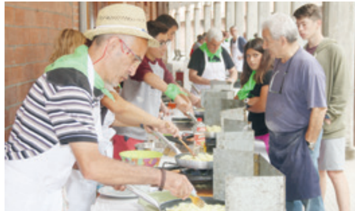
Boluko Santa Ana jaietako patata-tortilla lehiaketa, artxiboko argazki batean.

Taldeko musikariei eragin dieten taldeen artean daude, besteak beste, honako hauek: The Rolling Stones, Bob Dylan, Gram Parsons, Mott The Hoople, Neil Young, Tom Petty, Lou Reed, T. Rex eta Burning.