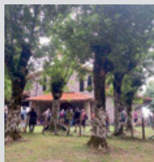
2022ko San Inazio eguna.