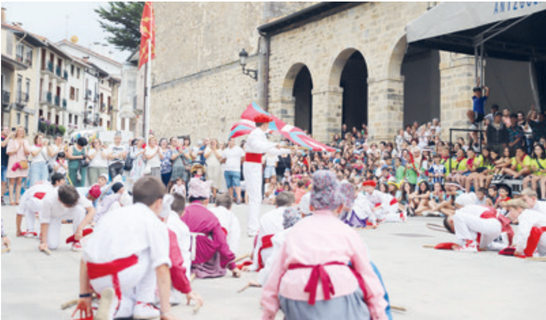
Kurrin dantzarekin eta udalbatzaren soka dantzarekin leheritu ohi da festa jaietako lehen egunean. OIHAN LOITI