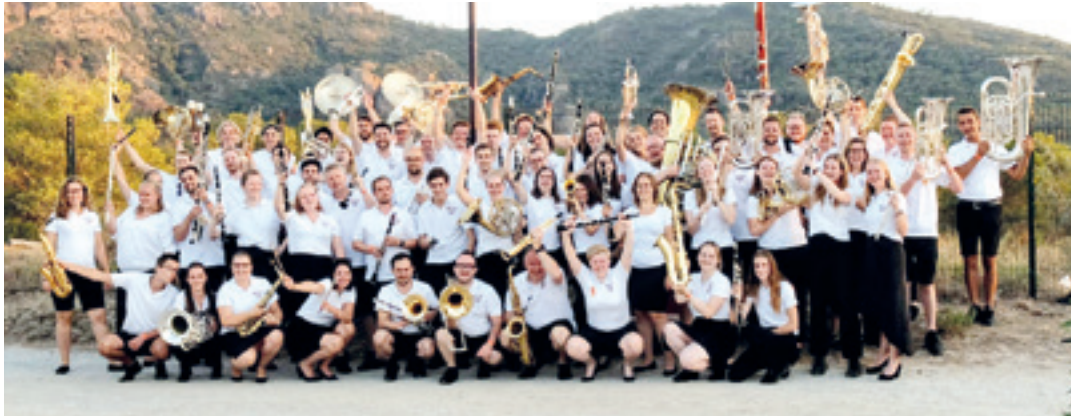
Ad Hoc orkestra osatzen duten kideak. AD HOC