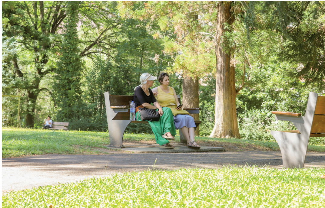
Zenbait lagun Usondo parkeko zuhaitzen gerizpean, martitzen arratsaldean. XABIER URTZELAI ATXA