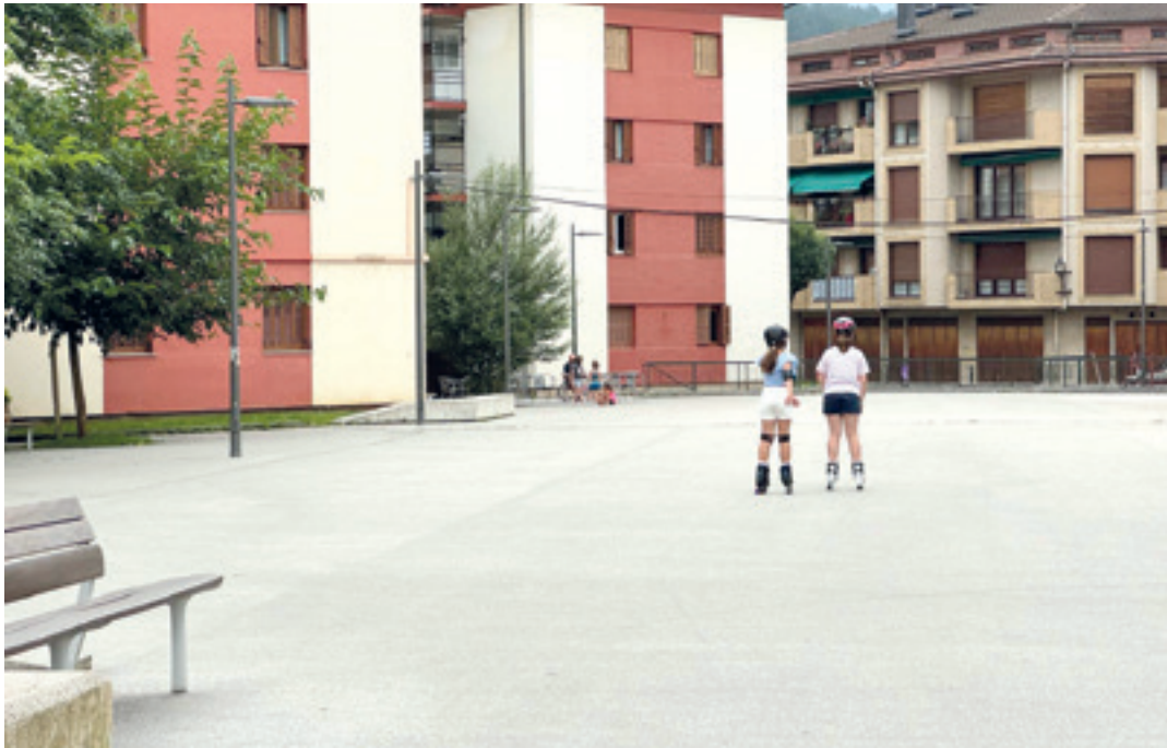
Parke gorria 8 eta 14 urte arteko gazteendako egokituko dute. OIHANA ELORZA