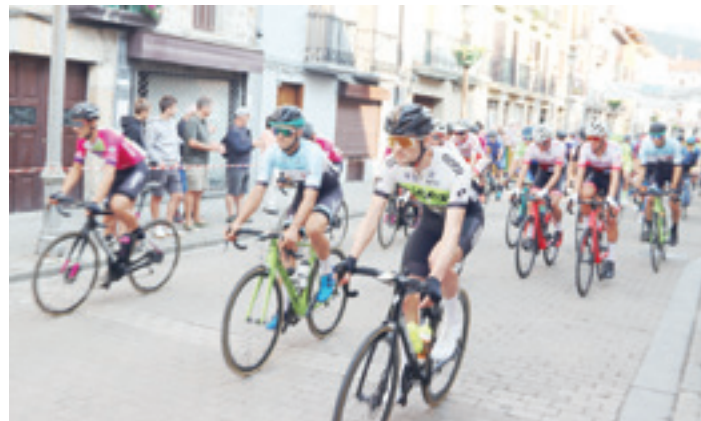
Aretxabaletako iazko lasterketako irteeraren unea.