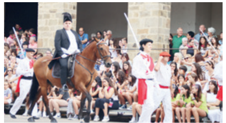
Antzuolako Alardea, joan den zapatuan, hilaren 20an.