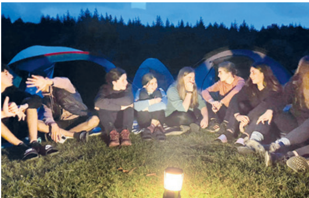
Albinara gaua pasatzera egindako irteeran gazteak kontu kontari, atzean kanpin-dendak prest dituztela. GAZTE UDA