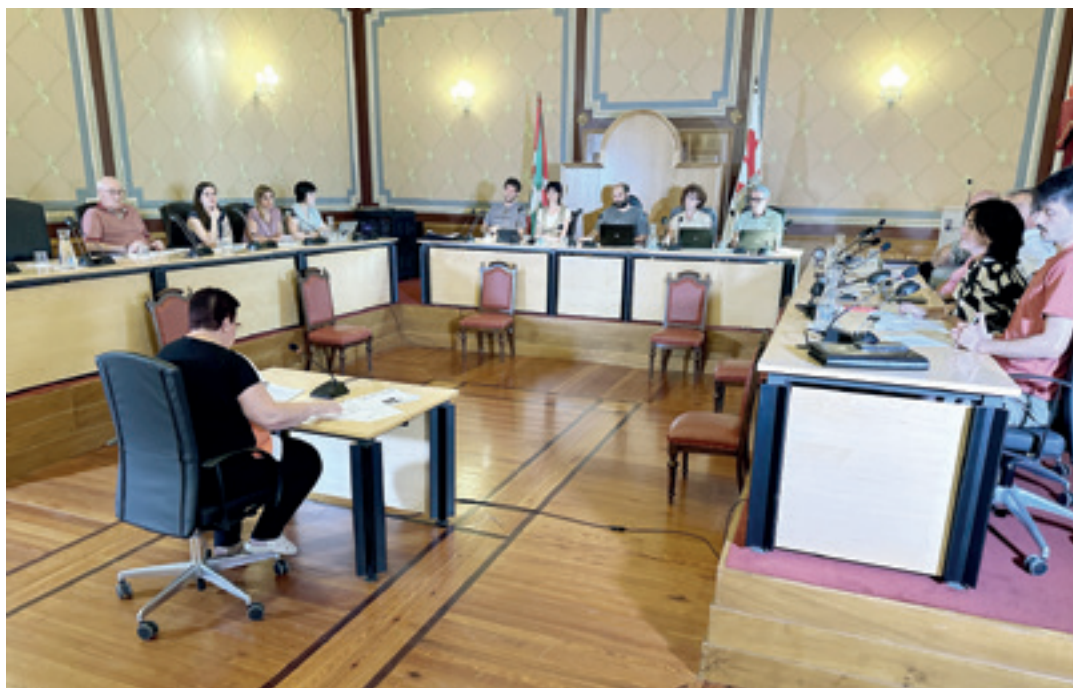
Asteleheneko osoko bilkuran aho batez onartu zen 2024tik 2027ra arteko Euskara Plana. JOKIN BEREZIARTUA