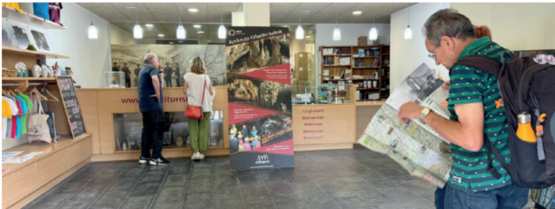
Turistak Oñatiko Turismo Bulegoan informazioa eskuratzen. OIHANA ELORTZA GOROSTIZA