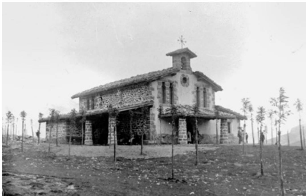
Urbiako ermita eta inguruan landatutako zuhaitzak 1930ean. INDALECIO OJANGUREN