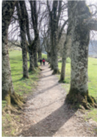
Zuhaitz ilara, martxoan. A.J.E.

Urbiako lizar haiek askoren iparrorraz izan dira; batez ere, lainoa barruraino sartuta egon den egunetan, bideak nondik jarraitzen duen jakiteko. Horixe izan zen landatzearen arrazoietako bat, bidea markatzea, eta oraindik ere lagungarriak dira horretan. Horixe dio, esaterako,