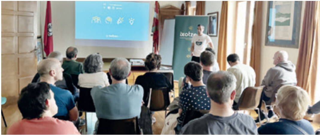
Ixtotzen kooperatibak ekainean egindako batzar orokorra. L.Z.L.