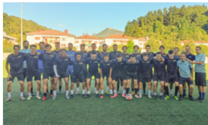
Hirugarren Mailan jardungo duen taldea, asteleheneko entrenamendu saioan. UDA

Bai, noski, eta eskertuta gurekin akordatu delako Udala. 30 urtean lan handia egin da, eta horri aitortza egiteko unea izango da. Era berean, garrantzitsua da euskara jai giroan ere presente egotea. Hortaz, herritar guztiak gonbidatuta zaudete txupinazora, gurekin batera, eta jaiak euskaraz bizitzera.