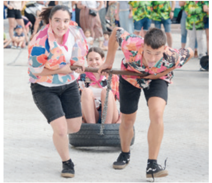
Kudrillen arteko jokoak, joan den egubakoitzean, hilaren 19an. OIHAN LOITI