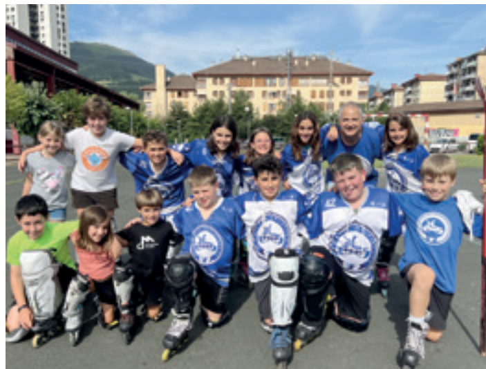
Ixotuko campusean esku hartuko duen gazte kuadrilla. J.MURUA

Hala, izena emateko interesa duenak ixotu.irristaketa@gmail.com helbidera idatzi dezake, edo 630 71 92 67 zenbakira deitu.