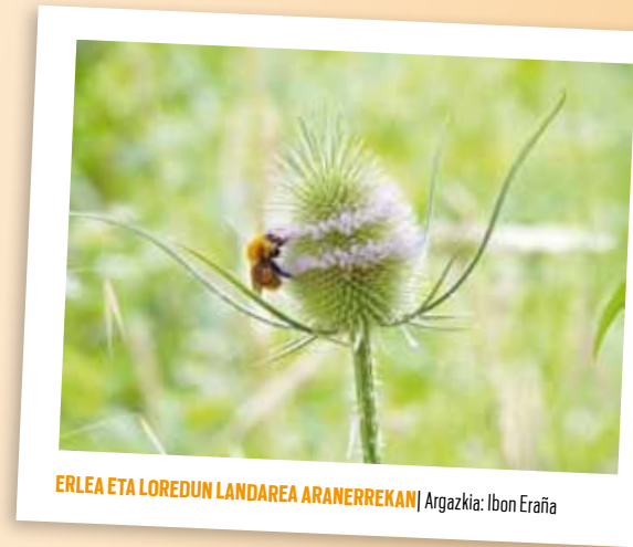
ERLEA ETA LOREDUN LANDAREA ARANERREKAN