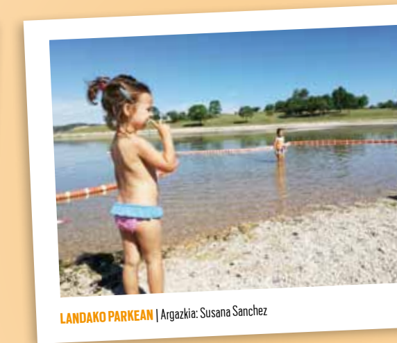
LANDAKO PARKEAN | Argazkia: Susana Sanchez