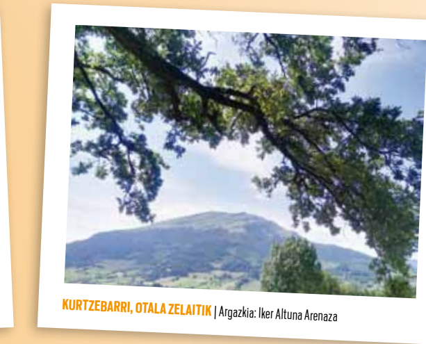
KURTZEBARRI, OTALA ZELAITIK | Argazkia: Iker Altuna Arenaza

Egin klik eta bidali poltsikoko telefonoarekin, argazki kamerarekin edo tabletarekin ateratako udako argazkiak!