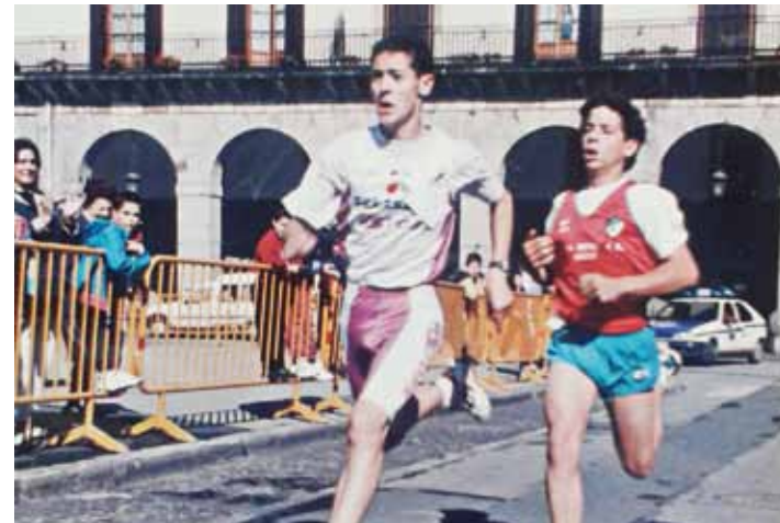
Arrasate-Oñati lasterketarekin batera, Zubilaga-Oñati ere egin izan da. PLACIDO RUIZ