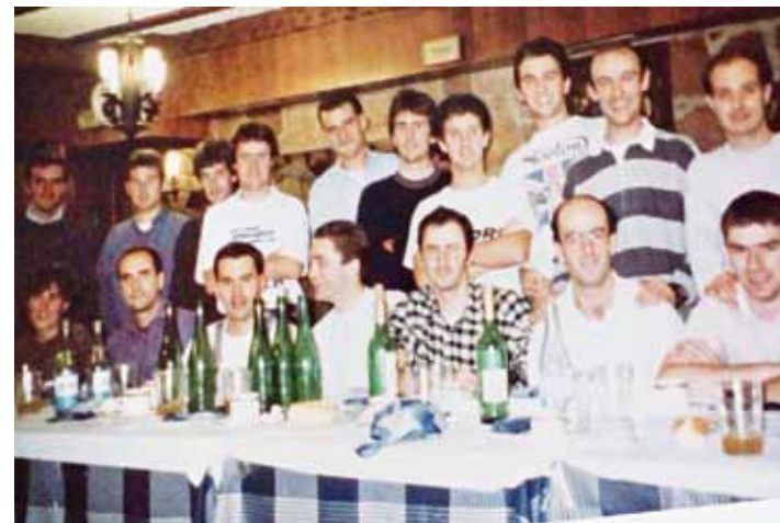
Oñatiko San Silvestre lasterketa sortu zuteneko batzuk. JESUS ZABALETA