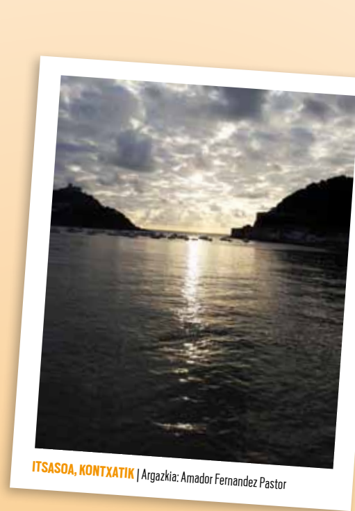
ITSASOA, KONTXATIK