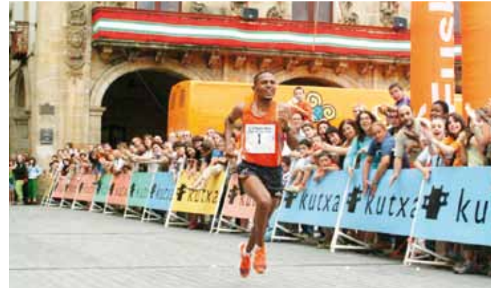
Zersenay Tadese helmuga zeharkatzen, 2006an. JESUS ARREGI

Antxintxiketan antolatu du lasterketa 2003tik gaur egunera arte –iaz, 2016an, ez zen egin–.