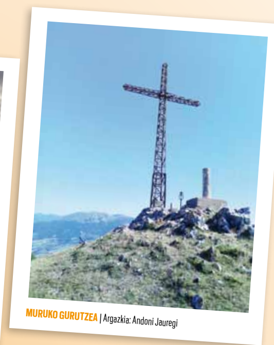
MURUKO GURUTZEA