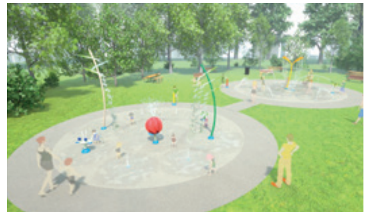
Kiroldegiaren atarian jarriko dute ur jolasen parkea; irudian, infografia bat. IMARA

lehena izango da; izan ere, Agorrosingo kanpoko igerilekuan ireki zen herriko lehena, aurreko agintaldian. Ekipamendu berriak Labegaraietako kiroldegiaren erreka aldeko belardi eta hormigoizko eremua hartuko du. Ur-txorrotekin bustitako eremuak, berriz, 160 metro koadro izango ditu; jolas irisgarriekin eta espezifikoeekin diseinatu da, hainbat adin-tarteri begira; proiektuan jasotzen denez, ur-jolasen parke berriak 25 jolas-eremu izango ditu, guztira.