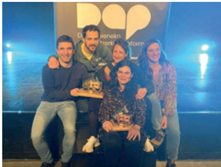
Tolosako Katuska taldeko kideak, Afizioz lehiaketan jasotako bi sariekin. DAP

Antzerki-talde amateurrek aukera gutxi izaten dituzte obrak