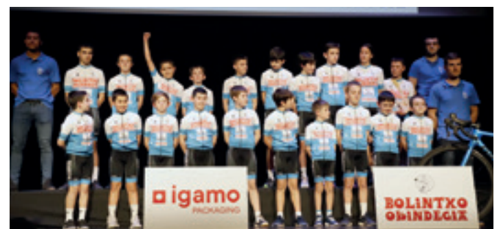
Eskolarren taldea: benjaminak, alebinak eta infantilak.