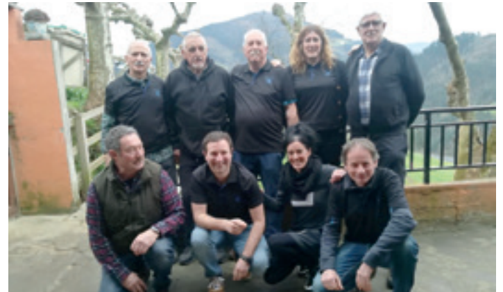
UDAKO taldea Eibarko Asola Berriko elkarteko bolatokian. HIRUTXIRLO

Euskal Herri osoko hogeita bat taldek parte hartuko dute Fun Dantz jaialdian, eta han izango dira Bergarako Camden Dance Studioko hiru talde: 15 urtetik beherakoetan, juniorretan bi talde; absolutuan, bat. Kategoria juniorrean dantzatzen lehenak Camden Joyskoak izango dira, jaialdian dantza egingo duen hirugarren taldea. Ondoren etorriko da Camden Vibes taldea, bederatzigarrena. Maila absolutuan arituko den Camden Rules oholtza gainera igoko den hamalagarren taldea izango da. Azken talde hori, hain zuzen ere, Barakaldon ospatuko den Break On Stage jaialdirako txartela eskuratzen saiatuko da.