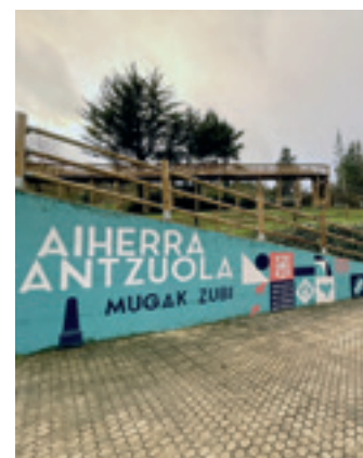
Murala, Antzuolan. A.R.K.

Dena den, aurreratu dute martxoaren 25ean ibilbidearen etapa bat egingo dutela: Itsasu (Lapurdi) eta Aiherra artekoaren zati bat. Izena emateko azken eguna hilaren 23a izango da. Horrez gain, apirilaren 2an, Legazpi eta Antzuola arteko egingo dute, eta, bazkaria. Salgai