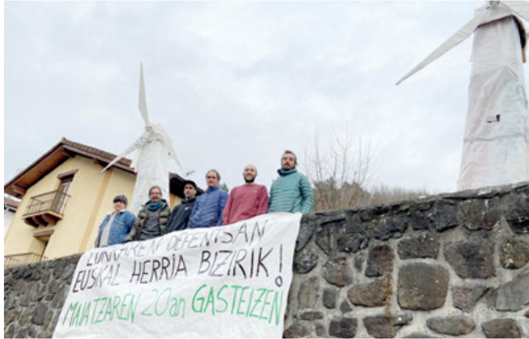
Aramaio Bizirik taldeko kideak, parke ondoan jarri zituzten eolikoekin. A.E.G.

Bestalde, Statkraftek dagoneko badu parketik aterako lukeen energia estazio transformadore batera lotzeko baimena: "Baimena dute Abadiñoko azpiestaziora lotzeko. Horrelako kasuetan baimenak data konkretua izaten du, fidantzarekin. Zortzi errota horietan lortutako energia lur azpitik eramango dute transformadore batera, eta ondoren, aireko kable bidez Abadiñora eramango dute. 135 kilovoltekoak izango dira eta eskatzen dute poste bakoitzaren alde banatara hamar metroko zortasun-bidea. Bide hori etorriko litzateke San Adrian ermitaren azpialdetik, Zabola ondotik, Bolinburutik, Cuatrovientosera eta handik Besaideira eta Abadiñora". Aramaio Bizirik taldearen esanetan, datu horiek erakusten dute parkea egiteko nahia handia dela. "Gaia-