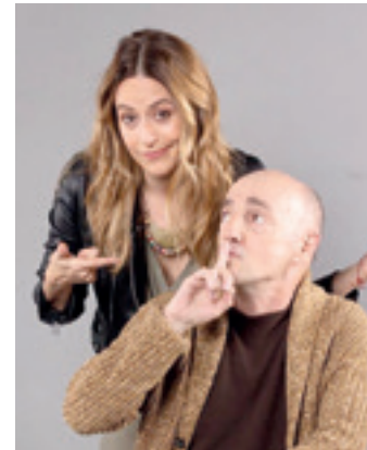
Ituño eta Agirre. TXALO PRODUKZIOAK

Txorakeriez egingo dute berba; adibidez, noren gazta-tartak diren goxoagoak, zein den patinearekin trebeagoa eta nori helduko zaizkion lehenengo odol-pikoak. Baina baita gai serioen inguruan ere: Me Too mugimendua, klima aldaketa eta amatasun subrogatua, besteak beste. "Izan ere, gizarte honen arauak konplexuak direla jakinda, ustez adierazpen-askatasuna nagusi den guneetan jada zenbait gauza ezin dira aipatu ere egin". Premisa horretatik abiatzen da Txalo Produksioak antzerki-konpainiaren obra. Begoña Bilbaok zuzenduta eta Salome Lelouchen