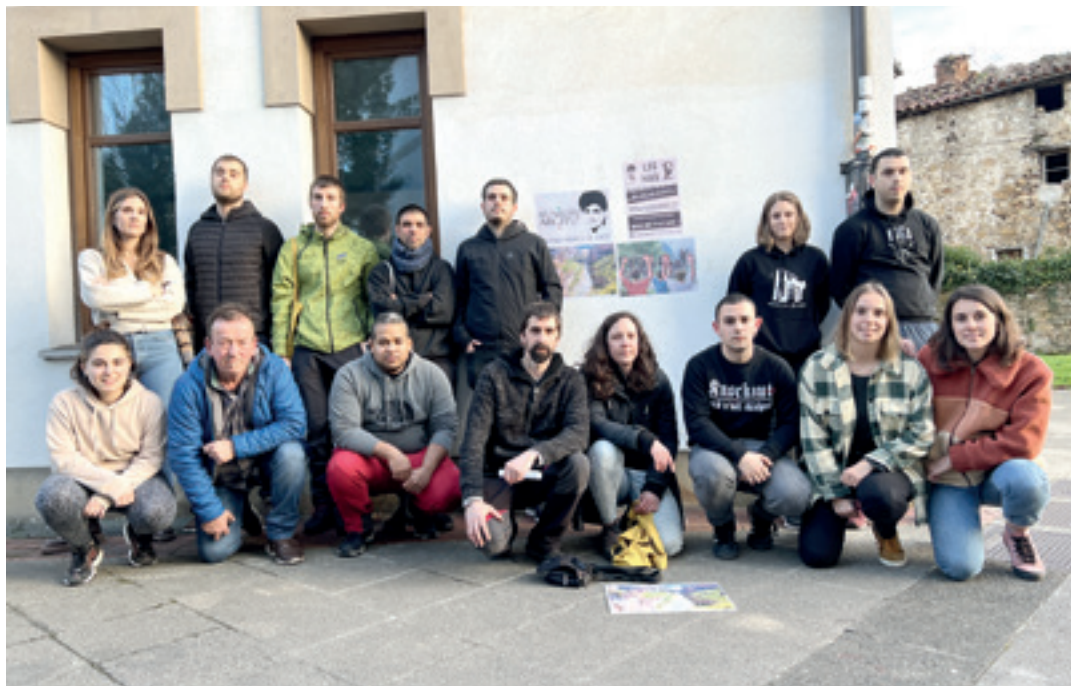
Gure Bazterrak taldearen lanaren berri emateko martitzenean elkartutako taldea. O.E.G.