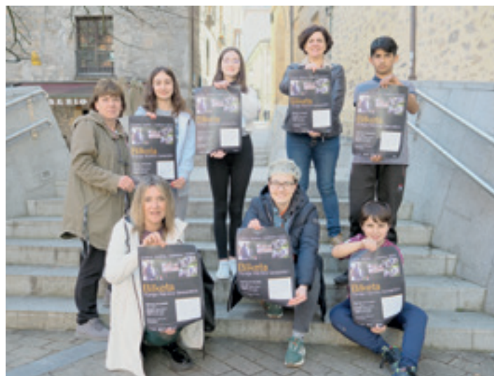
Ekimenean parte hartuko duten zenbait ikasle eta guraso bilketako karteletan. I.S.

Bestalde, Bergarako Aranzadi ikastolaren kasuan, LH6-ko ikasleek azoka solidarioa jartzeko lanketa berezia egin dute. Postua hilaren 30ean jarriko dute Seminarixoko patioan, 17:00etatik aurrera, modu horretan, herritarrek aukera izan dezaten Irungo Harrera Sarearen aldeko ekarpena diruz egiteko.