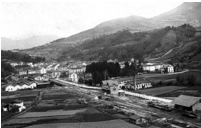
1919an, Nafarroa etorbidea. Erdian, tren geltoki zaharra.