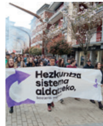
Ikamaren mobilizazioa Bergaran. GOIENA

Debagoieneko Ikamako kideek bost aldarri eroango dituztela adierazi dute: "Euskal Herri osoan euskaraz ikasteko aukera izatea, Nafarroako zonifikazio legea eta Iparraldean azterketak euskaraz egiteko borroka aintzat hartuta; irakaskuntza euskalduna bermatzea, hau da, irakasleek euskaraz behar bezala jakitea; euskara Euskal Herriaren