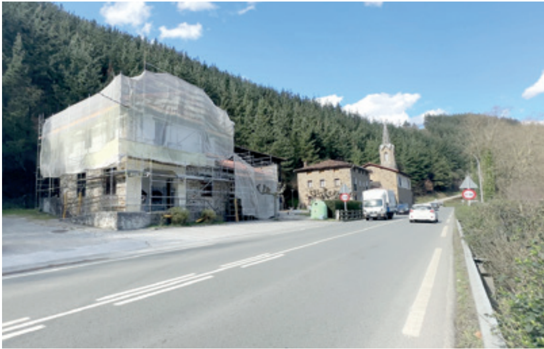
Elorregi auzoko Alkartasuna elkarteko teilatua konpontzeko lanak, asteon. MIKEL AGIRRE