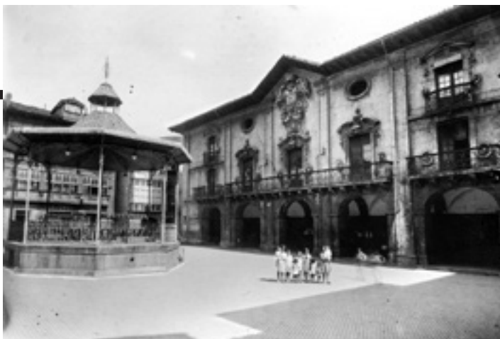
Arrasateko plaza, garai bateko kioskoarekin. MENDIA FUNTSA