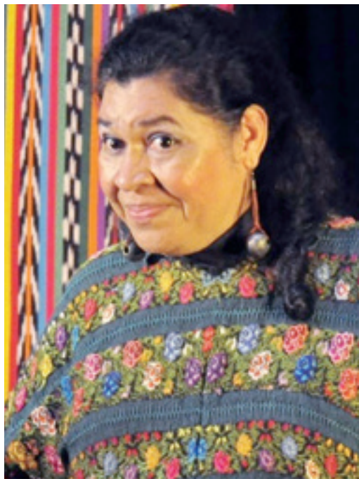
Hioki eta Meza, norbere herrialdeko kontu fantastikoen berri ematen.