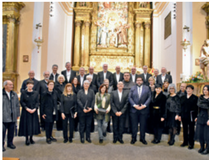
Abesbatzako kideak eta Udaleko Kultura teknikaria, Avilan. ARETXABALETA ABESBATZA

Orain dela zortzi urte ere izan zen Avilan abesbatza: "Damaso