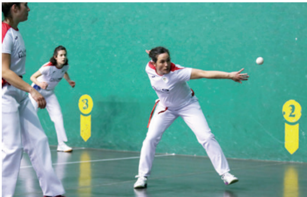
San Isidro pilota txapelketaren lehen aldiko irudi bat, 2019ko maiatzean.