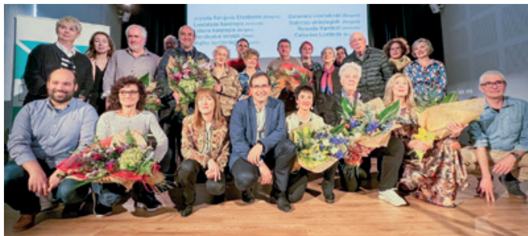
Kulturaten (Arrasate) izan zen ekitaldian ateratako talde-argazkia. MIREIA BIKUÑA