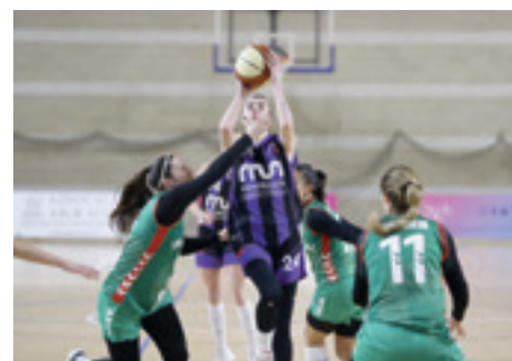
MUko neskek Ibaizabalen kontra. GOIENA