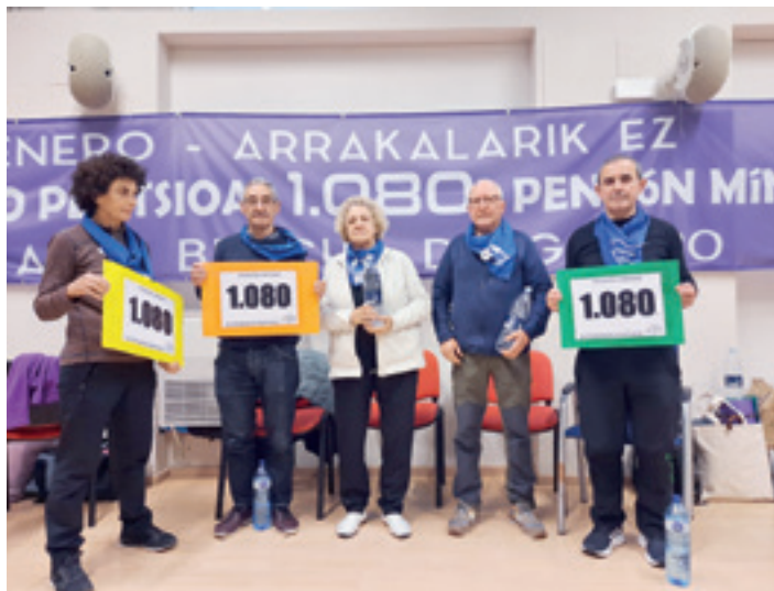
Bost bergarar pentsiodunen baraualdi-itxialdian, martitzenean. I.U.

200 pentsiodun inguruk eman zuten izena baraualdian, baina, leku arazoengatik, egunegun txandakatzen doaz. Debagoieneko hamabost erretiratu izan dira ekintza horretan: Oñatiko hiru