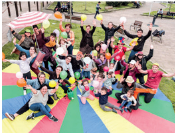
Astelehenean aurkeztu zuten, Euskararen plazan. TXATXILIPURDI

Era berean, AEDko bazkideek eta familia ugarikoei %5eko deskontua izango dute. Bi baldintzak betetzen dituztenek,