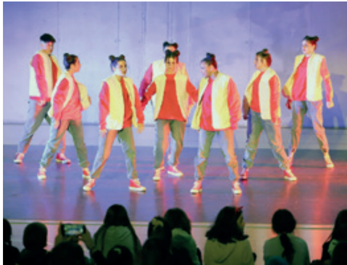
lazio Fun Dantz jaialdiko dantza saioa bat. IMANOL SORIANO

IRABAZLEEK BREAKONSTAGE JAIALDIAN PARTE HARTZEKO AUKERA IZANGO DUTE