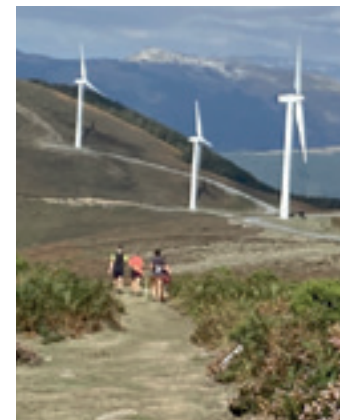
Elgeako parke eolikoa. A.E.G.

Hiru helburu nagusi izango ditu batzarrak: batetik, Udalak energia-iturrien gainean egindako lanketa eta jasotako informazioa azalduko dute; bigarrenik, Aramaion kanpotik jasotako parke eolikoaren proiektuari buruz hitz egingo dute, eta, modu horretan, Udalak herritarren iritzia jasoko du; azkenik, energia-iturrien gainean herritarren informazioa jasotzeko, 2023an zehar herritarrekin egin nahi dituzten hausnarketa saioei buruzko eskema aurkeztuko du Udalak.