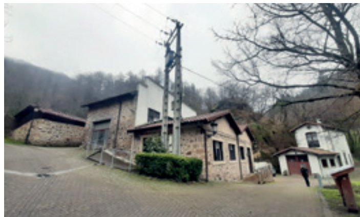
Gatzaren ekoizpen-gunea, Turismo Bulegoko eraikinetik aterata. TXOMIN MADINA