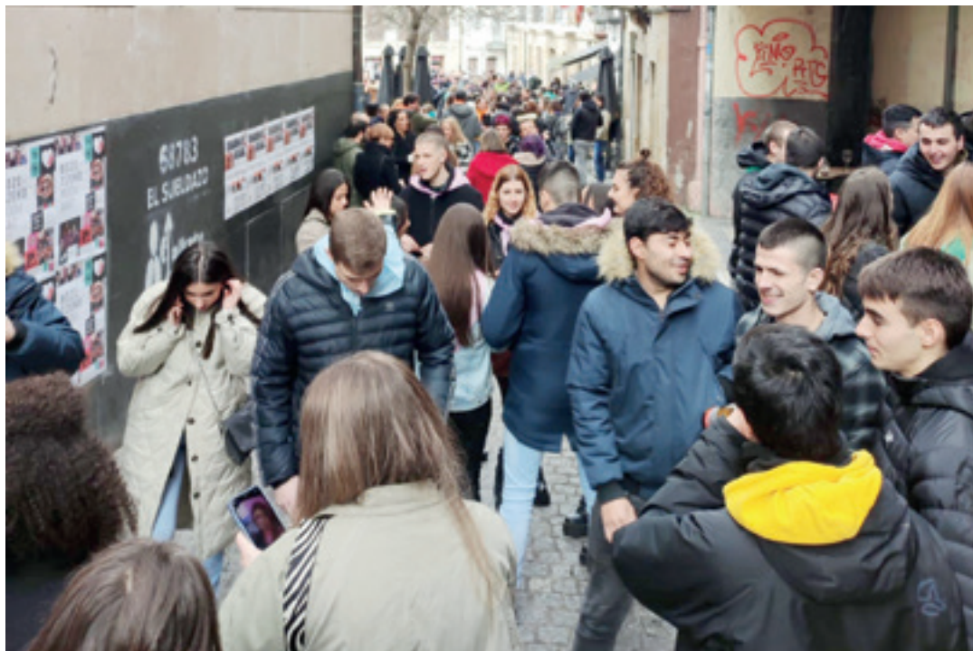
Herriko gazteak festa egun batean. IMANOL BELOKI