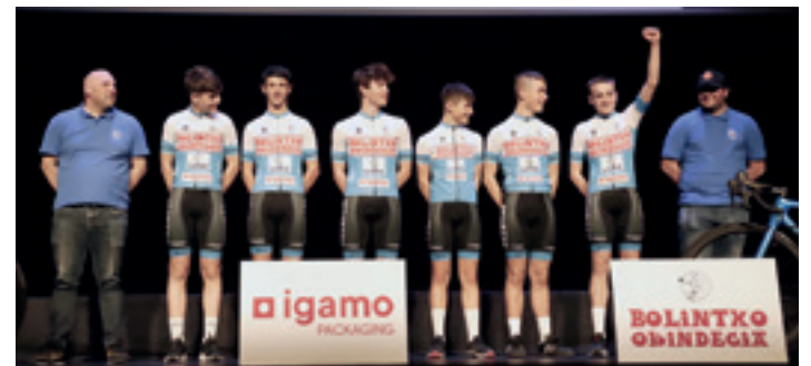
Kadete mailako txirrindulariak.