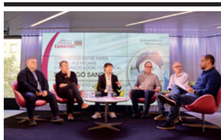
Toki komunikabideen elkarten ordezkariak, 2022ko azaroan, Bartzelonan.