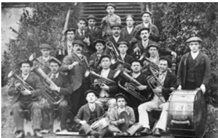
Arrasateko musika banda, 1899an. CARMELO LETONA