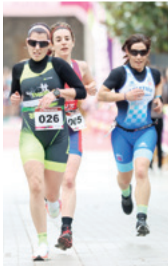
Hiru emakumezko, iaz. GOIENA

Nobedade asko izango ditu bihar go lasterketak. Hasteko, helmuga Oñatiko plazan egongo bada ere, aurten plazaren erdi-erdian jarriko dute, eta, hori horrela, boxak Atzeko kalera eramango