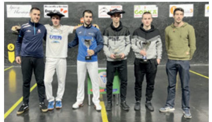
Finaleko protagonistak talde-argazkian. J.B

bezain gogorra eta orekatua izan zen. Finaletan askotan gertatzen den bezala, tentsioagatik eta urduritasunagatik bi pilotariek kostatu egin zitzaizkien partiduan sartzea, eta hasierako tantoetan akats ugari egin zituzten. Behin lasaituta, ondo bukatutako tanto ikusgarriez gozatu zuten zaleek. Biak sartu ziren airez ahal izan zuten guztietan. Bazirudien partiduko gogortasunak Oskoz kalte egingo ziola, iraungo ez zuela ematen zuelako, baina harendako izan zen txapela.