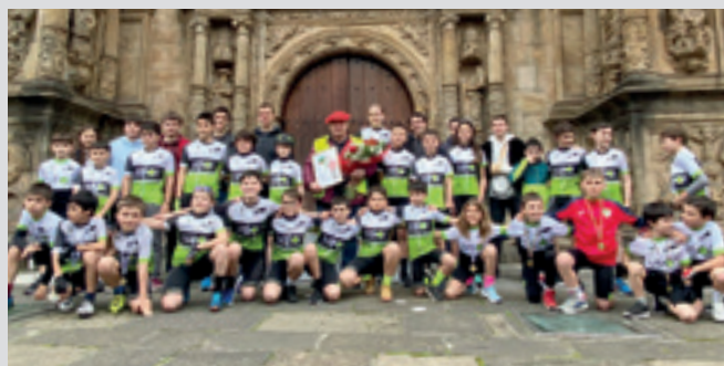
Taldeko txirrindulari gaztetxoak, Arkauzi egindako omenaldian. ALOÑA MENDI

Denboraldiko bigarren lasterketa, lehendabizikoa etxean, izan zuten Aloña Mendiko txirrindulari gaztetxoek joan den zapatuan, eta lasterketa ostean egin zioten omenaldia Arkauzi. Sancti Spiritus unibertsitate aurrean izan zen aurrez mimo handiz prestatutako ekitaldia. Talde-argazkia atera zuten gero denek elkarrekin.