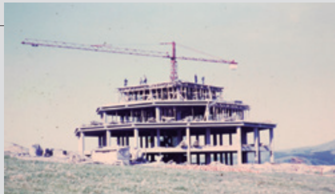
Obrak, 1968ko maiatzaren 13an.

eremutik datorkio– eta eraikina egiten hasi ziren. Lagun talde haren hasierako asmoetan zegoen guztira hiru eraikin egitea, baina, azkenean, bakarra egin zuten; gerora, proiektuaren bideragarritasun ekonomikora begira, jende gehiagori eman zioten sartzeko aukera. Orduetik, pasatu dira belaunaldi batzuk, Altzasu elkarte zaintzen eta hobetzen joan direnak.