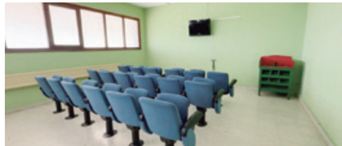
Bi telebista-gela daude Altzasun; irudian, umeendako gela.

izan behar ziren; itzela da. Azkenean, bakarra altxatu zen, oso handia dena eta makina bat lan ematen diguna".