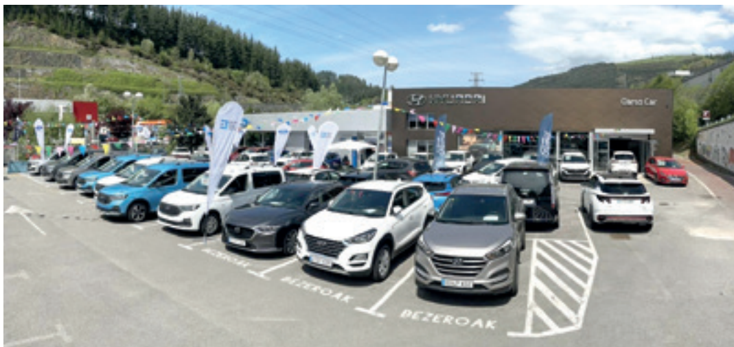
Apirilean, zero kilometroko eta aukerako autoen I. Azoka egin zuten Arrasaten. HYUNDAI OARSO CAR