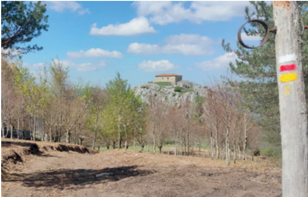
Uxarretik Atxorrotzeko tontorrera bidea garbituta –apirilean ateratako irudia–, urrunean ermita dagoela. FELIX BELTRAN DE HEREDIA