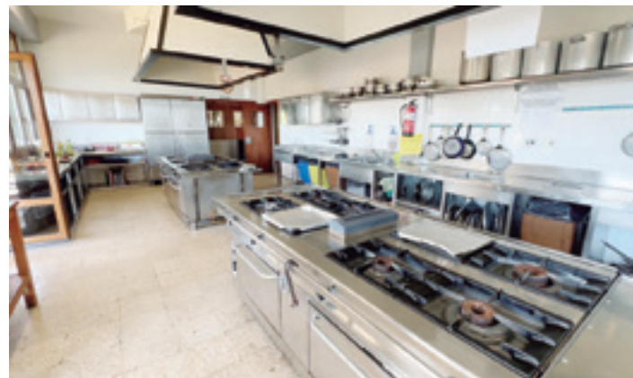
Elkartea bera bezala, erraldoia da sukaldea. J.B.L.

egun batez elkartea itxi egiten da eta bazkideak ezin dira joan, Mizpirualde egoitzako egoiliarrek erabiltzen dutelako. Umeen Eguna ere antolatzen dute, askotariko jolasekin, eta azaro partean Gaztaina Erre Eguna ere ospatzen dute –elkartean dauden danbolinetan 40 kilo gaztaina erretzera heldu izan dira–. Horrez gain, zuzendaritza taldekoak duela urte batzuk egiten zen mendi-irteera eta osteko garbantzujana berreskuratu nahian dabiltza.