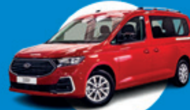
Ford TOURNEO CONNECT