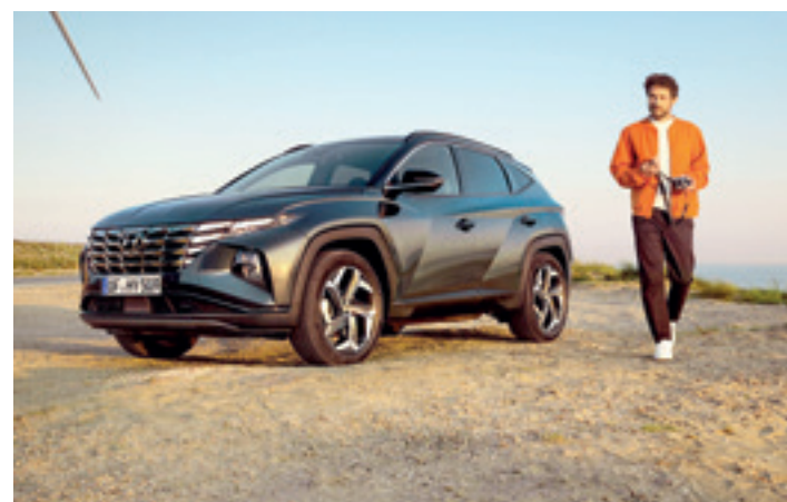
Hyundai Tucson autoa. HYUNDAI OARSO CAR