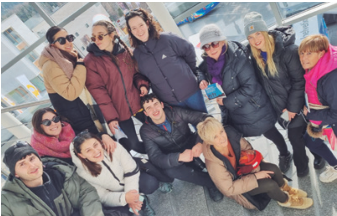
Ikasurte honetako administrazio arloko zuzendaritza-laguntza goi mailako zikloko ikasle taldea Suitzan.