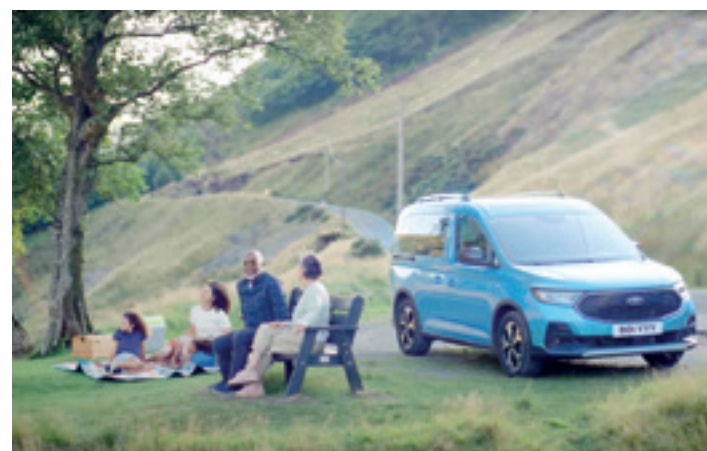
Ford Tourneo Connect. FORD EASO MOTOR

adierazi dituzte: "Ibilgailu funtzionala da, erabilera guztietarako; zabala eta eroso da; malletegi handia du, nahi duzun guztia eramateko; gidatzen laguntzeko sistema aurreratuena izanda, segurtasuna bermatuta dago; diseinu erakargarria du; fidagarria da, Tucson tailerretik gutxien pasatzen den ibilgailua da eta; berehala entregatzen dugu autoa eta 5 urteko bermea ematen dugu, kilometro-mugarik gabe; bezeroen baldintza zorrotzenak betetzen ditu; 2023an ere indarrean dauden deskontu bikainei esker prezio onean erosi daiteke; eta motorretan aukera zabala du".