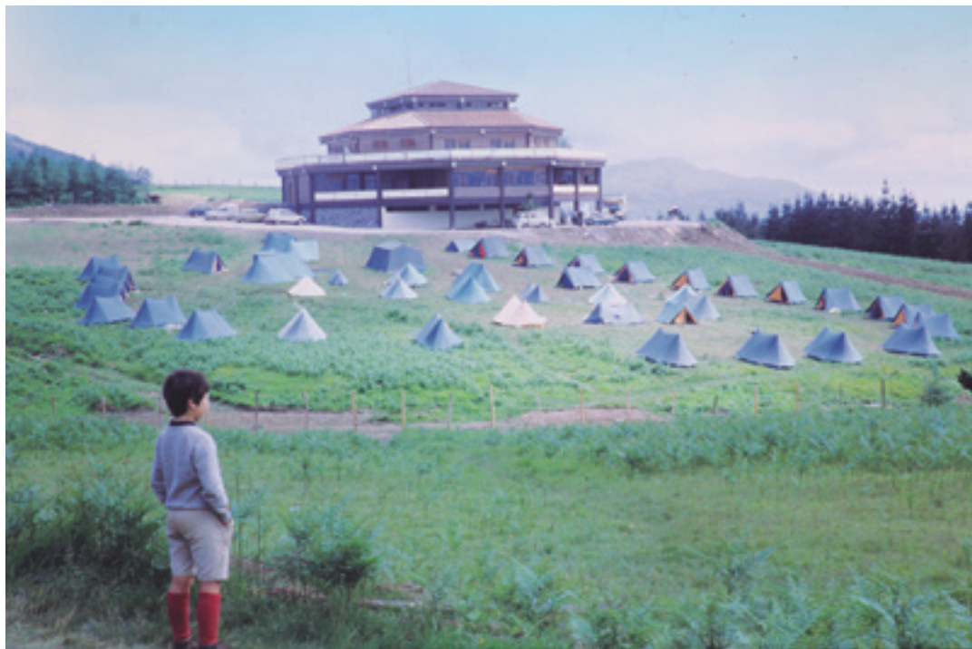
Gaztetxo bat Altzasu elkartera begira, 1973an egin zuten kanpaldian. SERAFIN ESNAOLA, MIGUEL ANGEL ELKOROBEREZIBAR FONDOA

1964ko ekainaren 17an eratu eta 1964ko abenduaren 28an legeztatu zen irabazi asmorik gabeko Altzasu gastronomia eta mendi elkarte, eta 1968an hasi ziren