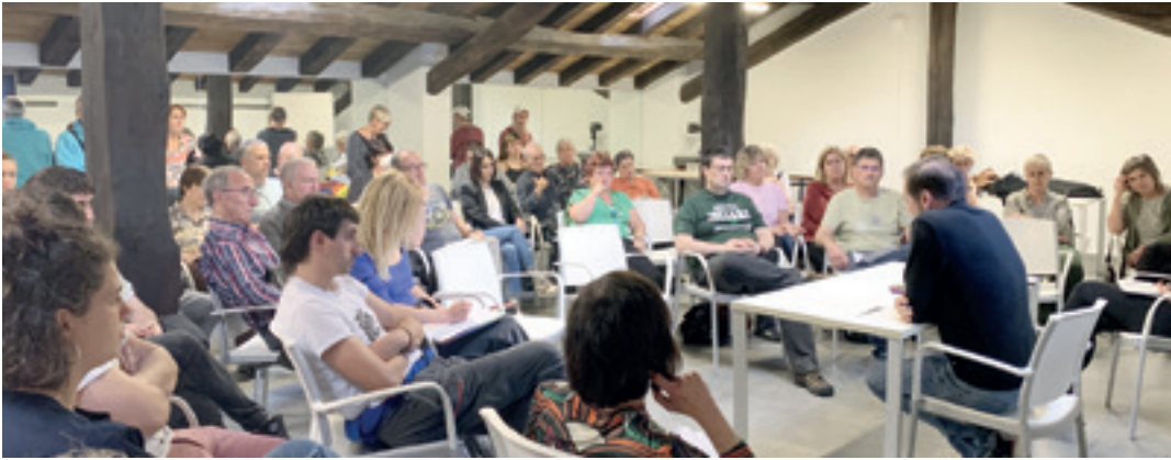
Kulturateko Jokin Zaitegi gelan aurkeztu zuten protokoloa, joan den astean. HASIER LARREA