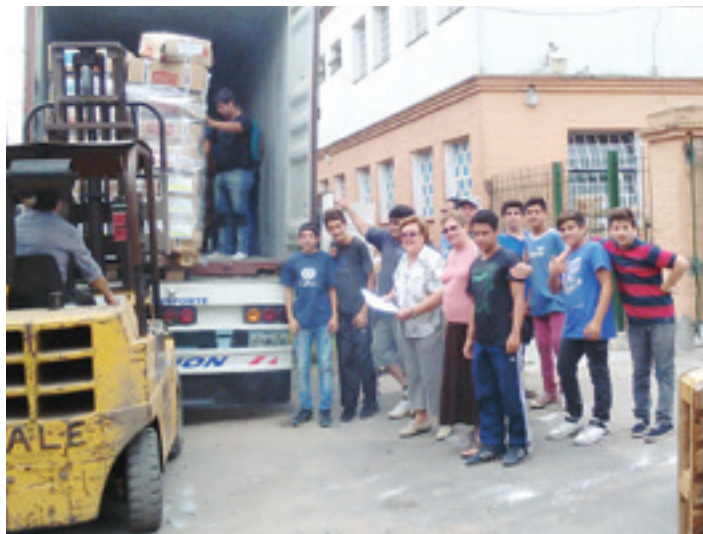
San Jose Providenteren egoitzan materiala deskargatzen. HERMANSOLOÑA

Gaur egungo laguntza ekonomikoa da, gehienbat. Duela urte batzuk arte, arropaz betetako kontainerrak bidaltzen zituzten,