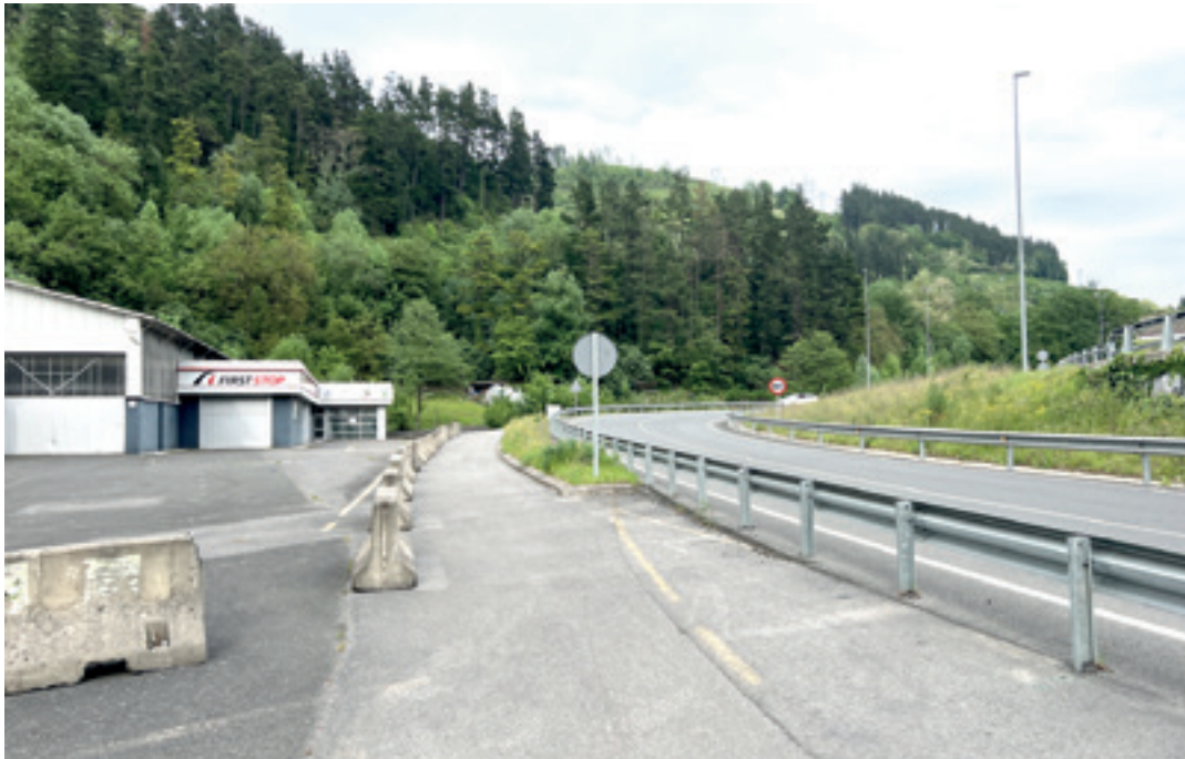
Antzuola eta Bergara arteko errepeidea, Aseginolaza parean. I.A.A.