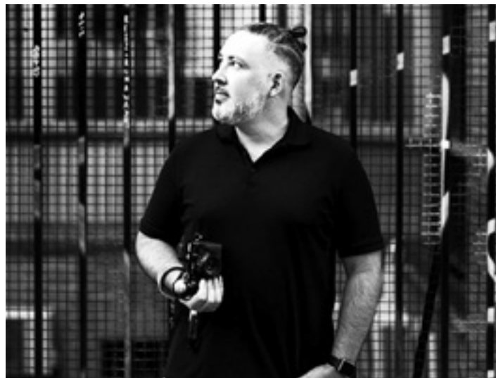
Gustavo Bravo argazkilaria. JEOSM

Udal liburutegiak maiatzerako ere antolatuko du ipuin saioa: Ba-