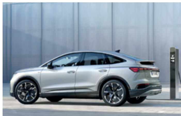
Audi Q4 Sportback e-tron. UDALAITZ AUTOAK