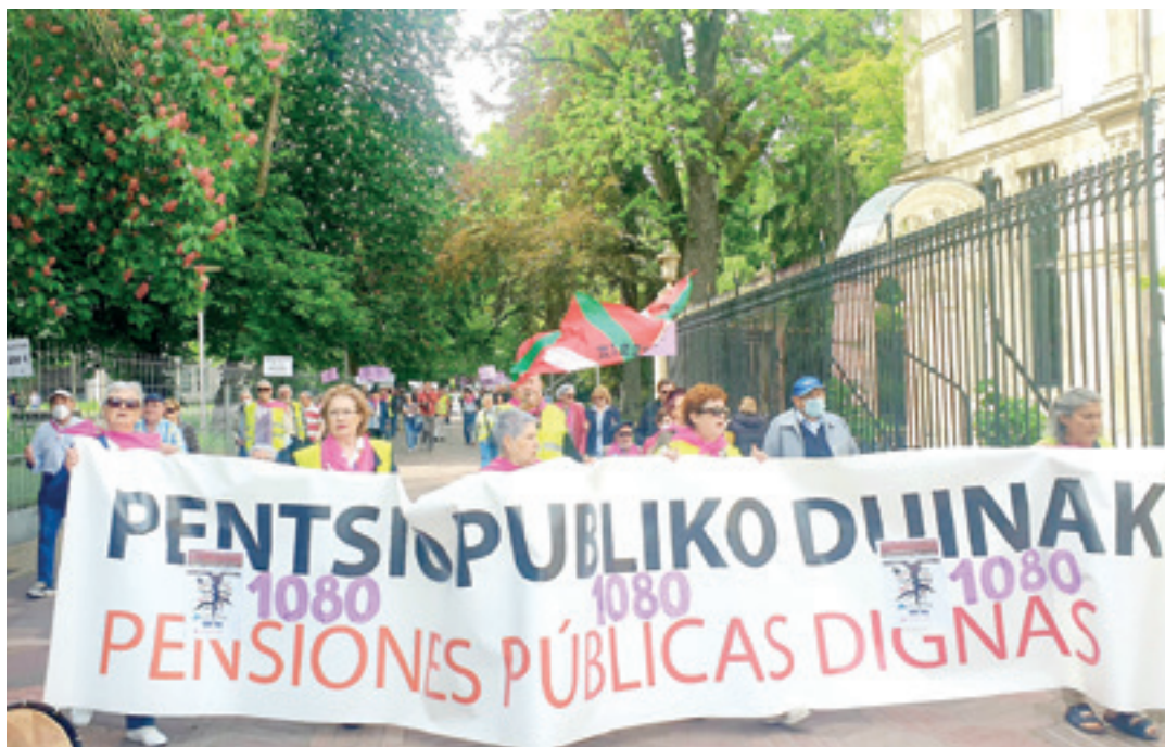
Duela urtebete Gasteizko Legebiltzarrera egindako martxa. ARRASATEKO PENTSIODUNEN MUGIMENDUA