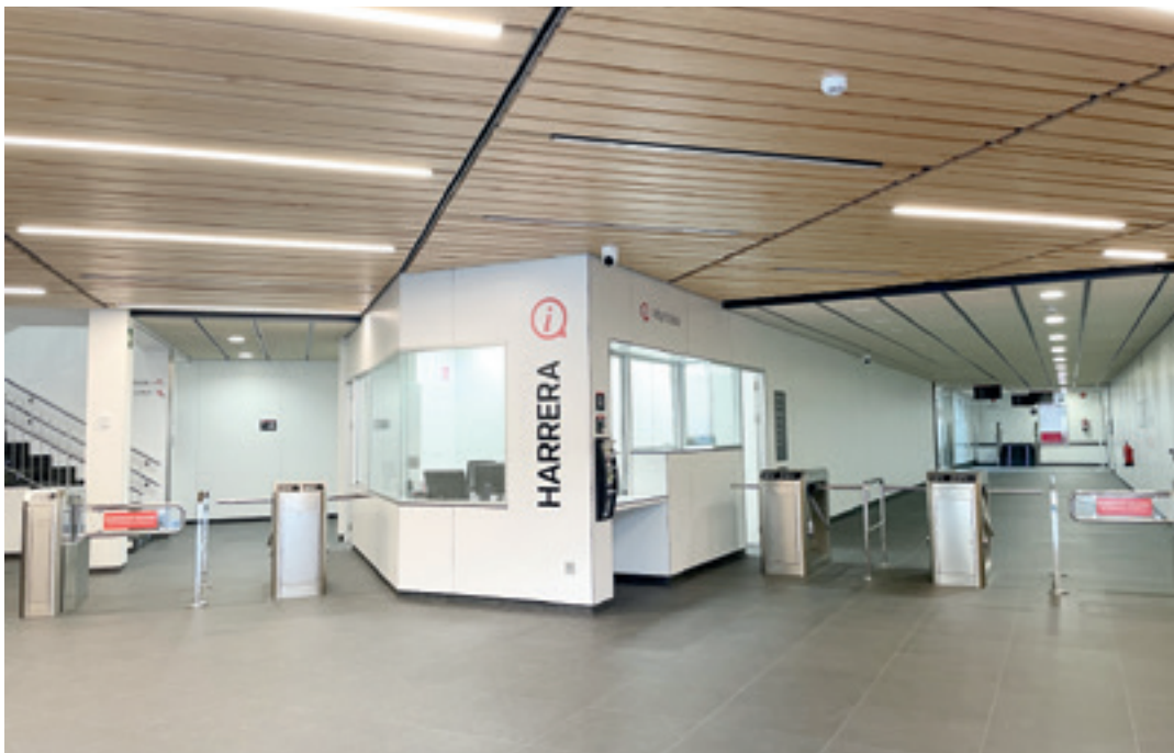
Zubikoa kiroldegiko sarrera. O.E.G.