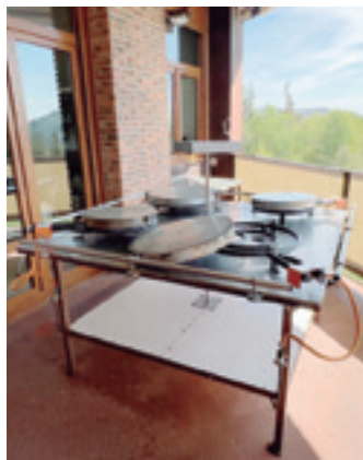
Lau paella-ontzi, terraza baten. J.B.L.