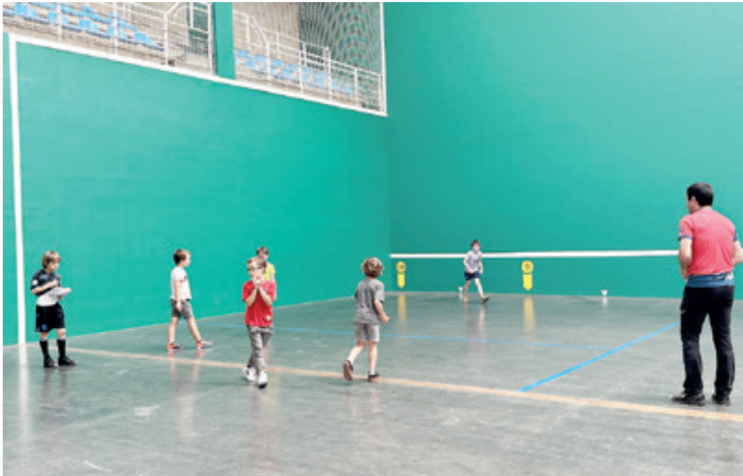
Pilota eskolako haur batzuk, martitzenean, Antzuolako udal pilotalekuko atzeko paretan. A.R.K.