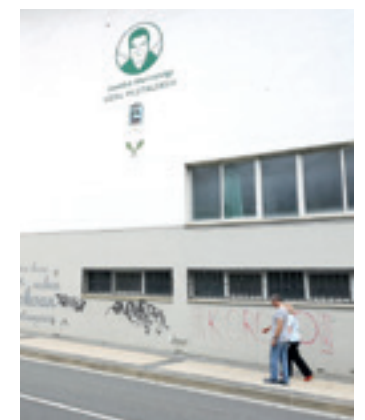
Frontoia atzealdean. I. BELOKI

Udal hauteskundeetan botoa eman nahi dutenak pilotalekura joan beharko dute hilaren 28an botoa ematera. 2020ko Eusko Legebiltzarrerako hauteskundeetan, pandemia sasoiaren, segurtasun distantziak mantentzeko frontoian jarri zituzten hauteskunde mahaiak, kultura etxean beharrez, eta oraingoan ere modu berean egingo dute.