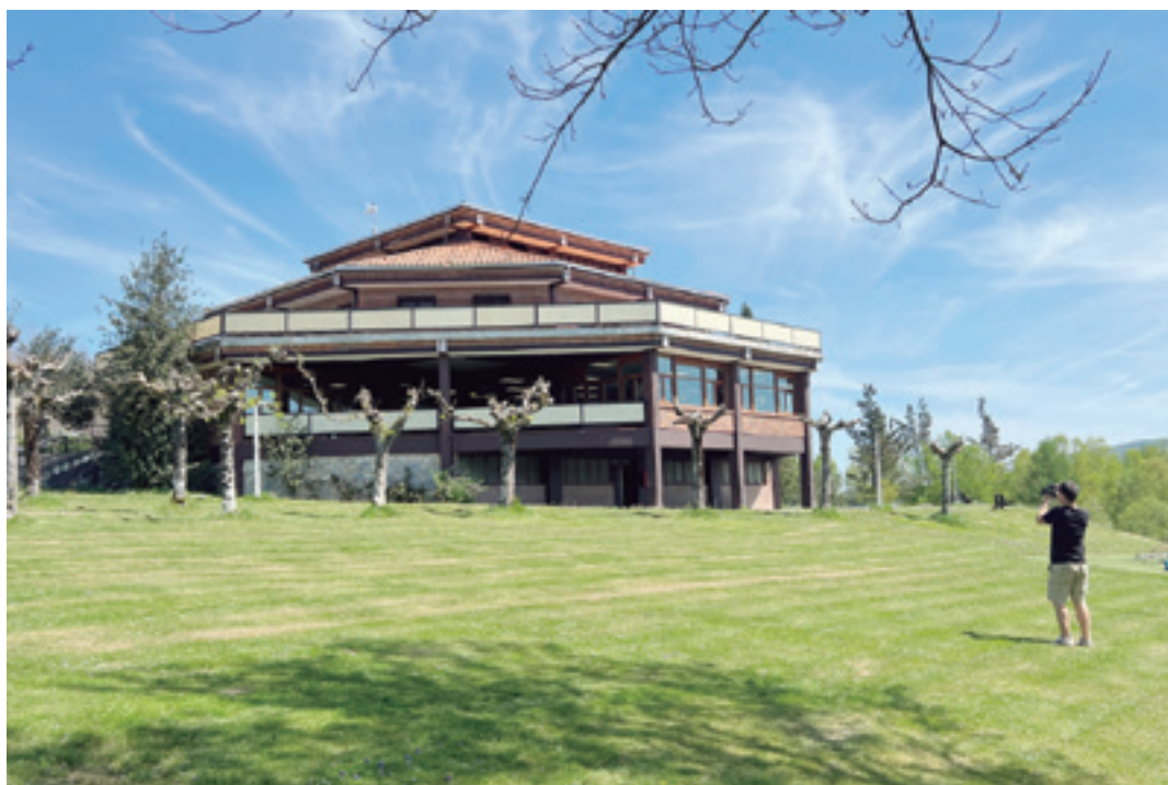
Altzasu kanpoko belardia, gaur egun; belarra auzolanen mantentzeko ohitura dute zuzendaritzakoek. JOKIN BEREZIARTUA LIZARAZU

Arzelusek, bestalde, Altzasu gastronomia elkarte bat izateaz gain mendi elkarte ere badela azpimarratu du: "Gorlako inguru honetan beste elkarte batzuk ere badaude, eta horiek guztiek komunean dute mendi elkarteak direla. Denok edo gehienok ezagutzen ditugu kaleko elkarteak; kaleko elkarteek