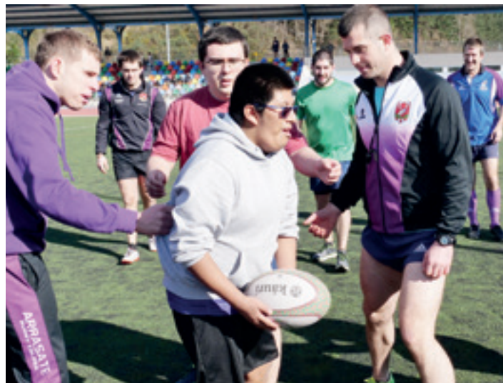
Inklusibo taldearen lehenengo entrenamendu saioetako bat, 2019an.

Egin beharreko bide horretan aurrerapauso bat eman berri dute, MUKo Hezkuntza Zientzien Fakultatearekin hitzarmena sinatu berri du-eta ARTk. Eta horrekin lortu gura dutena da talde inklusiboko partaideentzako lagungarri izan daitezkeen orientatzeko metodo eta tresnak garatea. "Downen sindromea, espektro autistako nahasmen- du mailak, garuneko paralisia