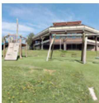
Ziburuak duela 50 urte eta gaur egun.

inprobisatzeko aukera ematen dute. Mendi elkarteek ez dute, akaso, inprobisatzeko aukera hori ematen, baina naturarekin eta mendiarekin harremana eta askatasuna eskaintzen dute. Abiadura izugarri azkarrean bizi garen garaiotan, edozein mendi elkarte geratzeko eta erlaxatzeko aukera ematen du; nik neuk gero eta gehiago baloratzen dut hori".