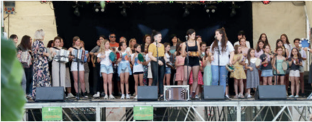
Iaz Eskoriatzan ospatu zuten Debagoieneko Trikitixa Eguna. IMANOL SORIANO