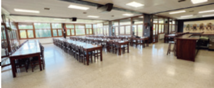
Jangela nagusian aldi berean 150 bat lagunek jan ahal izateko lekua dago. J.B.L.