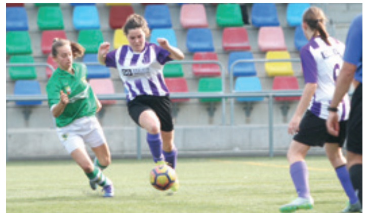
Mondrako neskek Hernaniren kontrako partiduan, 2017an. GOIENA

Badut asmoa MMAko borrokaldietan esku hartzeko. Baina helburu bakarrarekin: han ikasitakoa gero kudora eramateko.