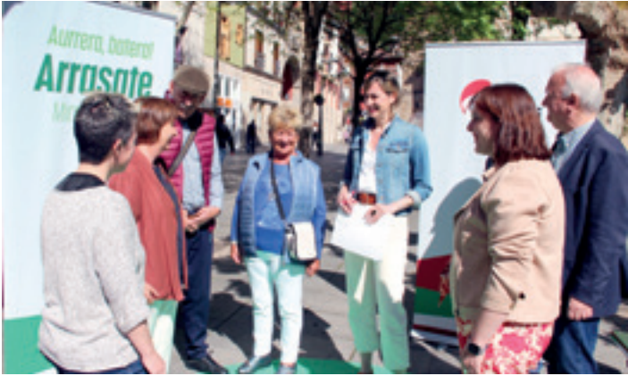
EAJko hainbat ordezkari, adinekoei haien proposamena azaltzen. EAJ