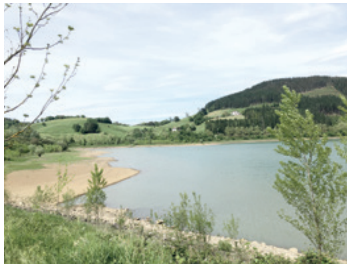
Urkulu urtegiaren egoera eguaztenez. O.E.G.

Egun duen ur kopuruak, baina, ez du, hasiera batean, behintzat, alarrik sortu behar. Urkuluk 65.500 biztanle hornitzen ditu urez eta pertsona kopuru horren ohiko ur kontsumoa ikusita badirudi negu hasierara heltzeko beste ur badagoela, nahiz eta hori ezin den ziurtzat jo. Baliteke datozen egunetan edo asteetan euria egitea eta betetze-maila igotzea. Kontrara, euririk ez badu egiten, edo gutxi egiten