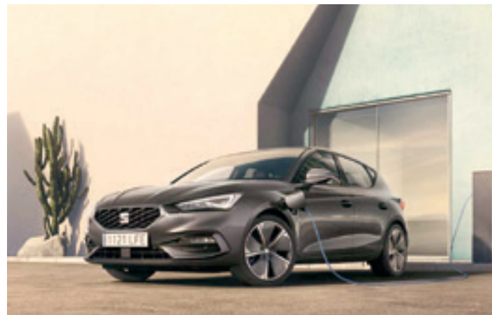
Seat Leon E-Hybrid. UDALAITZ AUTOAK

Skoda markaren lehen SUV-a da ENYAQ IV auto elektriko berria, 204 ZPko potentzia eta 510 kilometroko autonomia du. 4,64 metroko luzera du eta 585 litroko maletategia, markaren indargune eta bereizgarri handienetako bat. Ibilgailuak 0 eta 100 km/h arteko azelerazioa eskaintzen du bederatzi segundoko baino gutxiagoan. Skodak Cockpit instrumentazio sistema birtuala ere eskaintzen du. Abiadura baino askoz gehiago erakusten duen TFT pantaila digitala dauka.