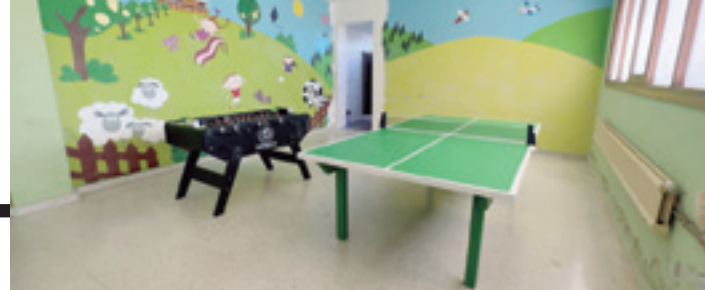
Futbolina eta ping-ponga, ume eta gaztetxoendako gunean. J.B.L.