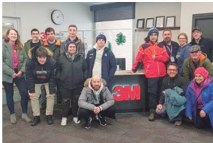
Eleanitz eredu mektronikako goi mailako zikloko hainbat ikasle, Minnesotan.