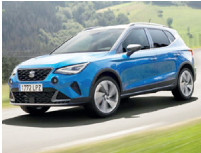
Irudian, apirilean gehien saldu den autoa, Seat Arona.

Geroz eta auto gehiago saltzen ari dira. Datuek ez dute gezurrik esaten. Salmenten hazkundea begi-bistakoa da. Apirilean 74.749 matrikulazio izan ziren Espainian, 2022an baino %8,2 gehiago. Gainera, azken hilabete honetan gehien saldu diren bost autoetatik hiru Arrasateko Udalaizt Autoak kontzesionarioan erosi daitezke. Automobilien eskaintza zabala dute eta punta-puntako markekin egiten dute lan; besteak beste, Audi, Seat, Volkswagen eta Skodarekin. Geroz eta auto gehiago saltzen ari diren garaian, aukera ona izan daiteke Arrasateko Udalaizt Autoak kontzesionariora joatea.