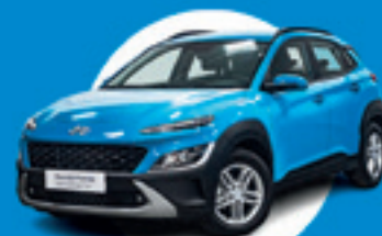
Hyundai KONA MAXX TGDI 120 CV