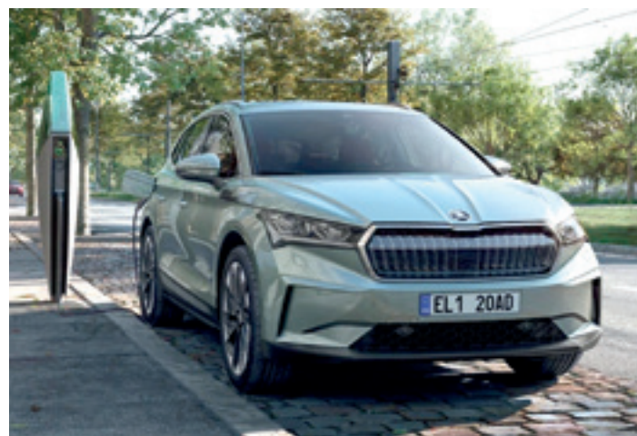
Skoda Enyaq IV autoa. UDALAITZ AUTOAK