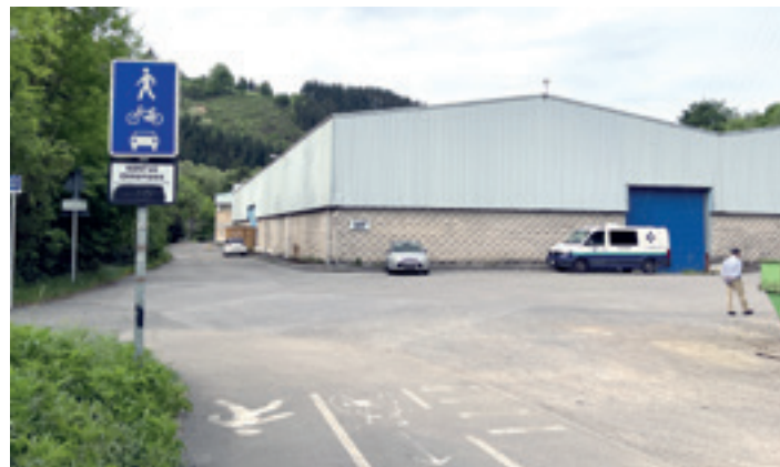
Bidegorria amaizten den gunea, Elorregin, Bergararantz, Tavex-en inguruan. I.A.A.

besteak beste–. Bergarako Udalak dioenez, bere egunean Aldundiak okupazioko aurretiatzko akta sinatu zuen, baina ez zuen jabetza eskuratu. Foru Aldundiaren ardurapean dago zati hura. Bertatik azaldu dutenez, Mugikortasun eta Lurralde Antolaketaren Saileko teknikariak proiektua aztertzen ari dira, baina, aurreratu dutenez, ez daukate aurreikusita aurtengo programazioan.