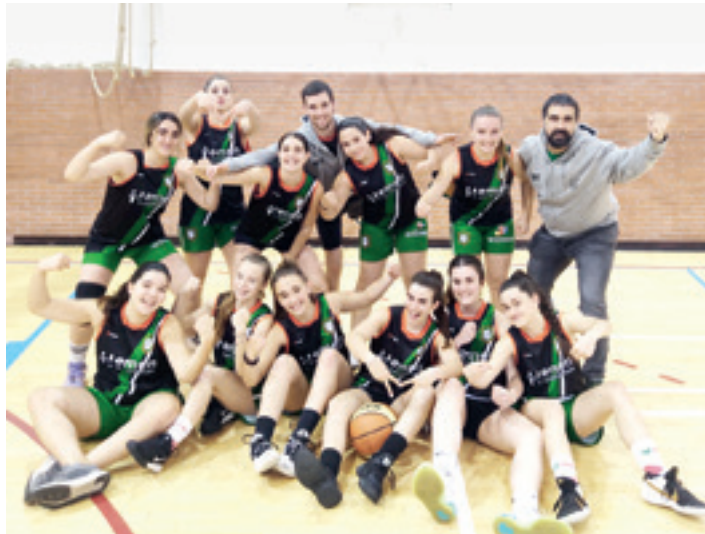
Hemen Garbiketak Eskoriatzako junior errendimenduko saskibaloitako taldea. J. E.

Denboraldi honetan hamazazpi partiduko jokatu dituzte, guz-