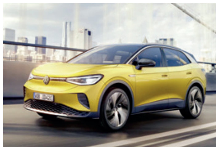
Volkswagen ID 4 elektriko. UDALAITZ AUTOAK