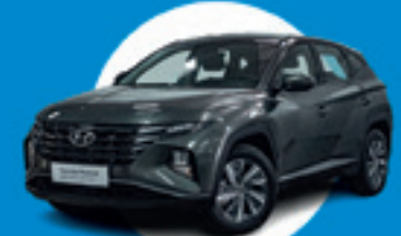
Hyundai TUCSON Klass T-GDI 150 cv