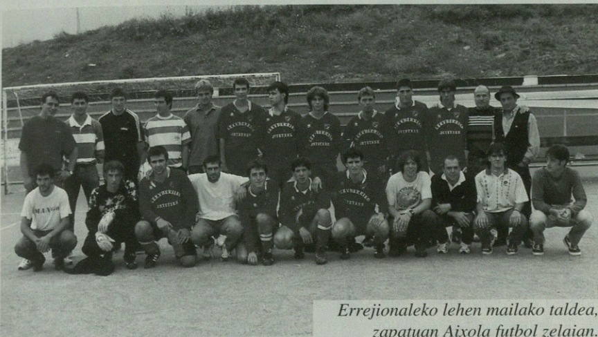
Errejonaleko lehen mailako taldea, zapatuan Aixola futbol zelaian.

Denboraldia hasi aurreko bi partiduetan emaitzak aldekoak ez izan arren, errejonaleko lehenengo mailan jokatu duen Antzuolako Kirol Elkar-teak (AKE) gogoz hartu du ligaren hasi-