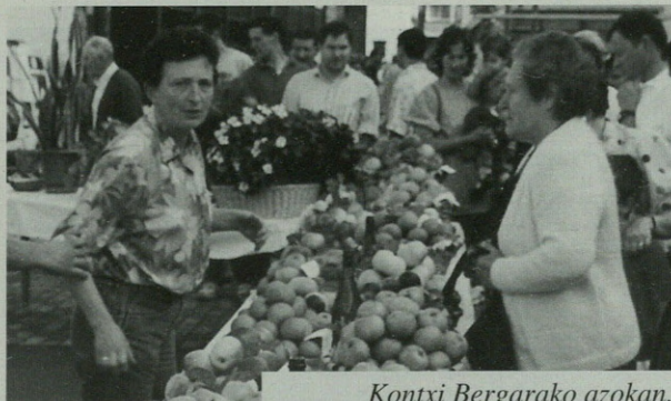
Kontxi Bergarako azokan.

Bi baserriar hauen ustez, San Martinetako feria sasoi nahiko onean ospatzen da; "batzuk, orain bi-hiru urte, Erremu Zapatura aldatu nahi izen zeber ferixia, baiña atzera egin bihar izen ze-