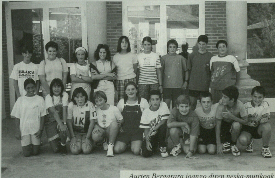
Aurten Bergarara joango diren neska-mutikoak.