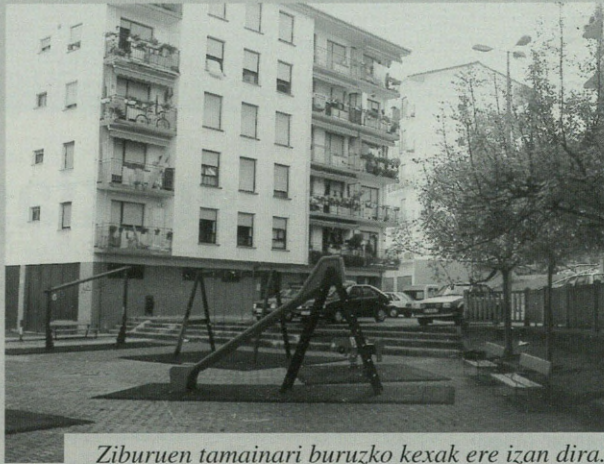
Ziburuen tamainari buruzko kekek ere izan dira.

Errekalde auzokoek 172 bizilagunen sinadurak aurkeztu dituzte udal-txean, auzoko arazoak konpontzeko eskaerarekin batera. Auzoko batzuen hitzetan, ekimen honen helburua "auzoan urteetan konpontzeke dauden arazoei irtenbidea bilatzea" da.