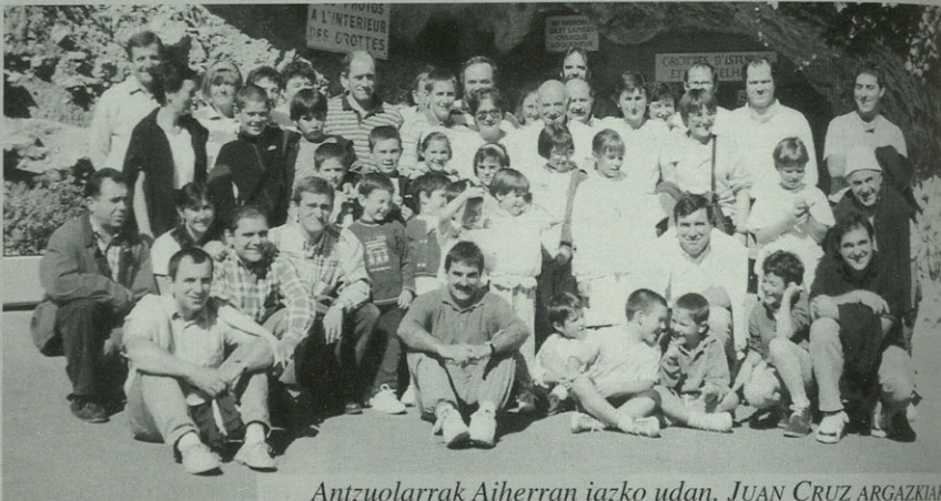
Antzuolarrek Aiherran iazko udan.