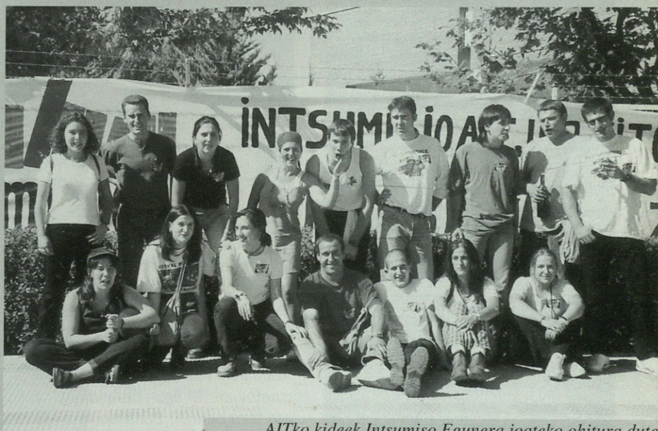
AITko kideek Intsumiso Egunera joateko ohitura dute