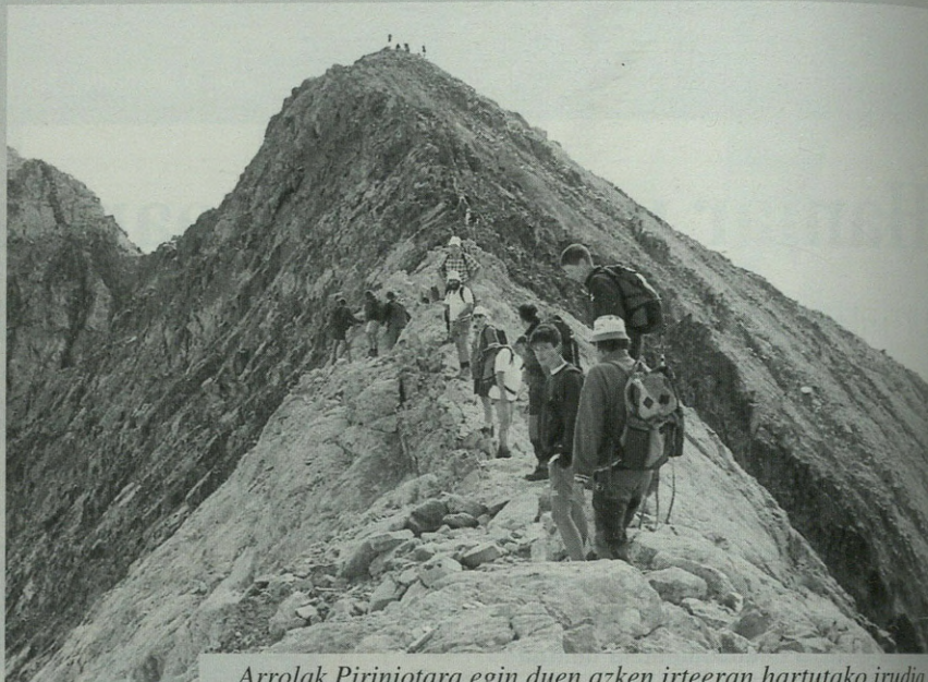
Arrolak Piriniotara egin duen azken irteeran hartutako irudia.