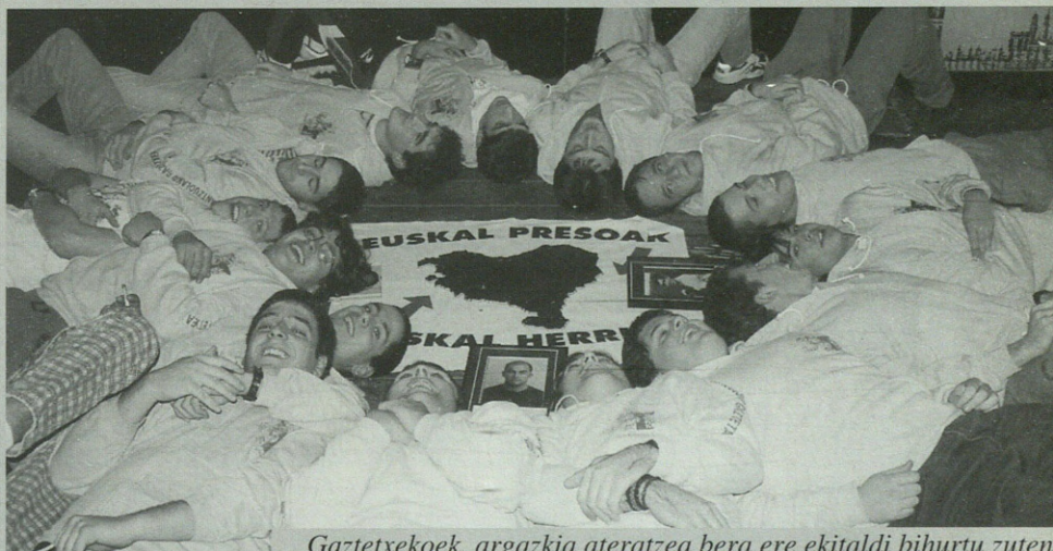
Gaztetxeok, argazkia ateratzea bera ere ekitaldi bihurtu zuten.

Hamabi urte dira Gaztetxea zabaldu zela; ordutik urtean behin aukera