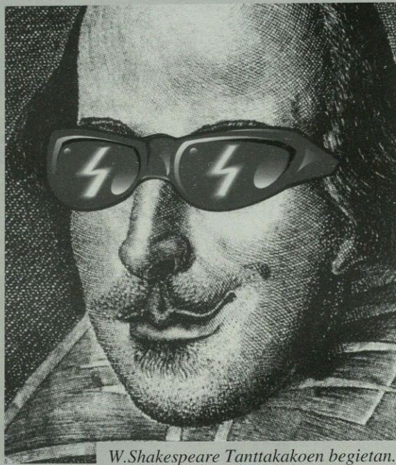
W.Shakespeare Tanttakakoen begietan.