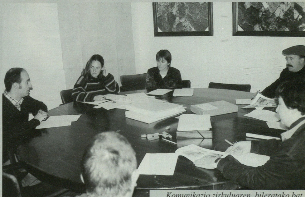
Komunikazio zirkuluaren bileratako bat.

Bi urte pasatxo bete dituen planaren bidez, gero eta gauza gehiago bideratzen dituzte euskaraz: artxibo admi-