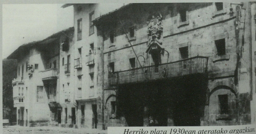
Herriko plaza 1930ean ateratako argazkian.

■ ■ ■ “Erreguçen dogu, eximidu, libradu eta atera daigula Ançuolako universitatea bere baserriequin vergara urico iurisdicioatik...” ■ ■ ■