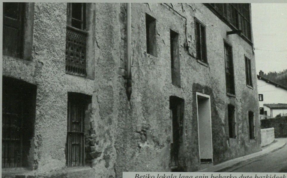
Betiko lokala laga egin beharko dute bazkideek.

Orain dela 37 urte zabaldu zen Danok Bat. Herrian emakumeak sartu zitezkeen elkarte bakarra zen garai haietan eta gaur egun 270 bazkide ditu. Urte guzti hauetan Tellerianeko etxean egon den elkartekoek joan zen domekan beste leku batera joan edo atea itxi behar dituzten erabakitze bilerak izan zuten; hala ere, leku eskaintza bat baino gehiago izan dutenez beste bilerak bat egitekotan dira bazkide guztien artean lekuri proposena topatzeko.