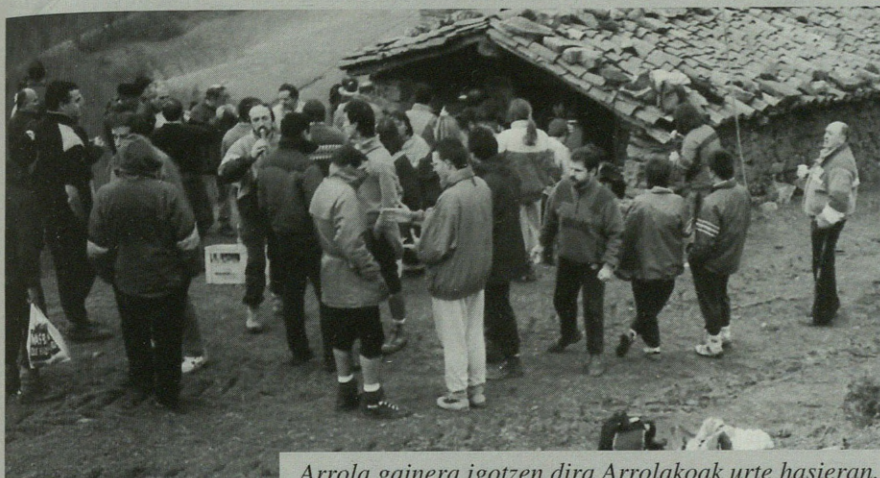
Arrola gainera igotzen dira Arrolakoak urte hasieran.

Bazkal ostean partehartzaileek kantuan egiteko letrak banatuko dituzte antolatzaileek.