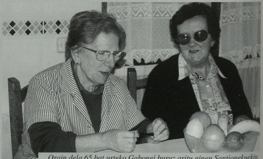
Orain dela 65 bat urteko Gabonei buruz aritu ginen Santionekuekin.

■ ■ ■ “Natibittate goizian bat jaikitzen zan eta txokolatia egitten zeban bestiendako” ■ ■ ■