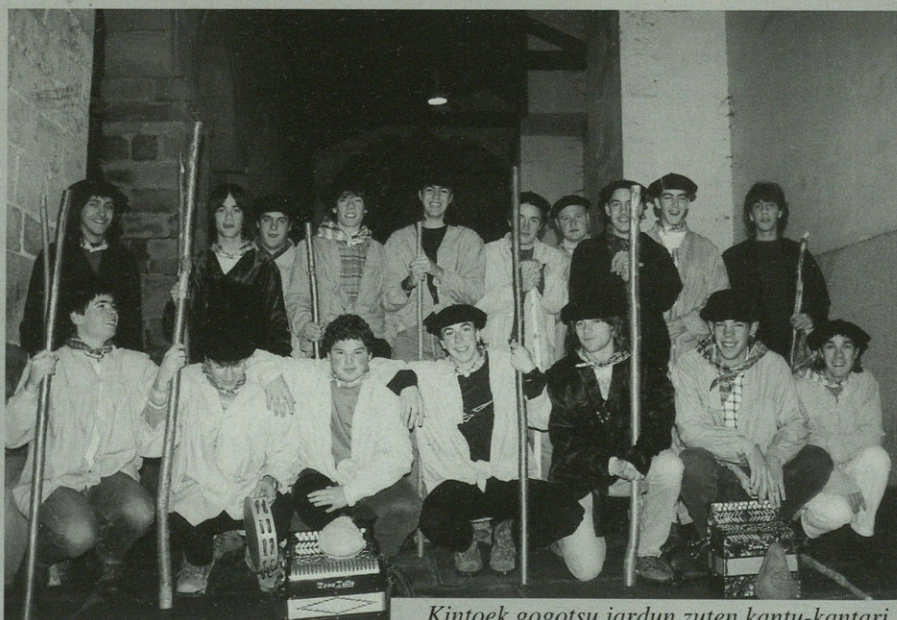
Kintoek gogotsu jardun zuten kantu-kantari.

■ ■ ■ "Urtian zihar basarriren batian hildakoren bat egon bada, han errezauegitten da" ■ ■ ■