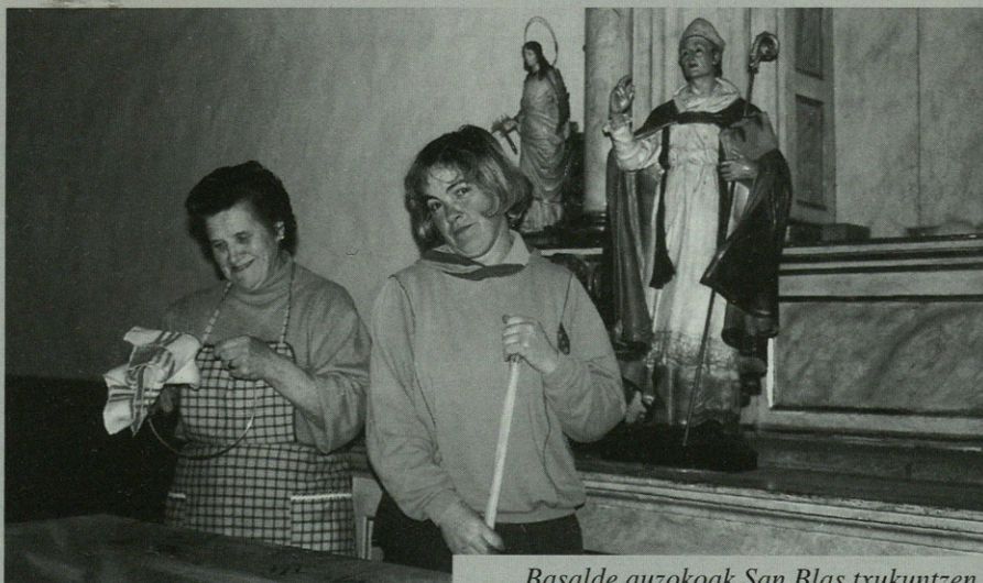
Basalde auzokoek San Blas txukuntzen.

Galartza auzokoek Santa Ageda eguna ospatuko dute domekan, otsailaren 8an. Eguerdian meza izango da eta horren ondoren, 12:30ak aldera, salda, ardoa eta pintxoak eskainiko dizkiete bertara joaten diren guztiei. Gainera, trikitilariak ere izango dira giroa alaitzen.