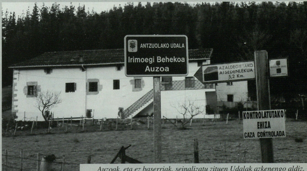
Auzoak, eta ez baserriak, seinalizatu zituen Udalak azkenengo aldiz.

U dala herriko baserrien izenak nola idatzi behar diren zehazteko ahaleginean aritu da pasa den irailetik. Udalak baserrietako seinalizazioa egiteko asmoa du udaberrir aldera eta horren aurretik euskal toponimian adituak direnen iritzia jaso dituzte, Euskaltzaindiak emandako irizpideen arabera jokatzeko. Hemen behean aurkezten dizuegun izen-zerrenda da Udalak orain arteko irizpide guztiak kontutan izanik osatu duena: