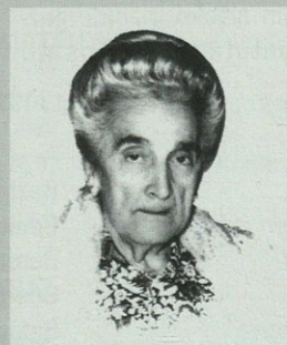
Pantxika kalera irten zen azken eguneko argazkia dugu, 1977ko urriaren 25ekoa. 21urte daramatza aulkian.