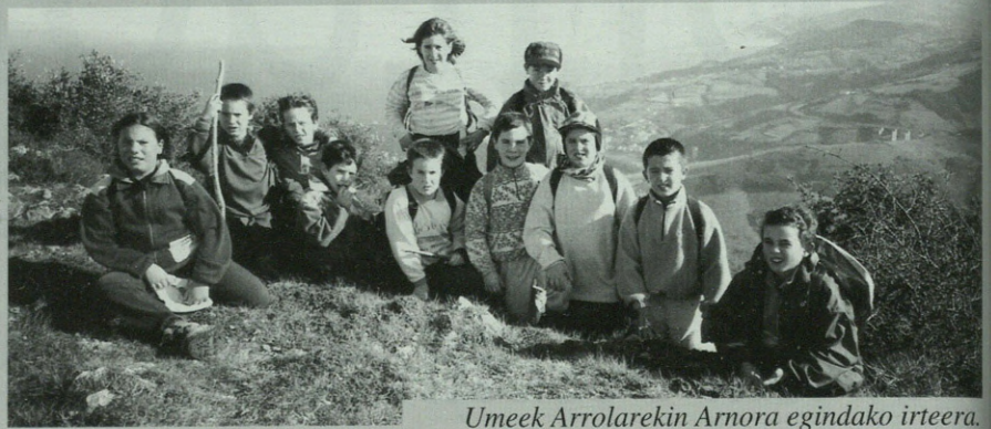
Umeek Arrolarekin Arnora egindako irteera.