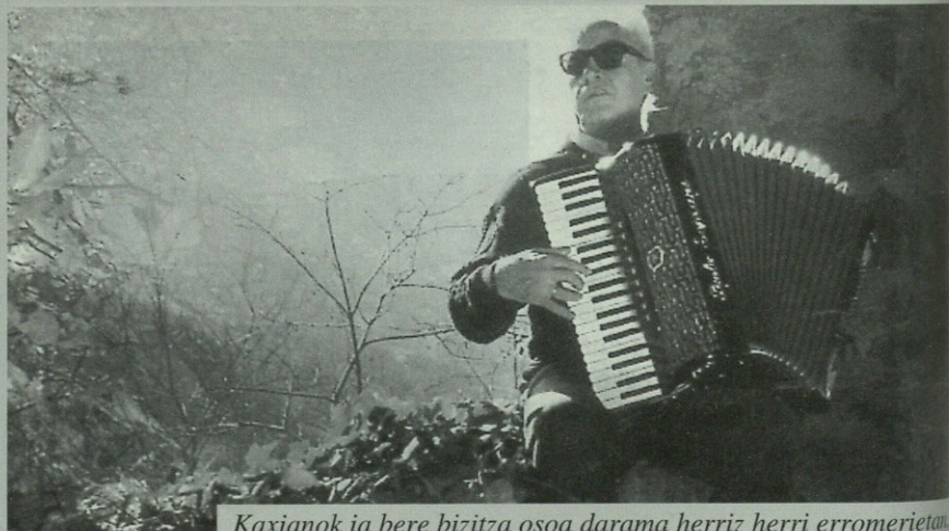
Kaxianok ia bere bizitza osoa darama herriz herri erromerietan.

■ ■ ■ "Agur Antzuolari, gu jaiotako euskaldun txoko zoragarria agur, herritarrei Arrola mendi azpian dugu gure kabia" ■ ■ ■