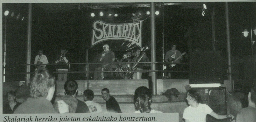
Skalariak herriko jailetan eskainitako kontzertuan.

Goizean, mendi irteera Trekutzerara, gosea egiteko. Ondoren, babajana 1.500 pezetan. Izen ematea martxoaren 26a baino lehen.