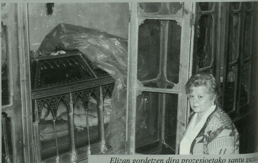
Elizan gordetzen dira prozesioetako santu guztiak

■ ■ ■ "Jesus, agur Jaun maite, amodiozkua. Damu degu guztiok zu nahigabetua" ■ ■ ■