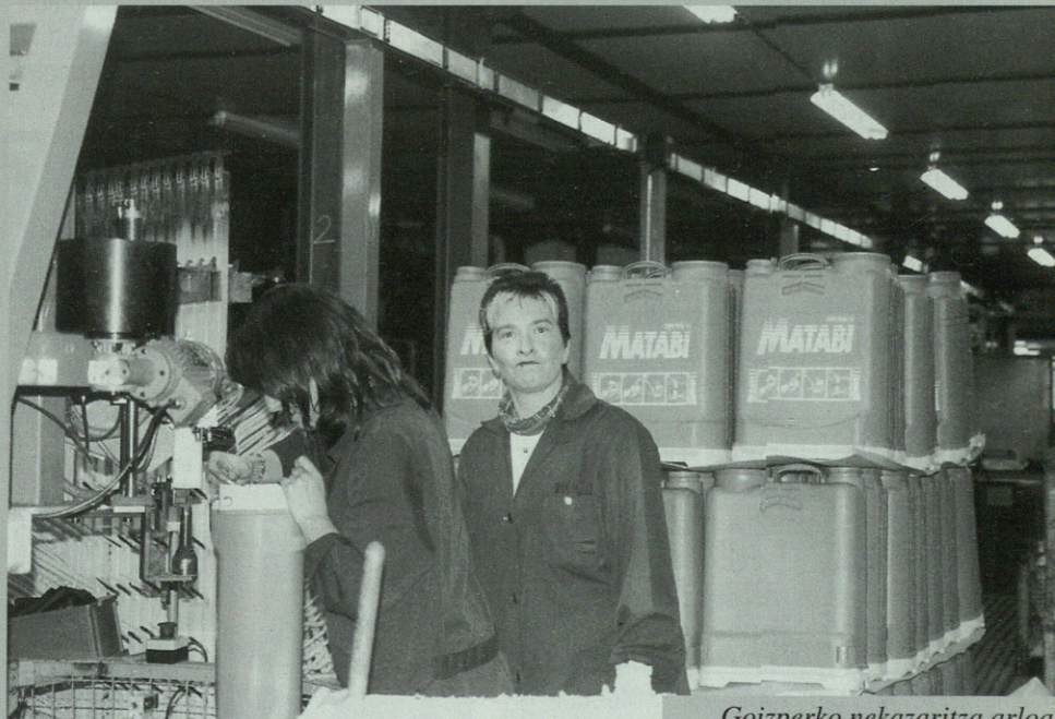
Goizperko nekazaritza arloa