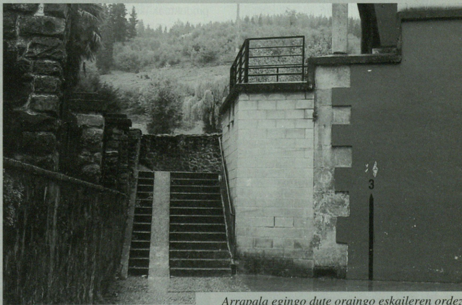
Arrapala egingo dute oraingo eskaileraren ordez.

Osakidetzak honelako lanak egin ahal izateko aukera eskaini du. Hori dela eta, Udalak dirulaguntza eskatuko du "osasun zentrorako sarbidearen arazoaren konponketa azterlana egiteko" azkenengo Gobernu Batzordean erabaki zutenez.