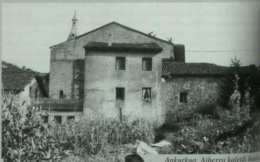
Ankurkua, Aiherra kaletik ikusita

1901.ean kanposantu aldera gero zaltagia izan zena gehitu zioten