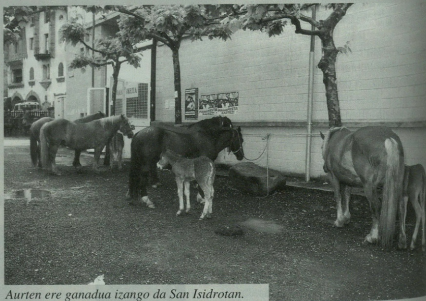
Aurten ere ganadua izango da San Isidrotan.

Hitzaldi ostean, Urruñako txaranga-ekin kalejira egingo da Aiherra kalera-ko. San Isidro egun hori aprobetxatuko du Udalak Aiherra kalea inauguratzeko. Herri bazkaria ere egingo da egun horretan eta ihauterietan dantzan aritu ziren antzuolarrak zerbait prestatzekotan dira eguna alaitzeko.