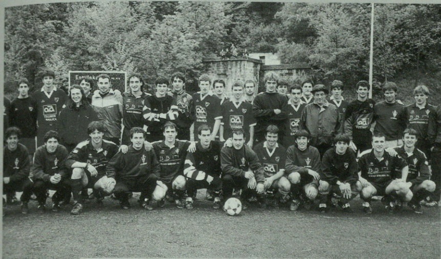
Bergararrak eta antzuolarrak elkarrekin, partidua hasi aurretik.