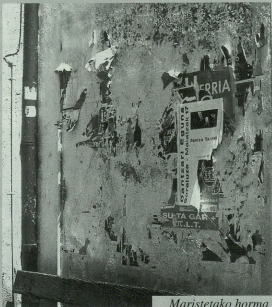
Maristetako horma honetan ere panela ipiniko du Udalak.