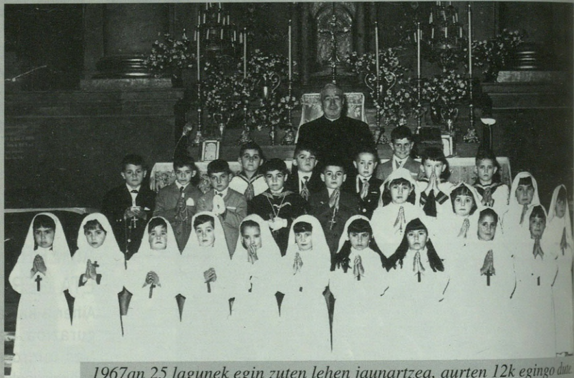
1967an 25 lagunek egin zuten lehen jaunartzea, aurtan 12k egingo dute.

Neskak, behintzat, ilusiño mortala eukitzen giñuan soiñeko haura jazteko. Erregaluekin enaiz akordatzen, baiña soiñeko haura jazteko bai. Haren ondorenian Korpus Kristi eguna zetorren eta prozesiño inportantiena soiñekua izeten zan. Abadiak esaten zoskun "zuek eztaukuzue ilusiñoik egun horretarako, zuek trapuen ilusiñua daukuzue bazarrik". Akordatzen naiz gure aurretik komuniua egin bihar zebeak (maiatzaren 4an egin bihar zebeak, eta maiatzaren batian edurra ziharduan) jun zela abadian esatera soiñeko zurixa ezingo zela jantzi eta komunio solemne horren eguna atzeratzeko.