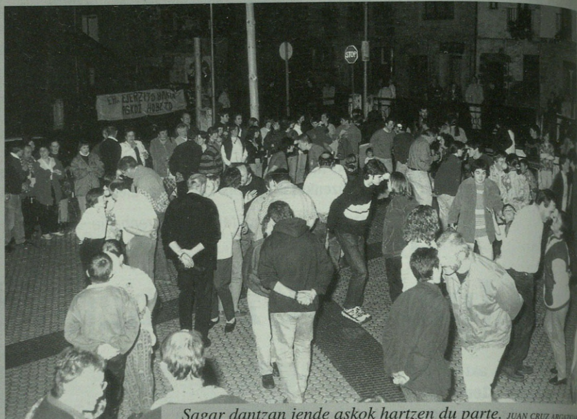
Sagar dantzan jende askok hartzen du parte. JUAN CRUZ ARGONZOLA

Gavarnie-Goriz-Perdido irteera antolatu du Arrolak ekainaren 27 eta 28rako. Izena emateko egunak ekainaren 22a, astelehena, eta ekainaren 23a, martitzena, dira, 19:00etatik 20:00etara Arrolaren lokalean.