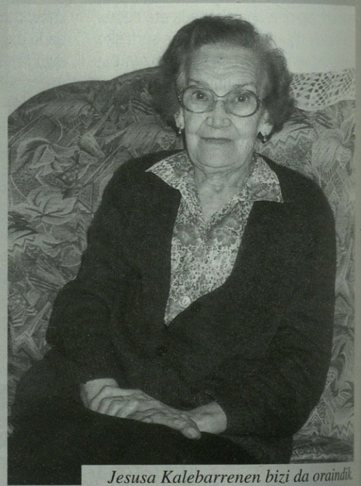
Jesusa Kalebarrenen bizi da oraindik.