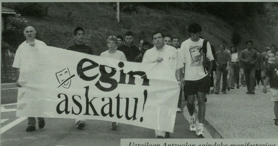
Uztailean Antzuolan egindako manifestazioa.

Mozioarekin, operazio polizialean egindako atxiloketak eta bi komunikabideen itxiera salatu nahi izan zuten zinegotziek. Honela, eta mozioan irakurtzen denez, "atxiloketa hauekin eta Egin irratia eta egunkaria itxtearekin gobernu eta epaile espainiarrek, adierazpen eta iritzi askatasuna ixilarazi nahi izan dutelako gure gaitzespena adierazi eta berriz irekitzeko exijitza" eskatzen zen.