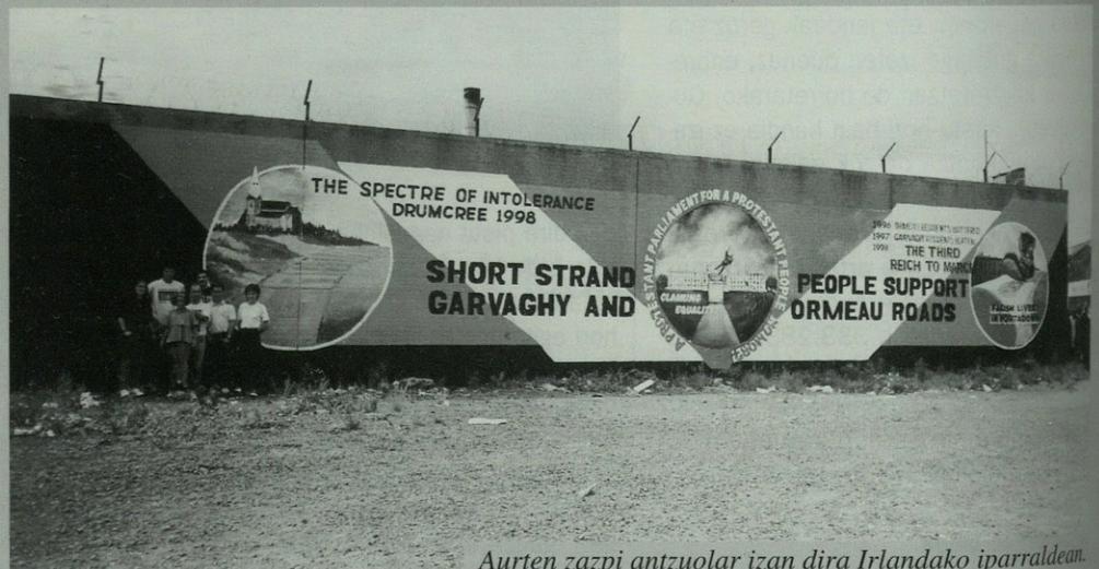
Aurten zazpi antzuolar izan dira Irlandako iparraldean.

Negu partia nahiko lasaixa eta tristia da. Hamaiketan dana ixten dabe; illun egoten da, eurixa, haizia... Oso tristia da. Zapatuan bakarrik egoten da ambiente piskat. Agostua oso diferentia da. Lehenengo astian egoten die Sinn Féin antolatutako festibalak, auzo katoliko guztitan, eta oso ondo egoten die. Aste osua izeten da, kultur ekintzak, filminak... Eguaztena beti izeten da euskaldunen eguna. Aurten eta iez ezta