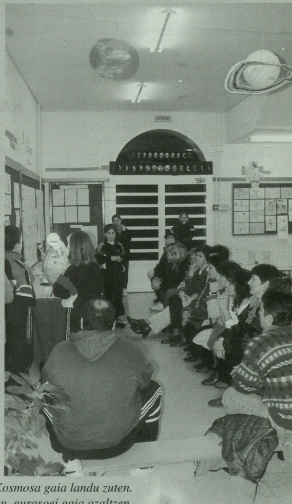
Iazko 5. mailako haurrek Kosmosa gaia landu zuten. Argazkian, gurasoei gaia azaltzen.

Giza gorputzari buruzko saiakera konstruktibista hau argitaratu nahi du Eusko Jaurlaritzak. Horretarako, irakasleek lana berregituratu eta 50 orritan bildu beharko dute, ondoren Hezkuntza Sailera eramateko. Antzuolarren lanarekin batera, Donostiako Amara Berri eskolako, Tolosaldea eskolako eta Portugaleteko eskolako lanak argitaratuko dira. Lau eskola horien artean, Lehen Hezkuntza eta Lanbide Heziketako ikastetxeak daude eta horien artean antzuolarrena izan zen euskaraz egin zen bakarra.