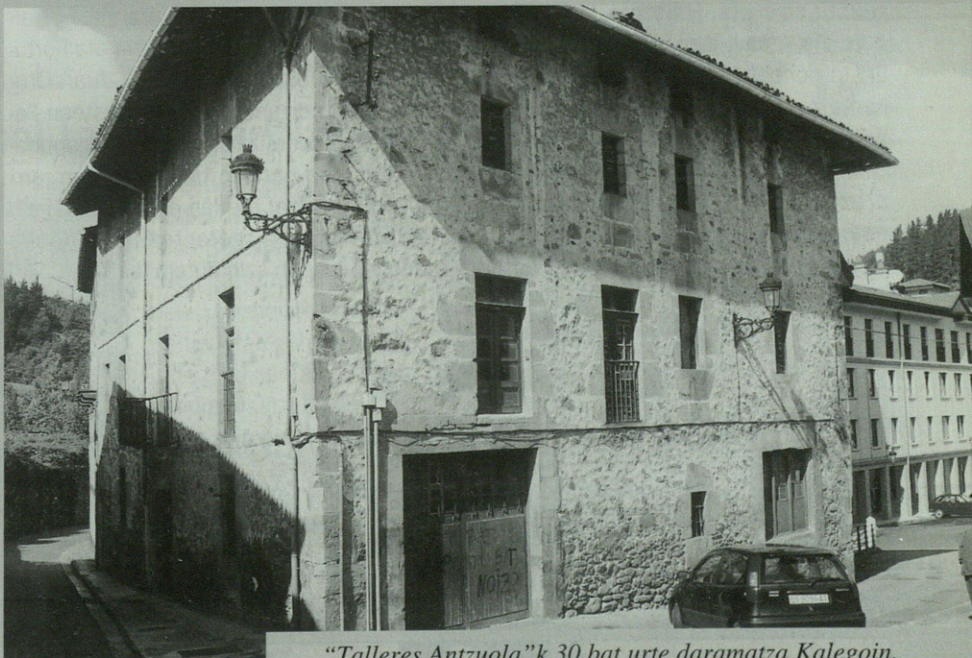
"Talleres Antzuola" k 30 bat urte daramatza Kalegoian.