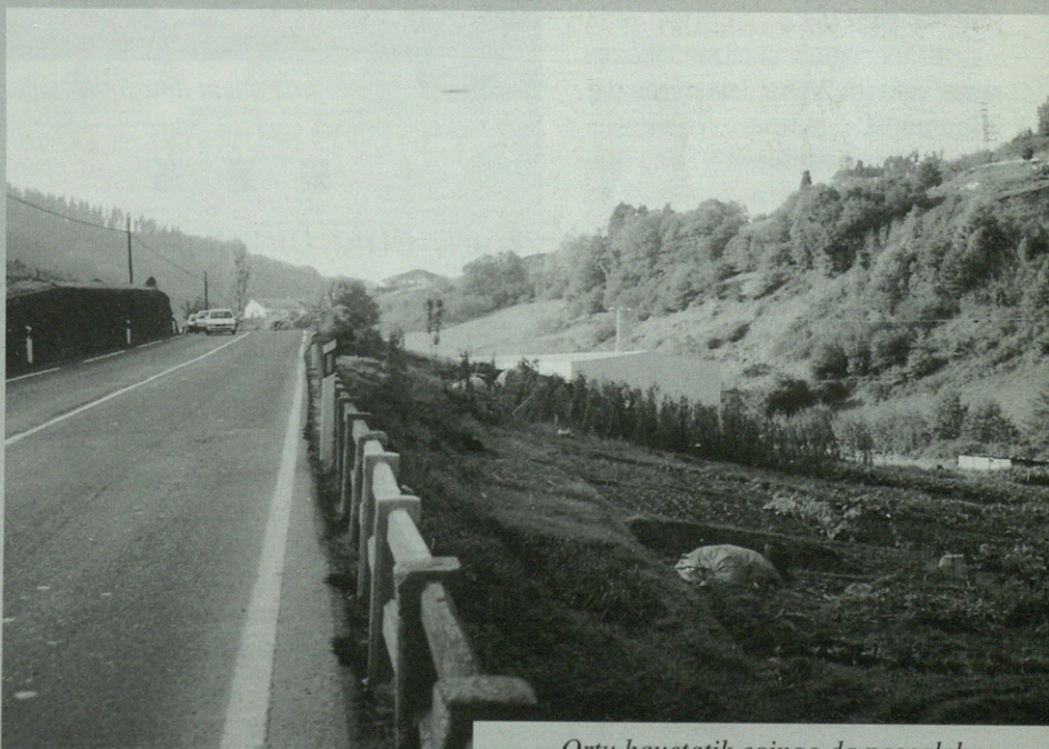
Ortu hauetatik egingo da pasealekua.

Honela pasabidea bide bazterretik pixka bat aldentzeko aukera izango du Udalak.