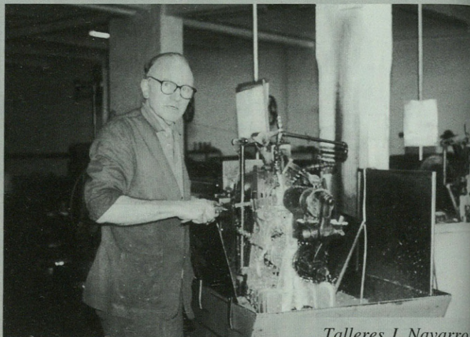
Talleres J. Navarro