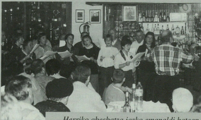
Herriko abesbatza iazko emanaldi batean.