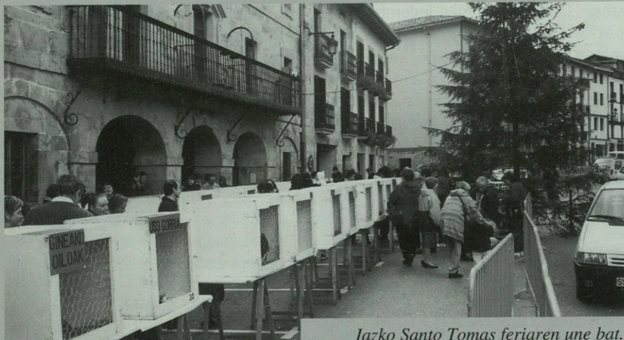
Iazko Santo Tomas feriarene une bat.