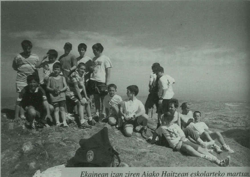
Ekainean izan ziren Aiako Haitzean eskolarteko martxan.

"Bai, gaurko umiak izango diralako biharko mendizaliak, eta etxe bat oiñari onekin jaso ezker, tinko eutsiko jao. Horixe da lortu biharrekua, gure nagusiak lagatako kataia ez apurtzia". Horretarako mugak ikusten dituzte gaur egun: "lehen 14 urtera arte ikisten zebe herri-xan eta eskolia erabiltzen gñuan umiak animatzeko. Oin Bergarara jua biharrekin, txikixenak besterik etxaku eskura geratzen. Horrek hutsune bat sortzen dosku". Honi aurre egiteko ahaleginak egin badituzte ere, oraingoz ez dute konponbiderik ikusten, eta alde horretatik edozeinen ekarpenak onartzeko prest daude. "Txikixaguekin moduz moldatzen gara, azkenengo irteeria ikusi besterik eztago; eguraldi txakurra egin arren 25 bat ume etorri ziran Karakatetik Elusu-