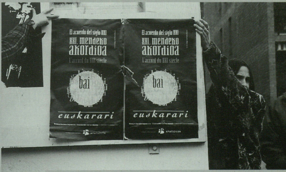
Gizarte osora zabaldu nahi da euskararen aldeko kanpaina hau.

Oraindik garbi ez dagoen arren, Deba Garaiko eskualdeko herritarrak Gasteizera joatearen aldekoak dira Gipuzkoako Kontseilukoak. Herritik autobusa ipiniko da jaialdira joateko.