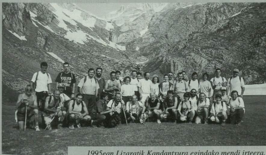
1995ean Lizaratik Kandantxura egindako mendi irteera.

tzea. "Talde gehixenetan federatuta ez-pazare ezin zara juan, ez Pirinioetako eta ezta beste batzutara be; zeozer pasau ezkeror orduan etortzen dira kontuak Ondo begiratuta, federatzia ezta hain garestixa. Batetik segurua daukuzu, baiña baita errefujixotarako erreserbia eta deskontua be, Pyrenaika etxian... Eta dana hillian milla pezeta baiño gutxiagoan". Diotenez, "aberi-xak eztira bakarrik edurretan edo eskalatzen egitten, gehixenak -estatistiken arabera- hemen zihar, bueltako mendixetan gertatzen dira; eta danok dakigu zelako kokotekuak emoten doskuen, bai medikuak eta baita errehabilitaziñuetan be norbere kontura egin ezkeror". Hori guztia kontuan hartuta, ezinbestekotzat jotzen dute federatzea. "Aurten nobedade mordo bat daren; Europarako segurua, esate baterako, desagertu egingo da, eta aukera berrixak agertu dira oso prezio onian". Badakizue, mendian seguru ibili nahi izanez gero, kasu egin!