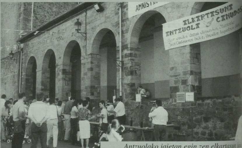
Antzuolako jaietan egin zen elkartasun jai