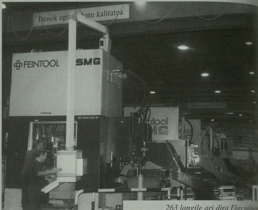
263 langile ari dira Elay taldean.

Gaur egun gelditzen zaien aukera bakarra, momentuz behintzat, asteburuetan lana egitea litzateke. "Beti saiatu gara asteburuetan lanik ez egiten. Behartuta egongo bagina, nire ustez aukera hori 35 orduko lan astearekin baino ez litzateke izango posible. Horrela bultzatzea batek astelehenetik ostegunera lan egingo luke eta bigarrenak, berriro, ostegunetik igandera bitartean. Horrela lehiakortasuna mantentzeko bidea egongo litzateke eta lan orduak gutxitzen, bizitzeko denbora gehiago izango genuke. Hori akordio arrazionala litzatekeela uste dut. Orain dela hamabost bat urte ordu extrak edo lanorduetatik kanpoko orduak kentzen ere, lehenengotariakoak izan ginen. Orain ez gara hasiko asteburuetan lanean, asteko lanorduek gutxitu barik!".