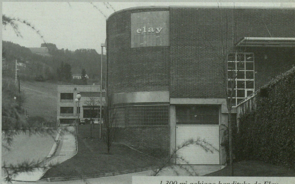
1.300 m 2 gehiago handituko da Elay.

Lizarraga auzoan dago Elay Taldearen egoitza nagusia. Orain gutxi bere heda-