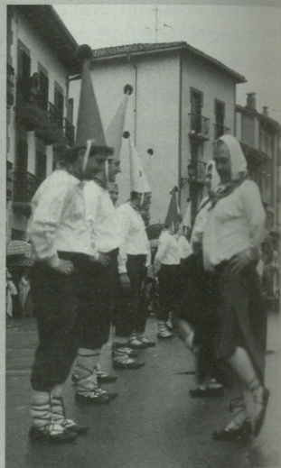
Iaz ere Sorgin dantza egin zuten mutilek plazan.

■ ■ ■ Domekan Iparraldeko Makila dantza eta Sorgin dantza ikusteko aukera izango da ■ ■ ■