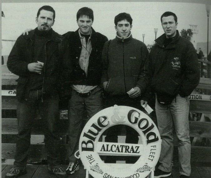
Alcatraz kartzela ospetsutik ere pasatu ziren lau pilotariak.

Urtero antolatzen dabe, urtian behin edo, jai bat eta pelotarixak juaten dira jokatzera. Hemendik juandako euskaldunak, oin han bizi diranak, alkartzen dira eta jai bat egitten dabe. Eurak antolatutako biakia izen zan eta euren konturra izen da dana. Guri etzuskuen lagatzen ezer pagatzen.