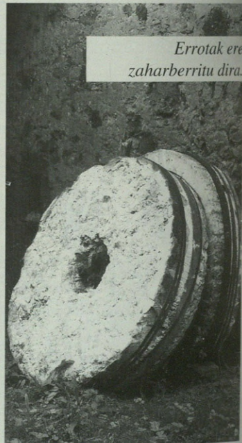
Errotak ere zaharberritu dira.

Dirulaguntzak eskatzeko epea datorren hilaren amaieran bukatuko da. Beraz, horrelako lanen bat egin nahi duzuenok, adi!