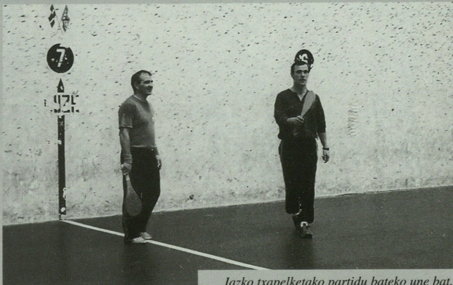
Iazko txapelketako partidu bateko une bat.