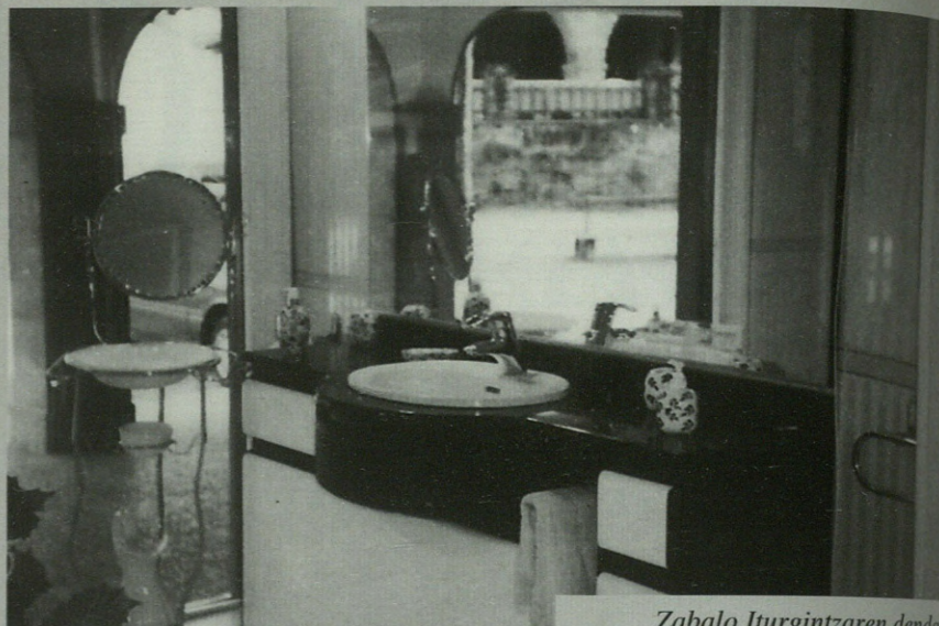
Zabalo Iturgintzaren denda.

Hori dela eta, Foru Aldundiaren dirulaguntzaz 1997an ikastaroak eratu zituzten eta horiek gauzatzeko, ADC enpresa ere eratu zuen Iturginek. Baina