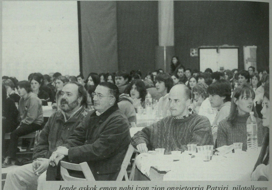
Jende askok eman nahi izan zion ongietorria Patxiri, pilotalkuean.