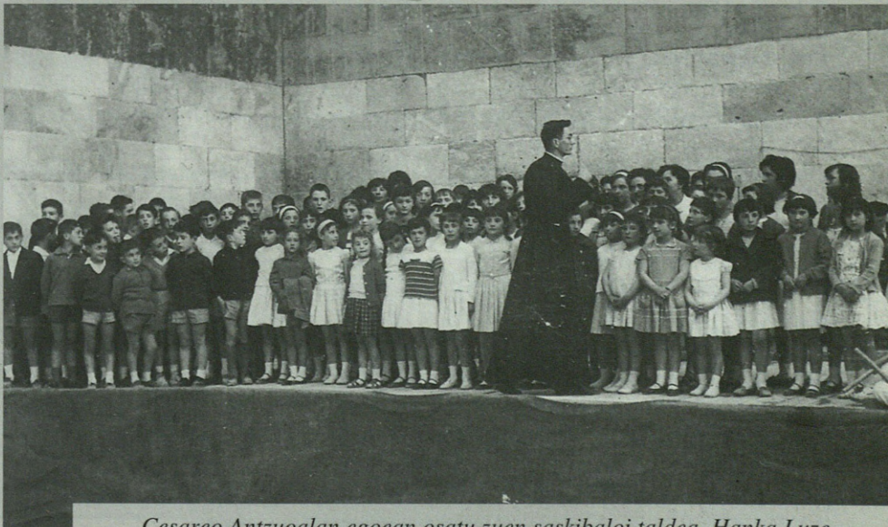
Cesareo Antzuolalan egoean osatu zuen saskibaloi taldea, Hanka Luze-

Ikerketa beka honetara aurkezteko lizentziatu titulua izan behar da. Bekak 700.000 PTA-ko dirulaguntza aurreikusten du. Eskariak aurkezteko epea maiatzaren 31n amaituko da. Norberaren datuez gain, lana zela egingo litzatekeen azaltzeko memoria bat aurkeztu beharko dute interesatu guztiak.