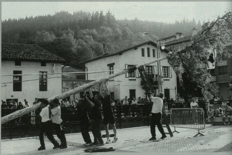
Arbolia igoko da Kalebarrenen zapatuan.

Domekan, txistularien kalejirak emango dio hasiera egunari eta 11:30etan meza, salda eta txorizoa. Eguerdian, 12:30etan, dantzariak eta trikitilari gazteen kalejira eta 16:30etan mus txapelketa. Sari bikainak daudela jakin dugunez, izena ematera animatu nahi dituzte antolatzaileek antzuolar guztiak. Amaitzeko, 18:30etan, gaztetxoendako Txorontpio, Pantxi eta Pantxo pailazoen saioa.